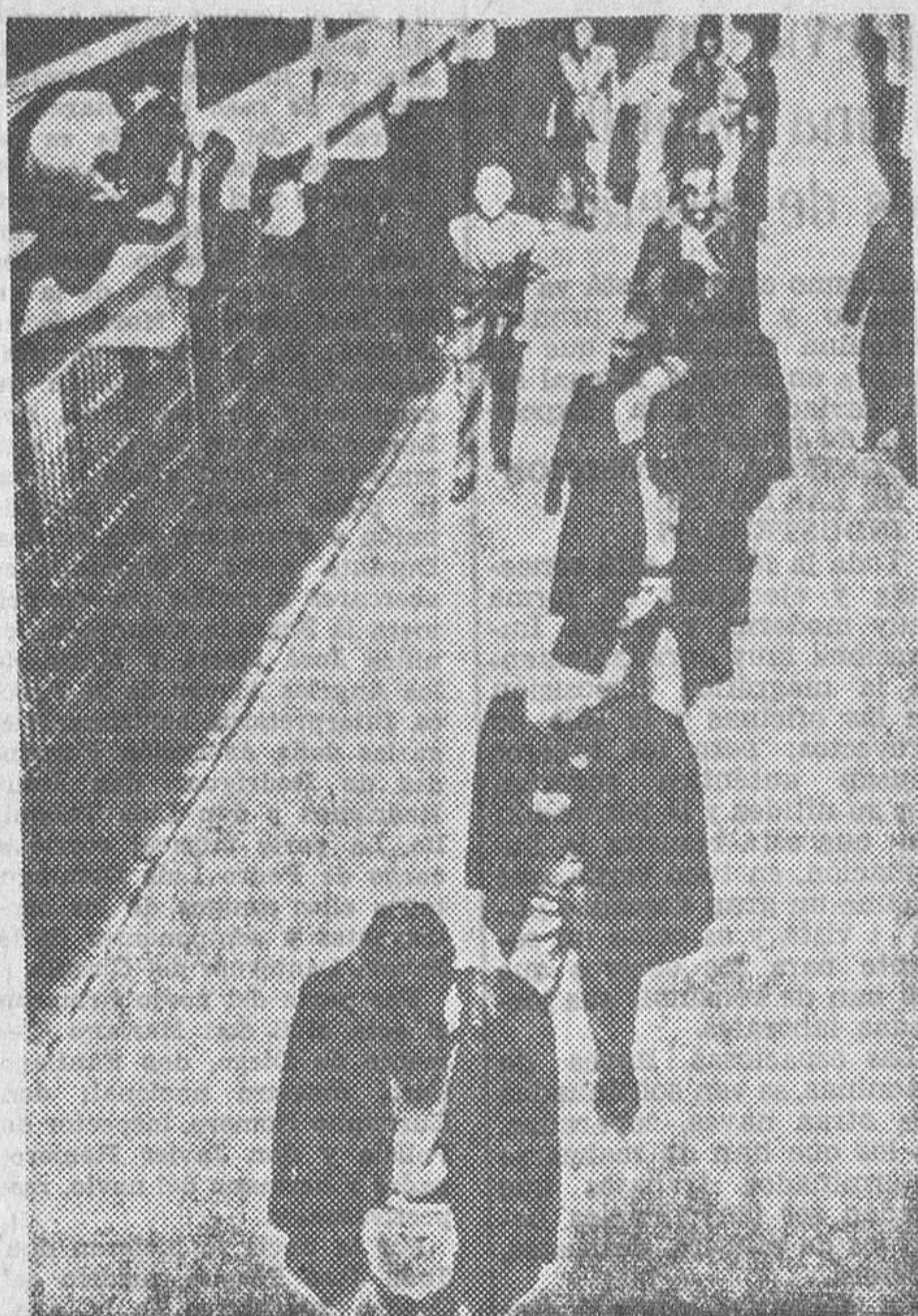
Los últimos presos de Alcatraz abandonan la prisión, cuando la "Isla del Diablo" fue clausurada.