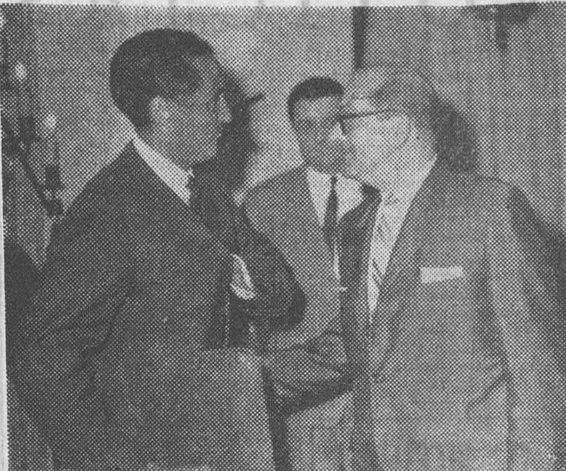
El ministro de Industria, señor López Bravo, conversando con el subcomisario del Plan de Desarrollo, momentos después de su llegada a nuestra ciudad.

Fue recibido por el subcomisario del Plan de Desarrollo autoridades locales y gerente del "Polo" de Promoción Industrial Hoy inaugurará las cuatro primeras fábricas del "Polo"