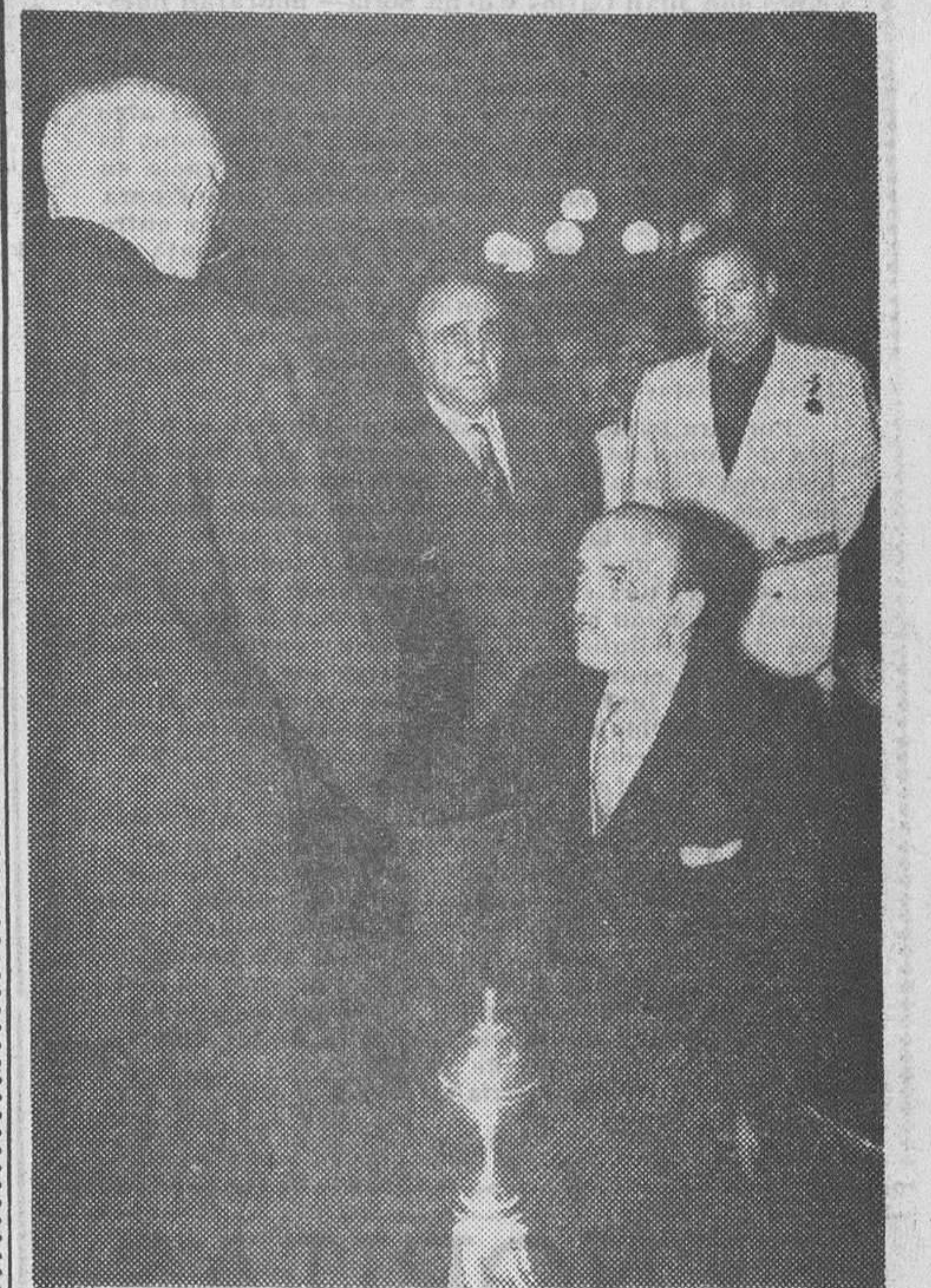
El nuevo ministro de Comercio, don Faustino García Monco, prestando juramento ante el presidente de las Cortes españolas, don Esteban Bilbao, en el primer Pleno de aquéllas celebrado en Madrid y al que por primera vez ha asistido el nuevo Gobierno.