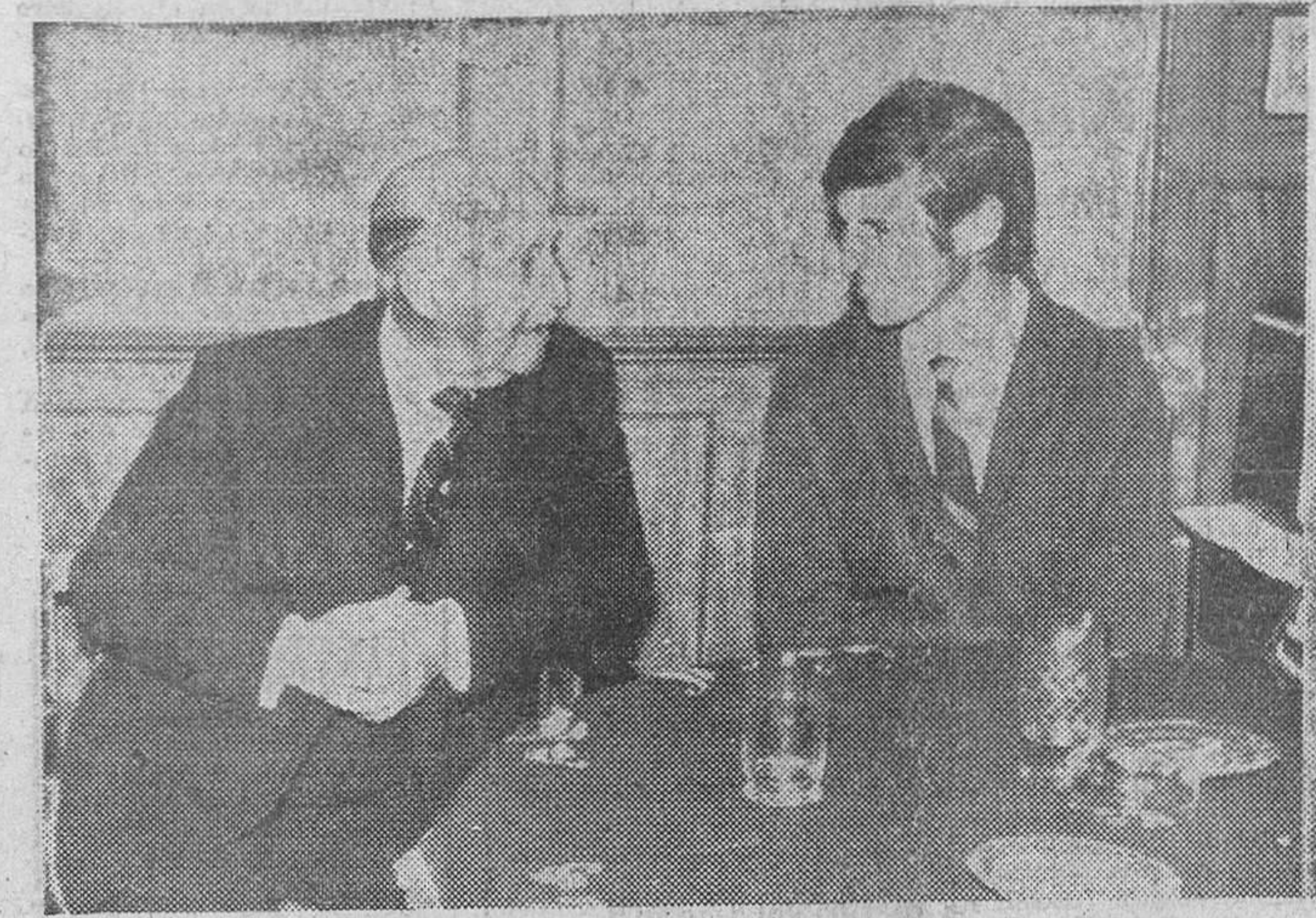
Su Excelencia el Jefe del Estado asistió a una cacería celebrada en una finca próxima a Torrijos, en la provincia de Toledo. También estuvo en la cacería el famoso diestro Manuel Benítez «El Cordobés», que pocas horas después emprendía viaje a Méjico.