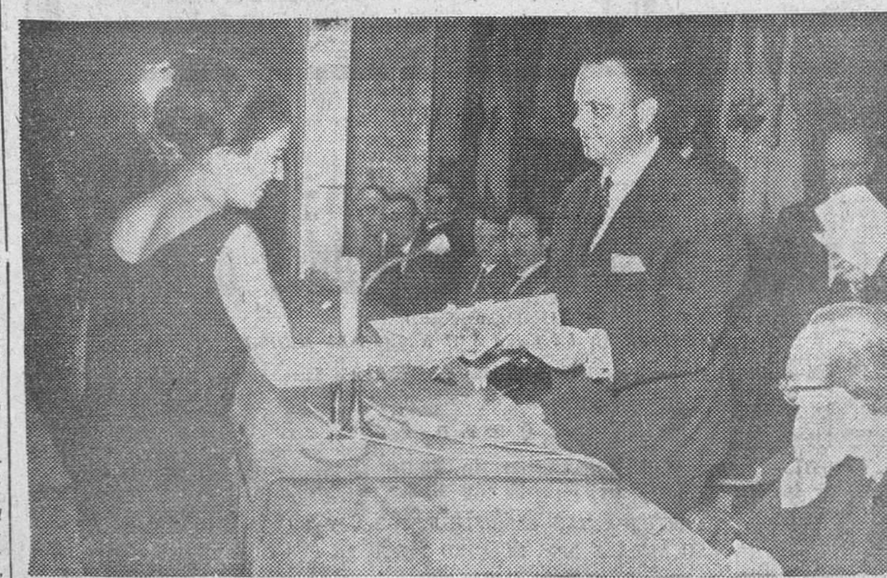
El ministro de Información y Turismo, don Manuel Fraga Iribarne, entregando el correspondiente contrato a uno de los ochenta y tres profesores de la nueva orquesta Sinfónica de la Radiotelevisión Española, acto celebrado en el Ministerio, en Madrid.