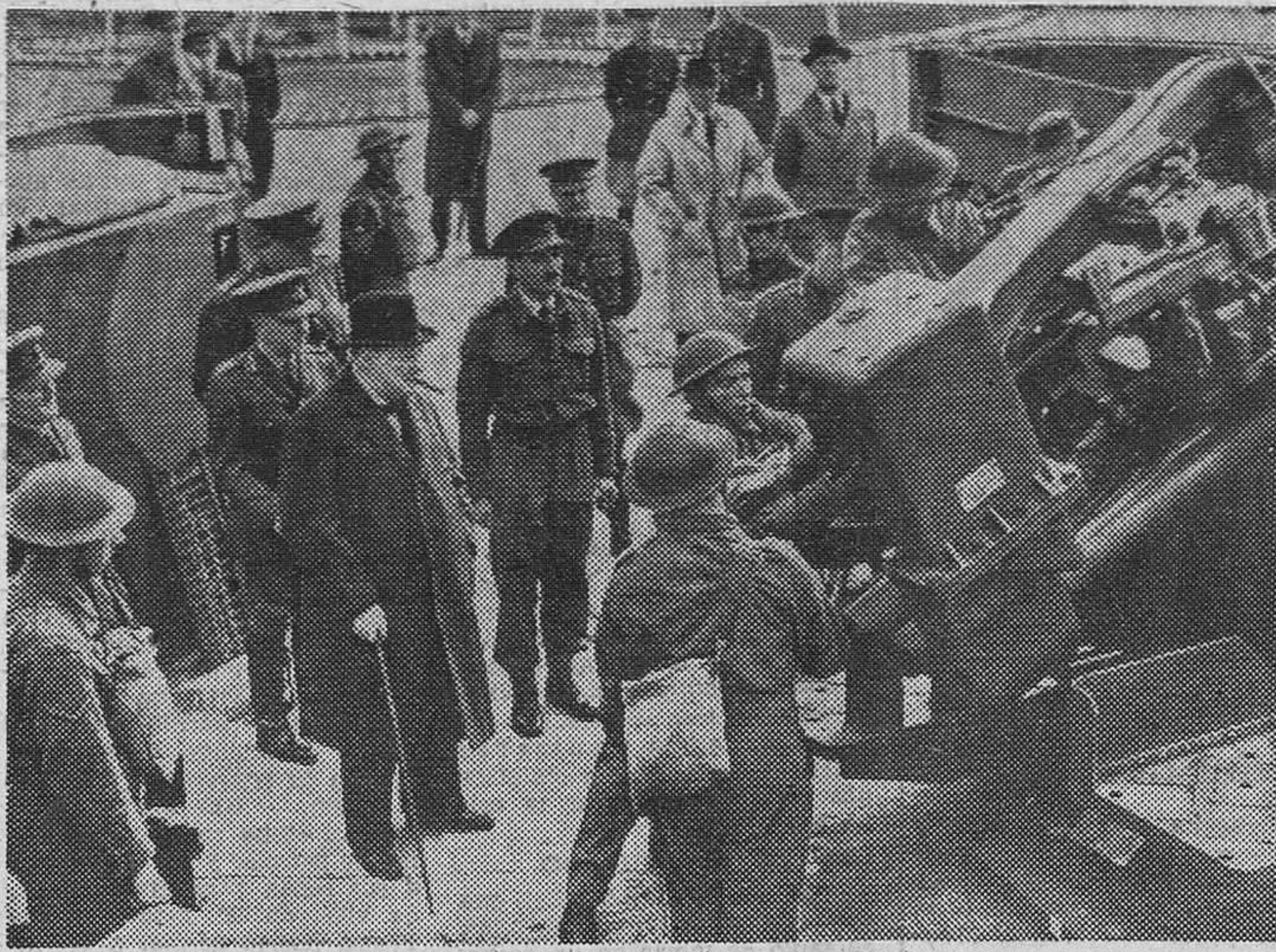
Sir Winston Churchill visitando una batería antiaérea en los alrededores de Londres, durante los dramáticos días de la batalla de Inglaterra, de 1941.

Me referí en mi anterior artículo a los fabulosos poderes de concentración de Sir Winston Churchill. Su pasión por el detalle es bien conocida. Naturalmente mantenía a todo el mundo en estado de alerta, por mucho que todos se quejaban acerca de sus telegramas impertinentes y sus intervenciones. Le encantaba recibir una corriente continua de estadísticas y gráficos, preparados para él por nosotros o por su oficina estadística privada, dirigida por el profesor Lindemann (más tarde Lord Cherwell). Si alguien sugería que la corriente podía ser disminuida condensando los informes que le eran enviados, Churchill concluía inmediatamente que alguien estaba intentando esconderle algo. En seguida pedía más información que antes.