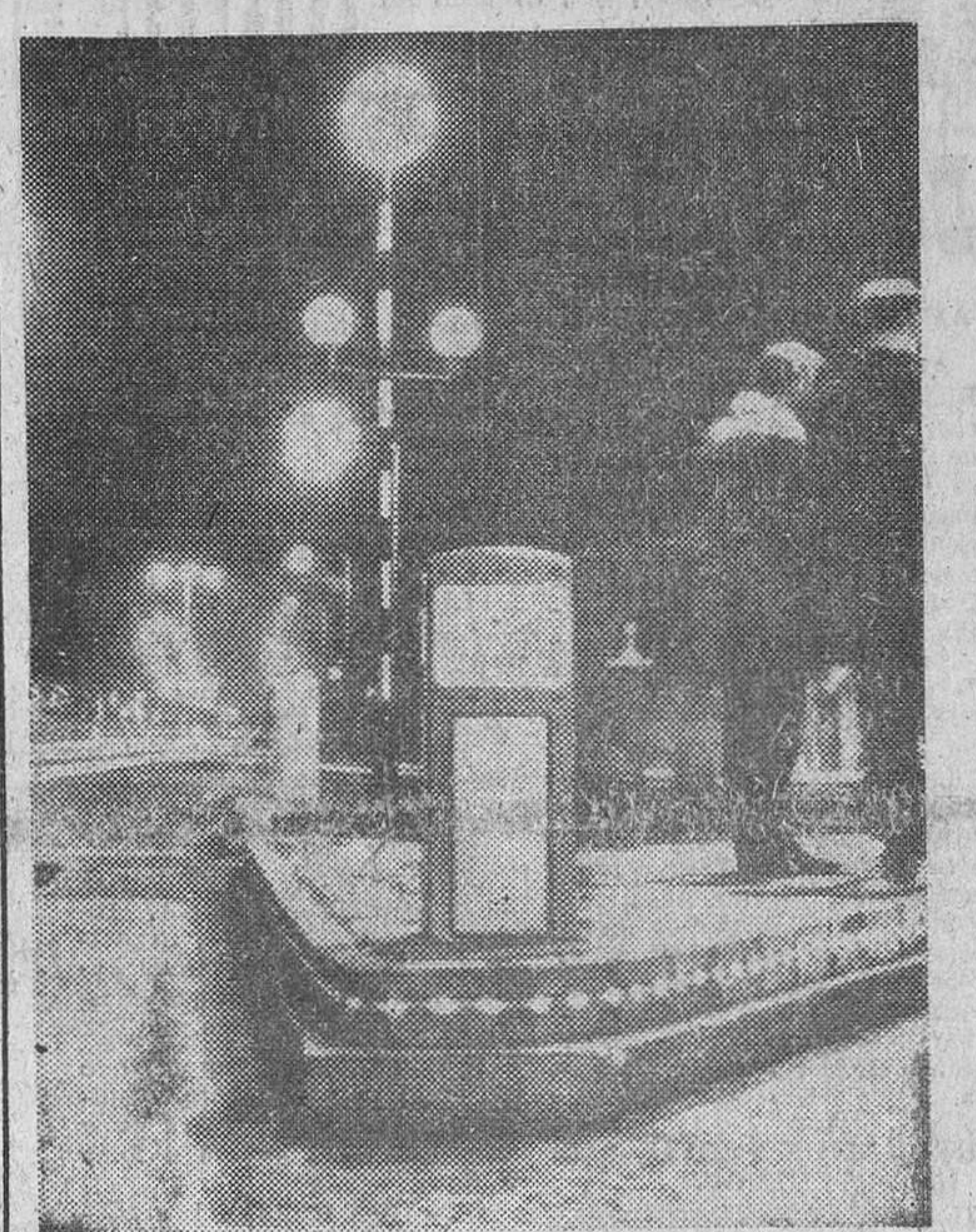
El cruce de carreteras de Clapham Common North y Elspeth Road, al suroeste de Londres, con el nuevo sistema de iluminación instalado en los bordillos contra la niebla. El invento, llamado «Luminis», consta de luces amarillas que destellan hasta una distancia de unos 500 metros, instaladas en las piezas especiales de cemento montadas en los bordillos de aceras urbanas y de carreteras.