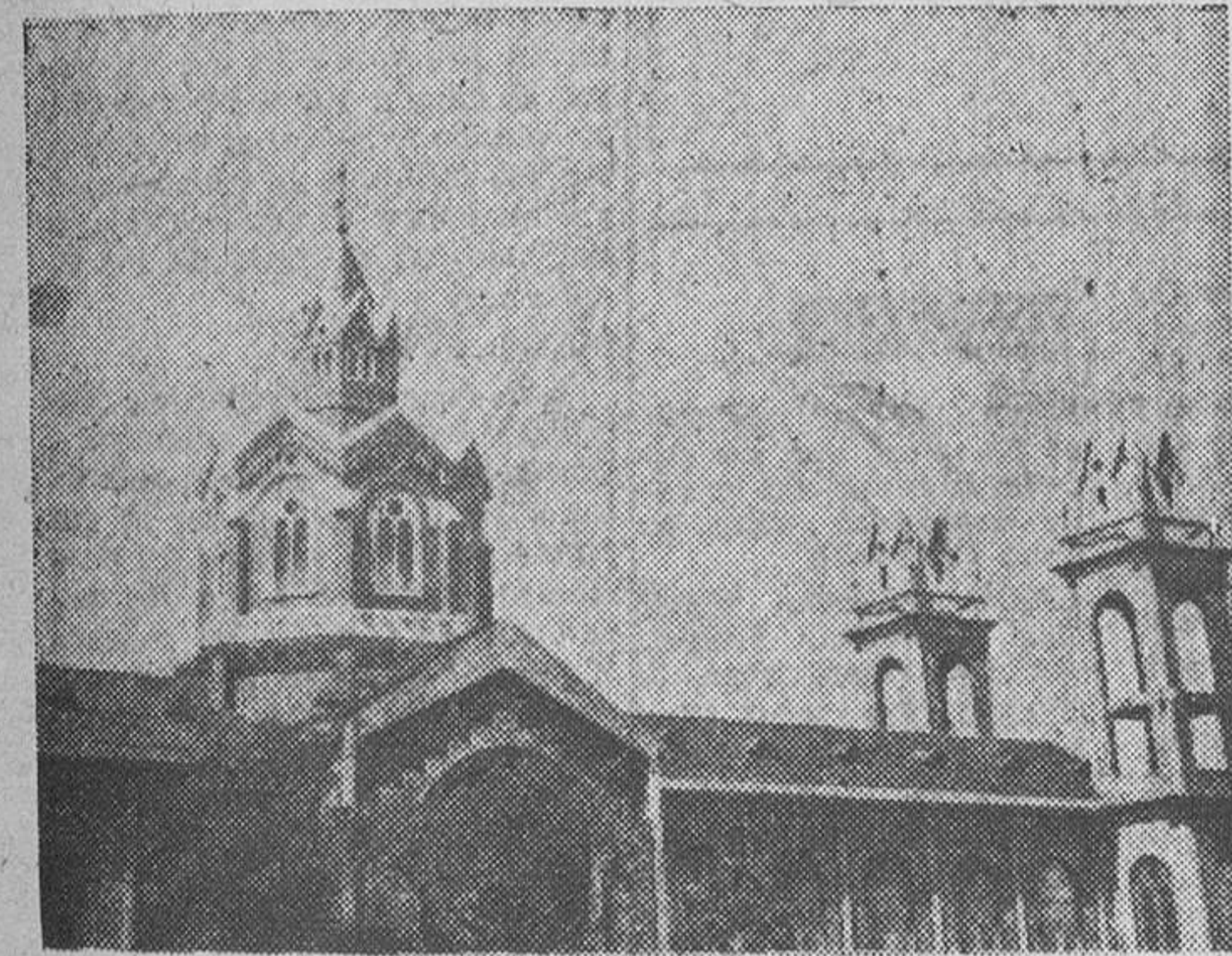
Detalle de la nueva Abadía de San Benito, proyectada y realizada por el finado religioso burgalés P. Eleuterio González

«Después de la victoria, la escuadra inglesa se retiró de Vigo, dejando algunas unidades con la misión de recoger lo que había sido capturado y transportarlo a Inglaterra. El 6 de Noviembre, una de estas unidades, el «Mannouth», partió para formar una barrera en la