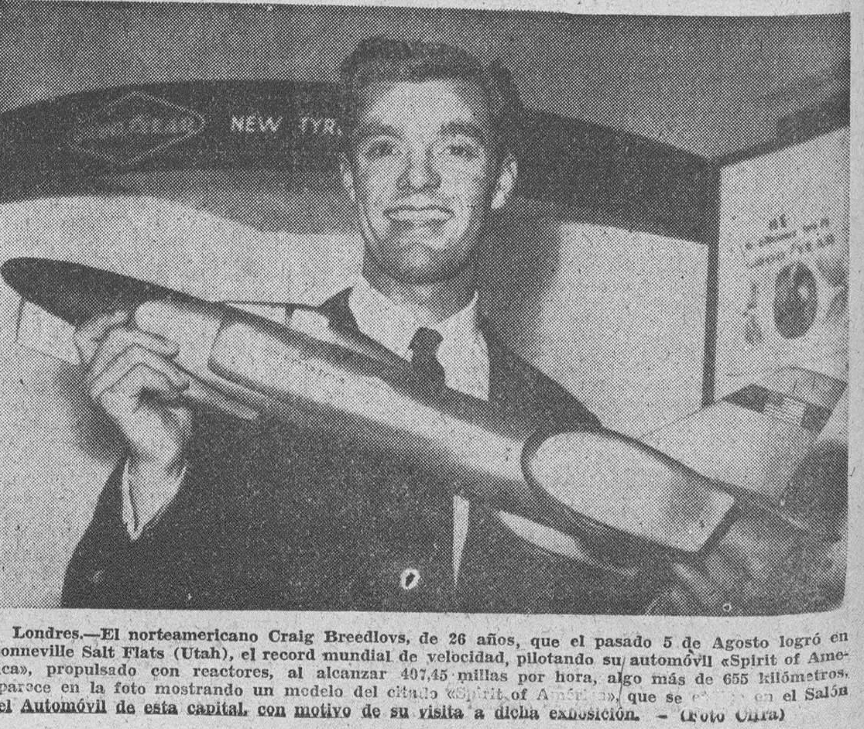
Londres.—El norteamericano Craig Breedlove, de 26 años, que el pasado 5 de Agosto logró en Bonneville Salt Flats (Utah), el record mundial de velocidad, pilotando su automóvil «Spirit of America», propulsado con reactores, al alcanzar 407,45 millas por hora, algo más de 655 kilómetros. Aparece en la foto mostrando un modelo del citado «Spirit of America», que se exhibe en el Salón del Automóvil de esta capital, con motivo de su visita a dicha exposición.