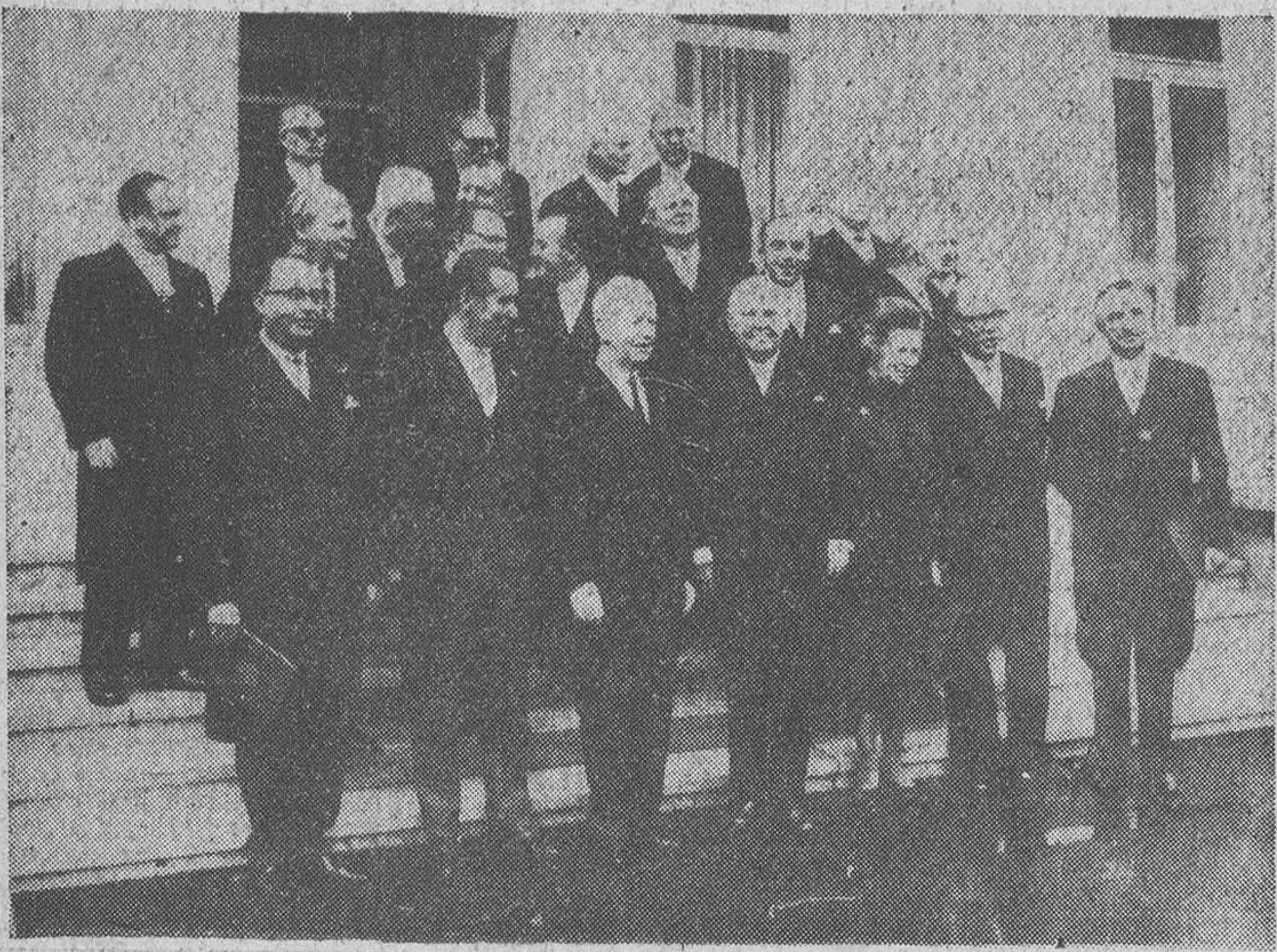
Bonn. — He aquí los miembros del nuevo Gobierno de la República Federal alemana, que preside el canciller Ludwig Erhard, quien aparece en la foto junto al presidente de la República, Heinrich Lübke, y la ministro de Sanidad, Elisabeth Schwarzhart.