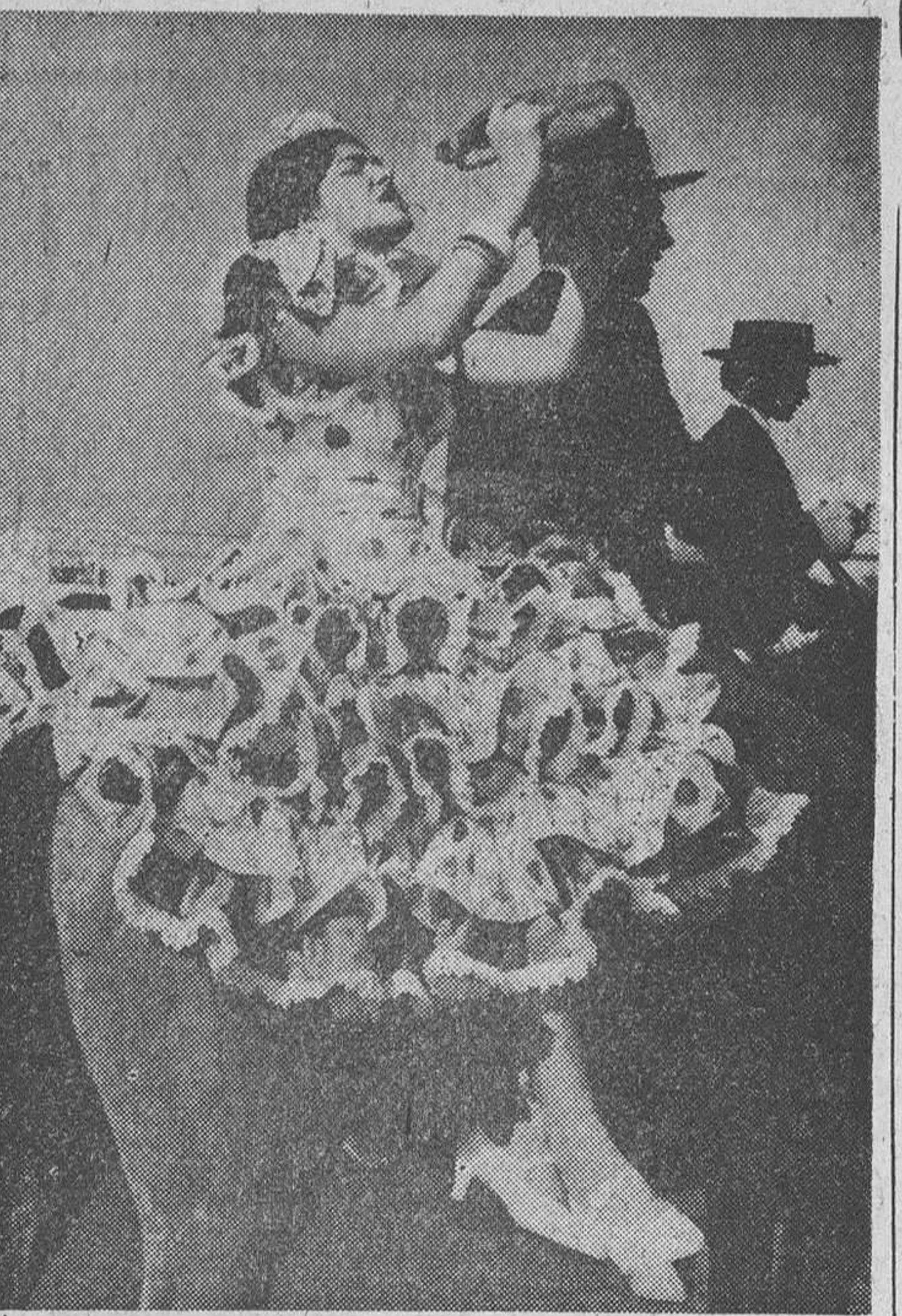
Dos Hermanas (Sevilla).—Como todos los años, la imagen de Nuestra Señora de Valme, es llevada en romería desde Dos Hermanas a la ermita situada en las proximidades de Sevilla, ermita que fue construida en el lugar donde estuvo el campamento del Rey San Fernando, cuando puso cerco a la ciudad. Todo el color, la luminosidad y el alegre fervor de los andaluces, se concentra en esta manifestación de devoción mariana. La foto recoge un momento de la tradicional romería.