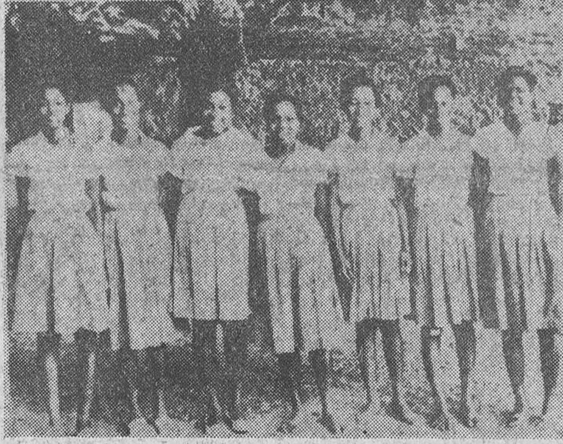
Zanzibar. — Las muchachas de Zanzibar se van deshaciendo gradualmente de sus galas musulmanas de siglos de antigüedad. Estas jóvenes que aquí presentamos, son miembros de un Club femenino de la isla, y detrás de altas vallas, lejos de la mirada de ojos curiosos, juegan al baloncesto. El fotógrafo, poco a poco, las convenció para estas dos fotografías. — (Foto Cifra)