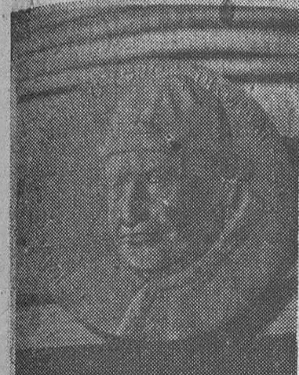
Medalla con la efigie de Su Santidad Juan XXIII que ha sido distribuida a todos los prelatos participantes en el Concilio...

Ofrece una sugestiva y multicolor historia de la Asamblea eclesialística