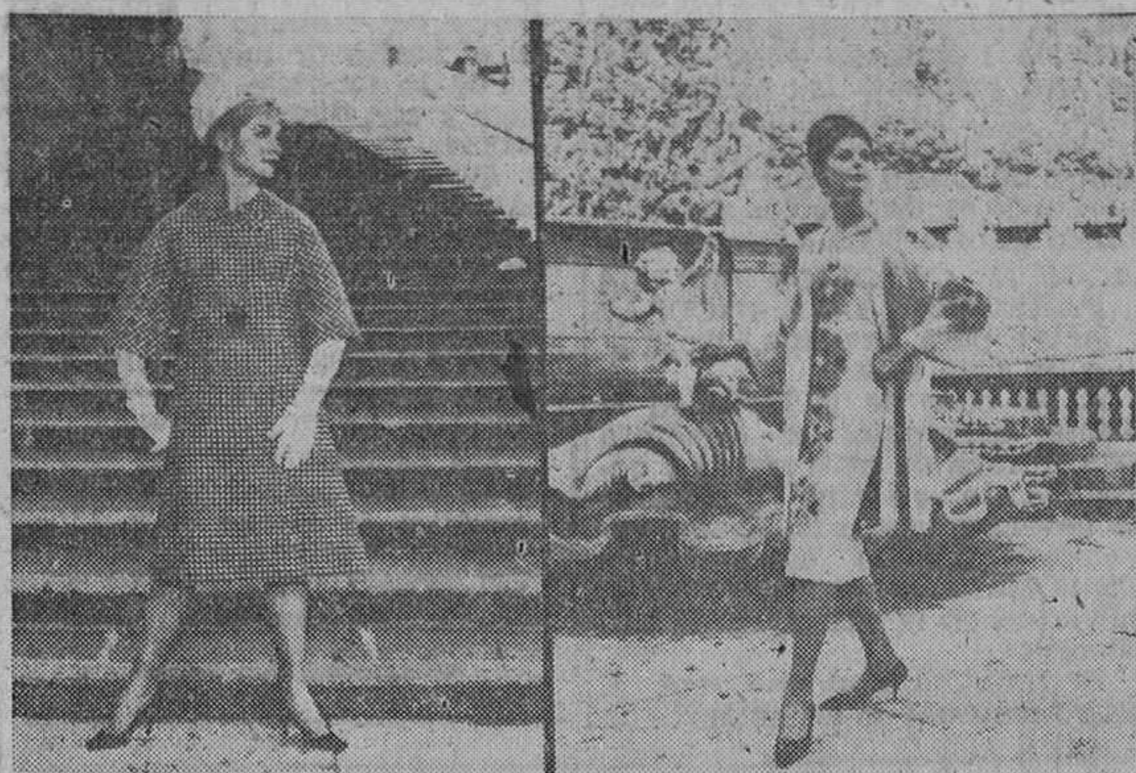
Presentación de la moda romana

La declaración de la «guerra de los encajes», está a punto de estallar en los próximos días. Durante una semana, del 23 al 30 de Julio, los modistas de París van a librar su batalla en el ambiente elegante y apacible del Distrito XVII. Combate de blondas inofensivas, sin víctimas físicas, incruento en sus manifestaciones exteriores, pero decisivo, implacable, y con un resultado que afecta a millones de mujeres del mundo entero. «La guerra de los encajes» y su resultado será la que decida para los futuros seis meses la línea de la elegancia. Todo está a punto, casi preparado, aunque en las últimas horas que preceden a este combate se mantiene el más riguroso secreto en torno a las fuerzas que van a ser lanzadas al campo de batalla. En cada una de las casas de los modistas un auténtico ejército de guardaespaldas custodia celosamente los secretos. El enemigo de estas vísperas está personificado en los periodistas, atentos a ser los primeros en desvelar los secretos. Ante ellos, intangible pero material, se alza el «teñón de seda».