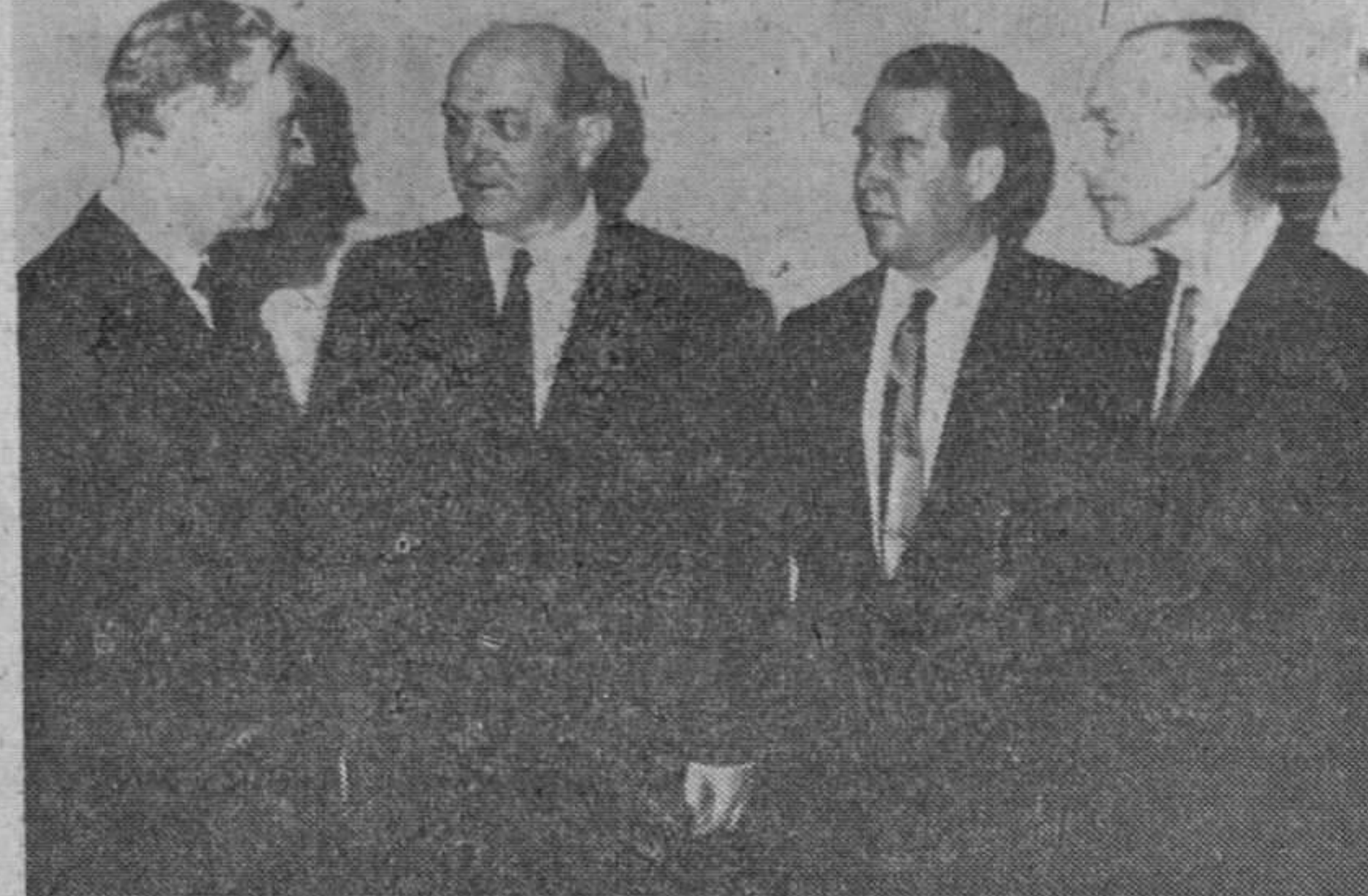
Ginebra. — He aquí a los ministros de Asuntos Exteriores de los «cuatro grandes» llegados para celebrar la conferencia sobre Laos. — (Foto Europa Press)