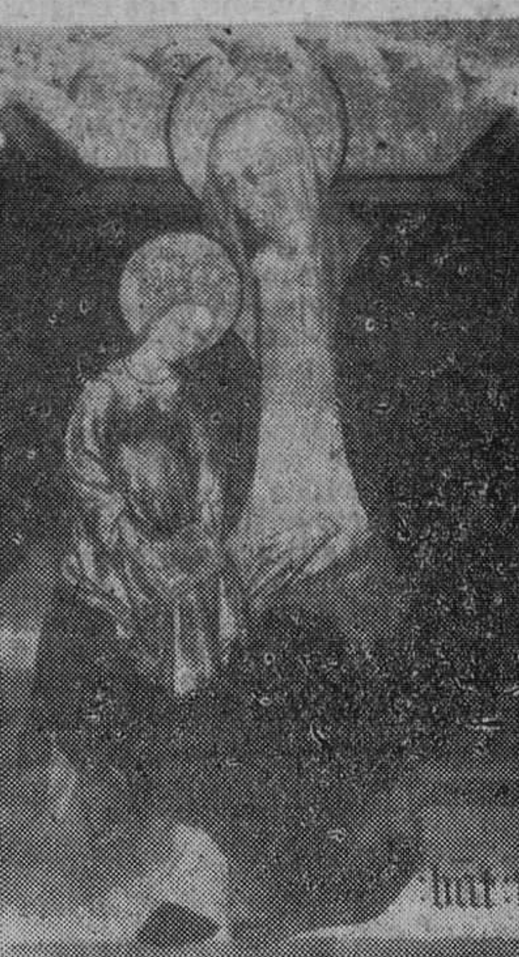
Santa Ana y la Virgen Niña, fragmento de un retablo del siglo XIV, de Bernardo Montferri, perteneciente a la escuela catalana.

Mujeres embarazadas y mujeres estériles, de diversas clases sociales y procedentes de todos los distritos de Roma, se reunirán en conmemoración religiosa de súplica, hoy, día 26, en una pequeña iglesia comprendida en el recinto de la Ciudad del Vaticano, como ocurre todos los años en la festividad de Santa Ana. Las que se hallan en estado de buena esperanza, acuden a dicho templo —portadoras de velas y sudorosas por el fuerte calor romano, más sensible para ellas por su propia gravedad— para pedir a Santa Ana, madre de María que no sea largo ni difícil, sino breve y feliz, el trance que aguardan. Y a esas futuras madres se unen, en tal ocasión y lugar, bastantes mujeres estériles (como lo fue durante mucho tiempo Santa Ana, hasta que concibió a María, cuando ya desesperaba de tener descendencia) para implorar, silenciosas pero apasionadamente, la fertilidad de su seno, la capacidad de generación.