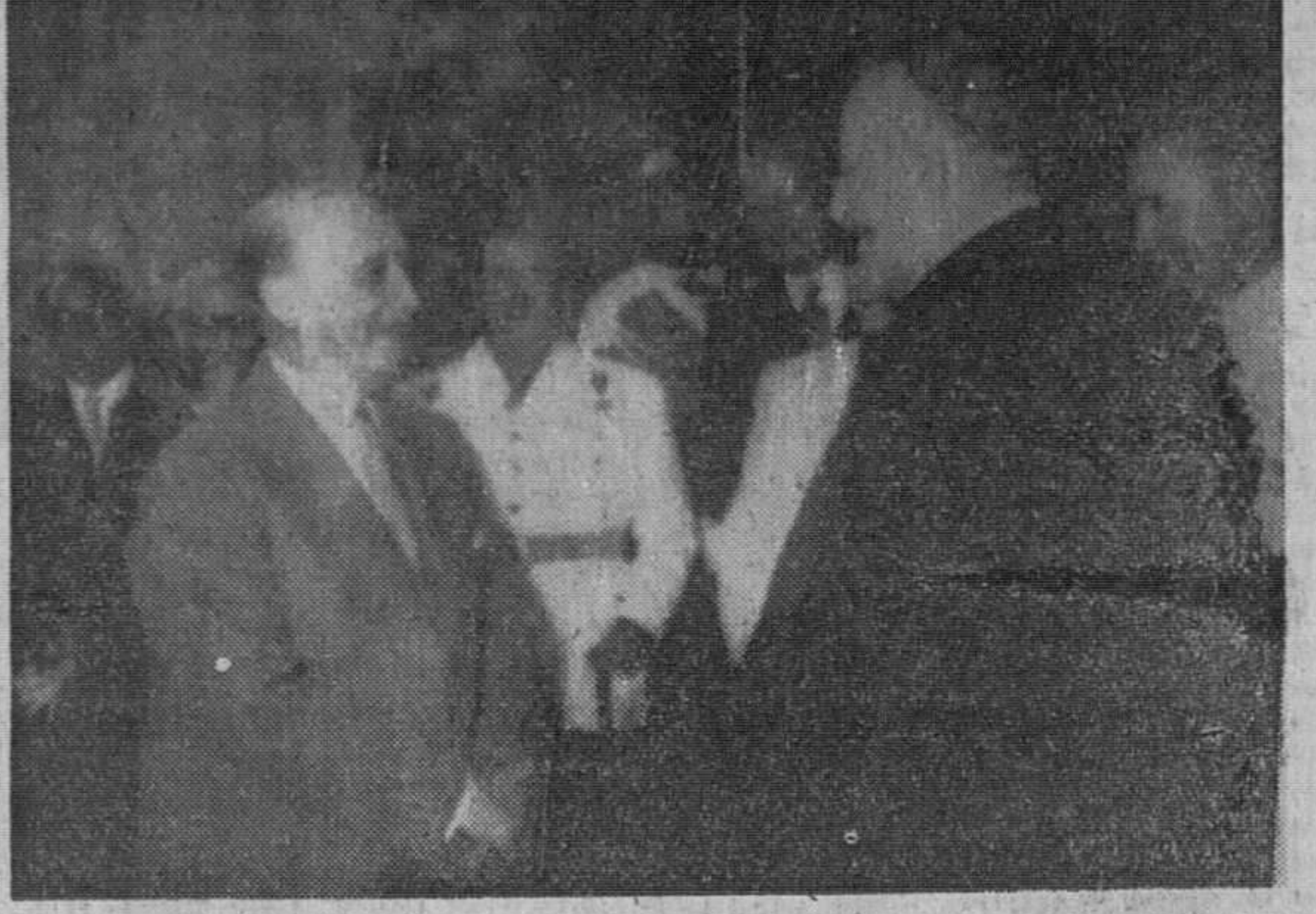
La Coruña. — S. E. el Jefe del Estado conversa con el arzobispo de Santiago, Cardenal Quiroga Palacios, momentos después de su llegada al Pazo de Meirás.

LA FESTIVIDAD DE SANTIAGO APOSTOL, EN NUESTRA CIUDAD Con el acostumbrado esplendor y gran brillantez se celebró ayer en Burgos la festividad de Santiago, Apóstol, Patrón de España. De los actos patronales organizados por el Arma de Caballería y los Cuerpos de Telecomunicación, ofrecemos las precedentes placas, en la primera de las cuales se recoge un momento del desfile de tropas de la Agrupación blindada España número 11, ante las autoridades, mientras en la segunda aparece un grupo de concurrentes a la ceremonia con que honraron a su Patrón los Cuerpos de Telecomunicación. — (Información, en séptima página.)