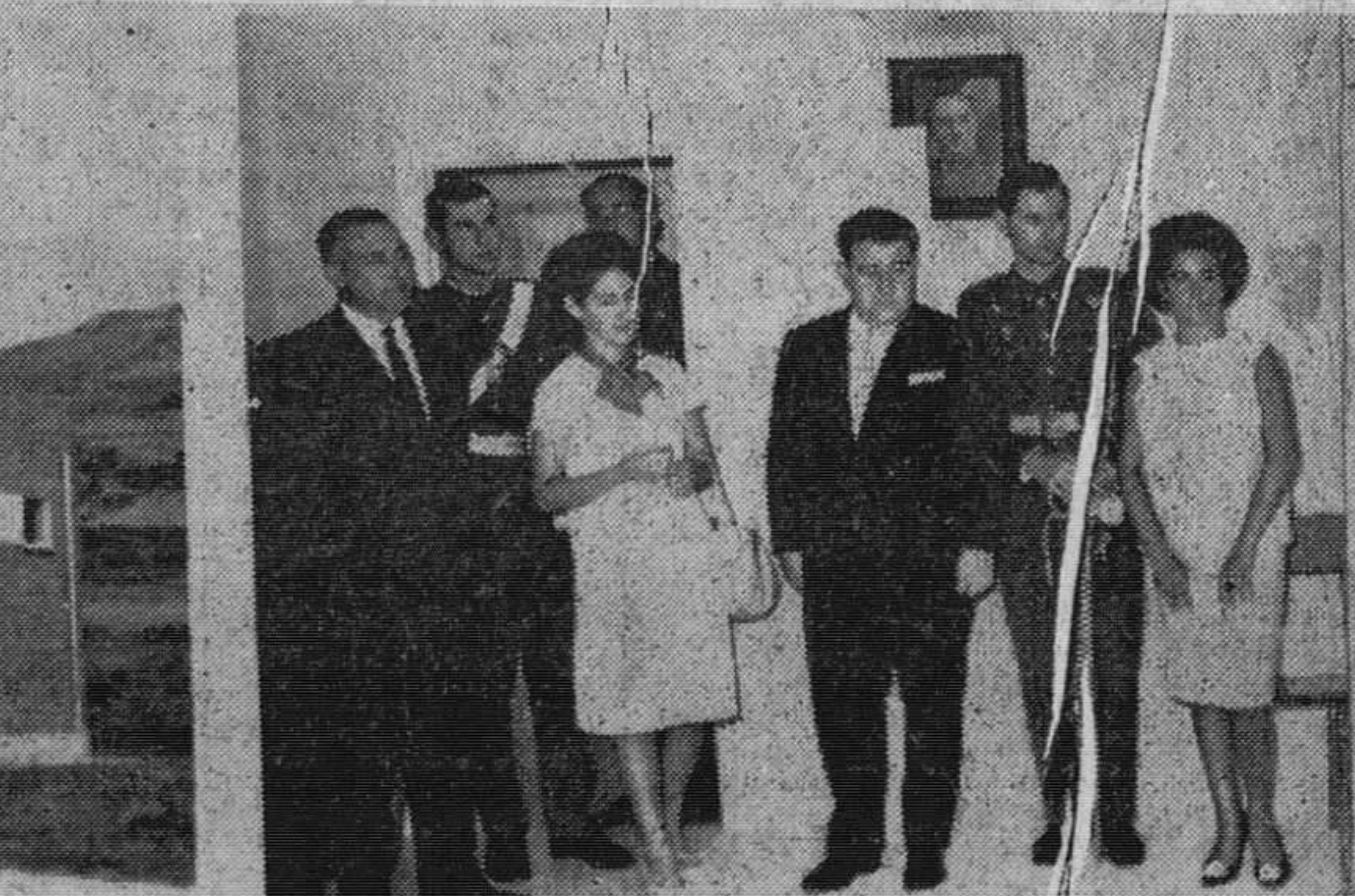
Ayer quedó inaugurado el albergue recién construido para los hijos aparecidos a la derecha del transeúntes. Lleva el nombre del finado capitán general de la región, teniente general Oliver Rubio, cuyos hitos figura en primer término. (INFORMACION EN SEGUNDA PAGINA)

DECLARACION DE KENNEDY Washington.—El presidente Kennedy ha declarado que se siente optimista en torno a su conversación con el embajador soviético, Anatoly Dubyrynin, sostenida en la Casa Blanca y puso de relieve que tiene esperanzas de que sirva para preparar el terreno para las conversaciones sobre Berlín y otros problemas, en una atmósfera más amistosa. El presidente midió bien las palabras durante su conversación con Dubyrynin, al objeto de que sus puntos de vista sobre las relaciones entre la Unión Soviética y Estados Unidos queden claros para el Kremlin.—Efe. LA CONFERENCIA DEL DESARROLLO Ginebra. — Estados Unidos expresaron hoy su satisfacción por la aceptación de Rusia de los propuestos porcentajes de reducción de armamentos para cada una de las fases comprendidas por los delegados norteamericanos en la Conferencia del desarrollo. No obstante, el delegado norteamericano, Arthur Dean, dijo que deploraba el texto de la pro-