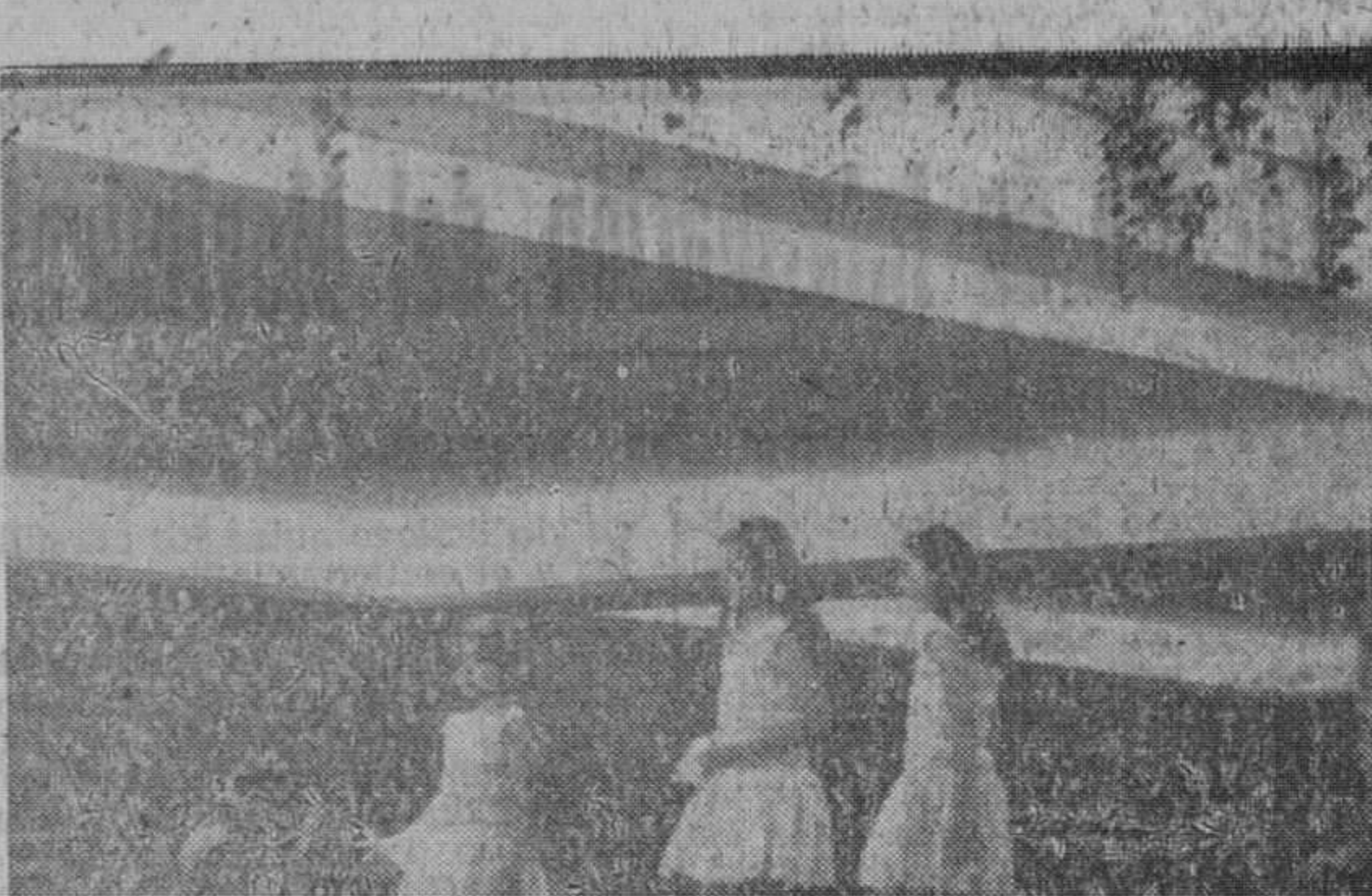
Desfile de modelos infantiles Madrid.—En los jardines de Cecilio Rodríguez, de El Retiro, se ha celebrado un desfile de modelos infantiles, con motivo de la «Semana Nacional del Algodón». El acto fue presidido por la esposa de Su Excelencia el Jefe del Estado y en el desfile participaron las niñas de la ilustre dama.

Se regulan los auxilios a ancianos y enfermos Normas para la percepción Madrid.—La concesión de los auxilios que establece el artículo 27 de la vigente Ley de presupuestos en favor de ancianos y enfermos, se regulará por las normas del Decreto de la Presidencia del Gobierno que publica hoy el «Boletín Oficial del Estado».