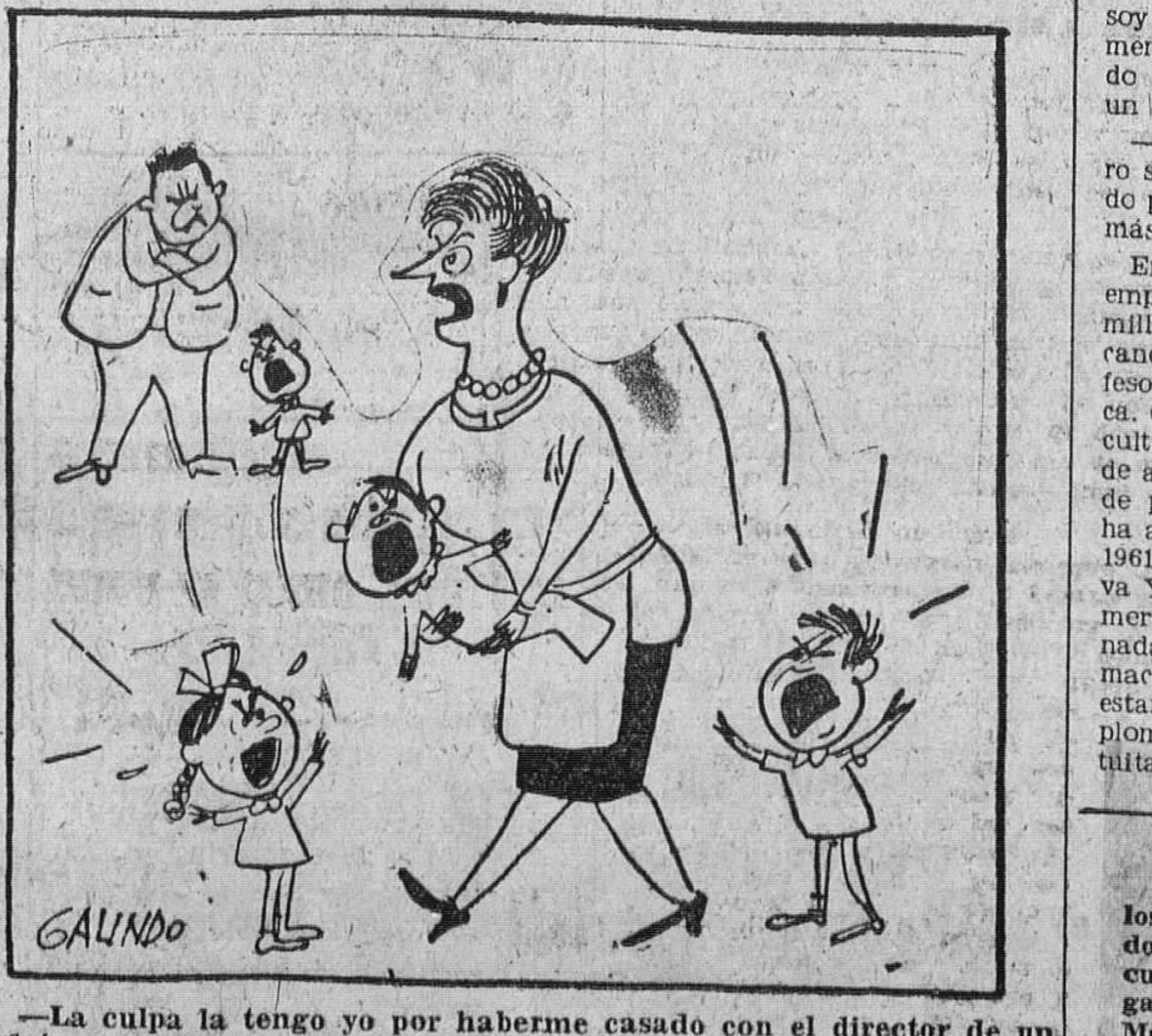
—La culpa la tengo yo por haberme casado con el director de un orfeón.

¡SERVIDORA DOMESTICA! Cada seis meses y a través de los cartones debes canjear la hoja donde pegaste los cupones de tus cuotas mensuales, pues ellos son garantía de tus derechos en el Montepío Nacional del Servicio Doméstico.