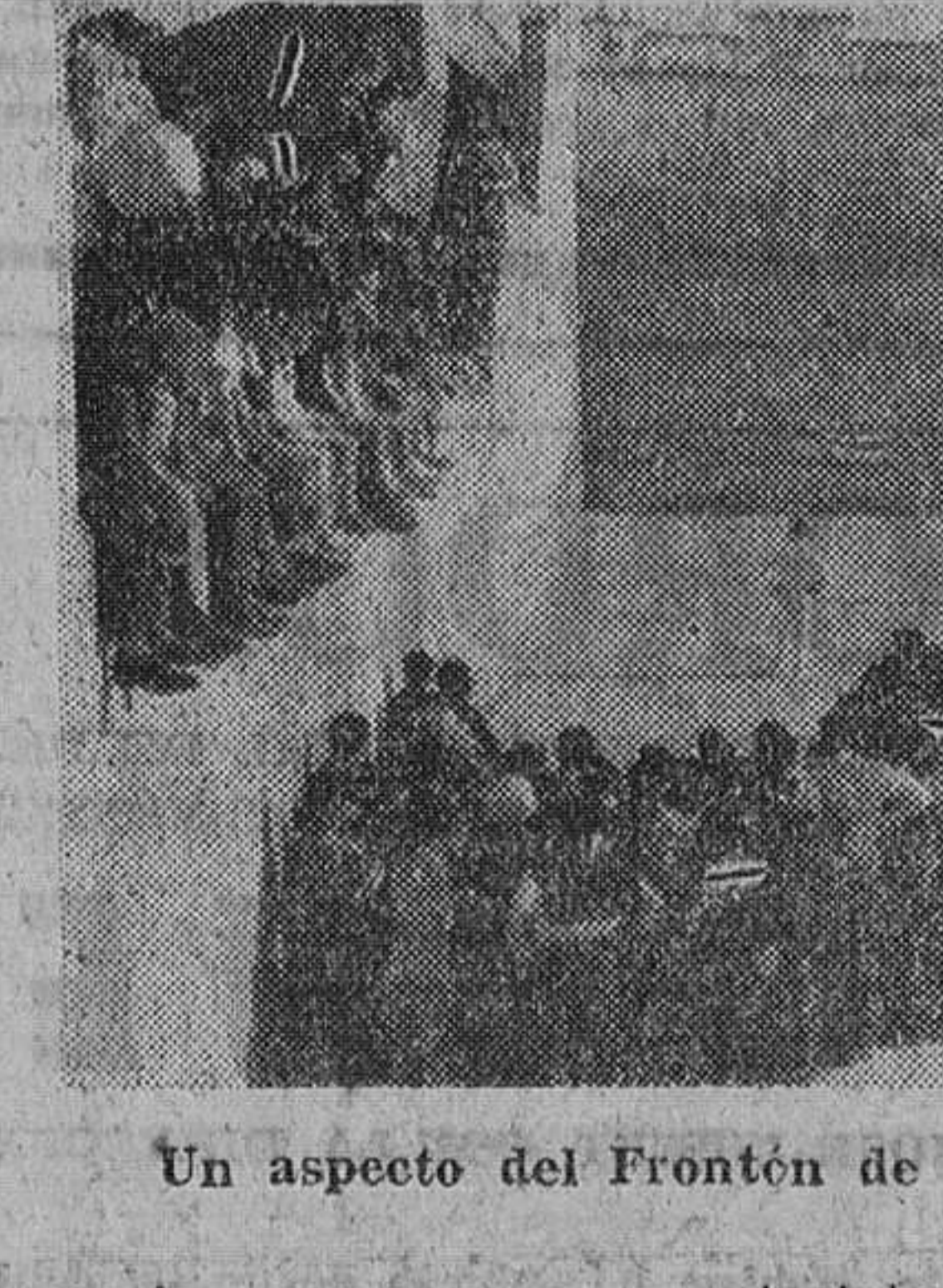
Un aspecto del Frontón de Roa completamente abarrotado.

Magnífico éxito sin precedentes en los Campeonatos comarcales de Pelota a mano que organiza la Asociación provincial de Juventudes, bajo el patrocinio de la Caja de Ahorros Municipal de Burgos y que se celebraron en Roa de Duero dentro del bello marco del Frontón Sindical con asistencia de cerca de mil personas. Queremos destacar en primer lugar la magnífica organización que realizó la Delegación local de Juventudes de Roa, a la que cooperó todo el pueblo de Roa, tanto vecinos como autoridades y funcionarios, y que hermanados dentro del Frontón animaban y prelababan con sus mejores aplausos tanto a sus pelotaris como a los de los contrarios cuando los tantos lo exigían.