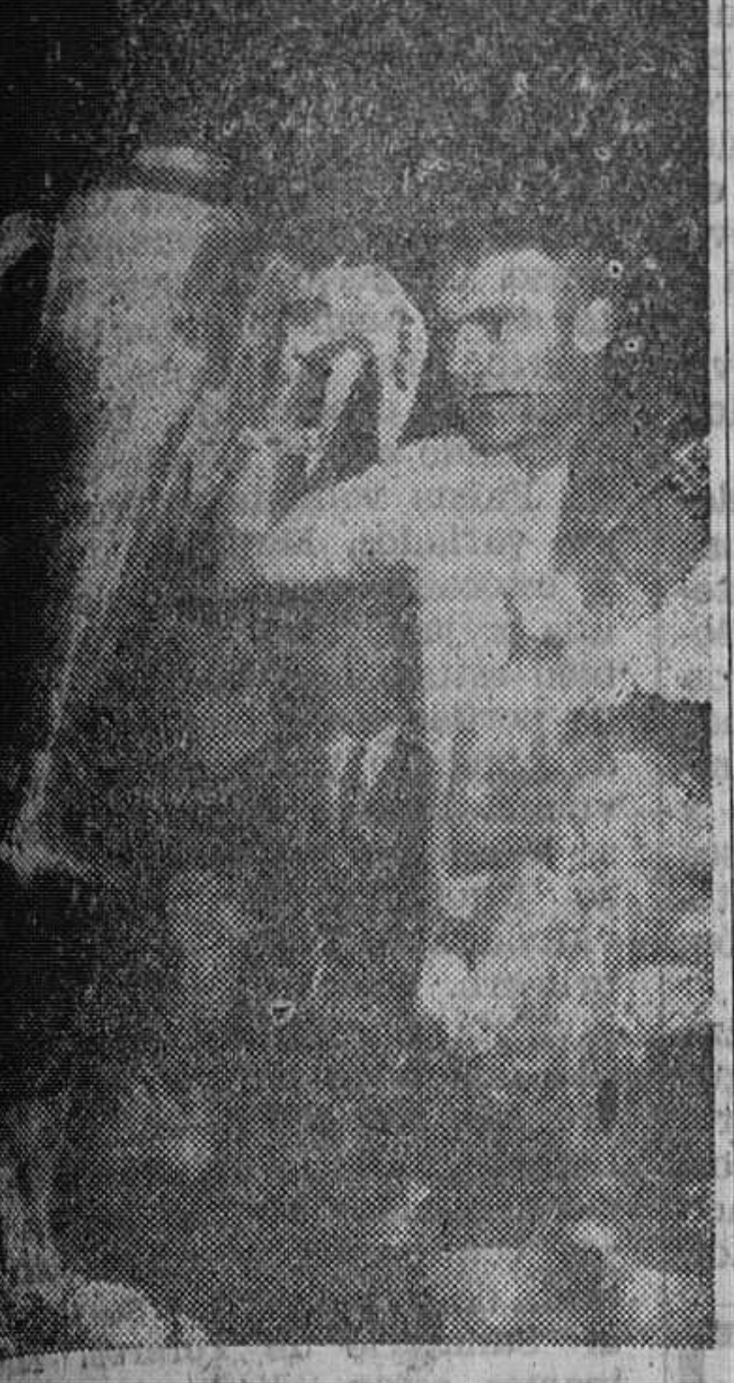
Bilbao. — El corredor ciclista Altig, vencedor absoluto de la actual Vuelta Ciclista a España, exhibe la copa por él ganada, entre las aclamaciones de la multitud.