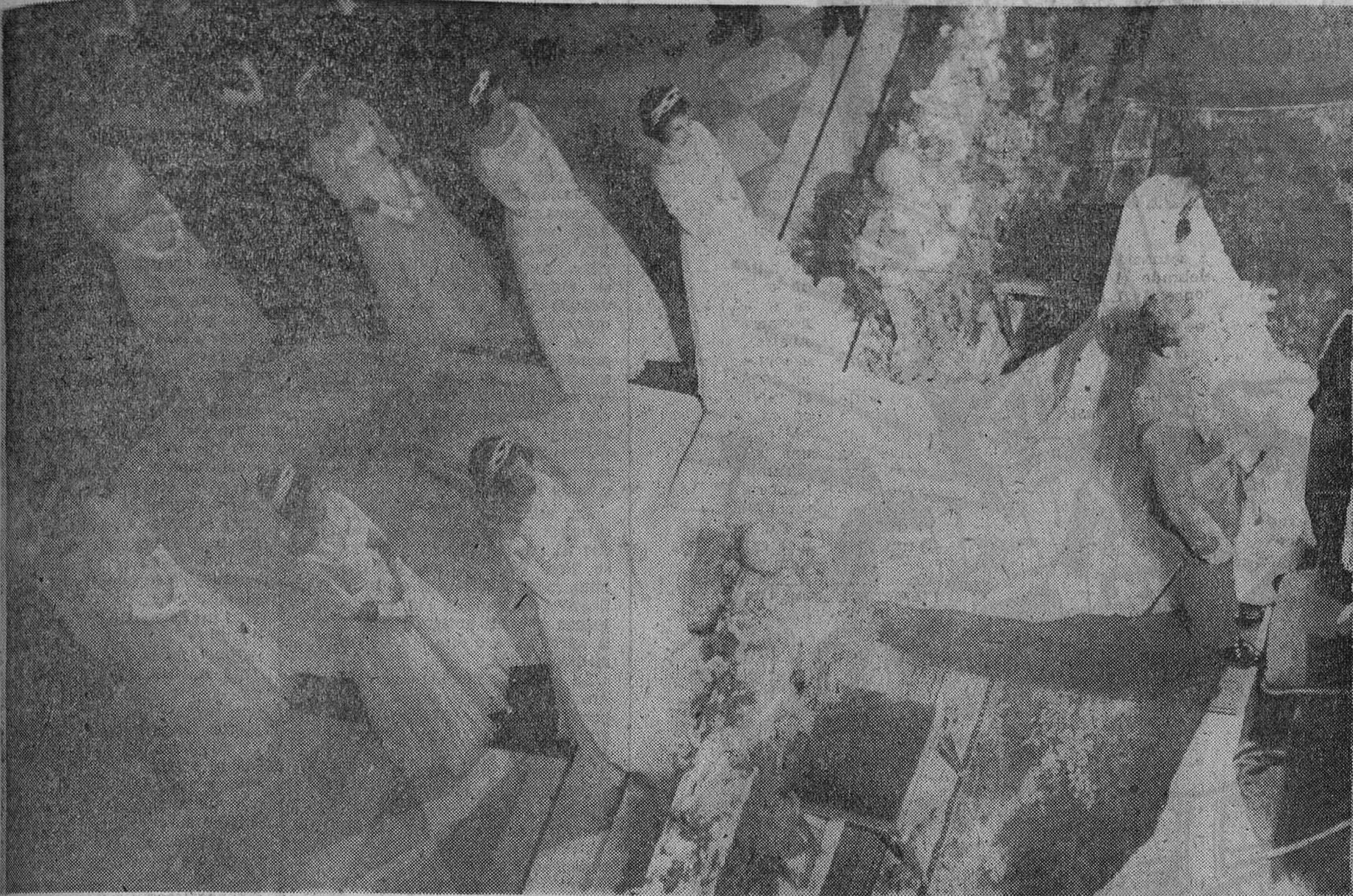
ATENAS. — UN MOMENTO DE LA SOLEMNE CEREMONIA NUPCIAL. — LA FELIZ PAREJA APARECE ANTE EL ALTAR, RODEADA POR LAS OCHO PRINCESAS QUE COMPONIAN LA CORTE DE HONOR DE LA DESPOSADA. — (Telefoto Europa Press)

Una anciana sefardita que quiso ver de cerca "la boda de su amado Príncipe" falleció a causa de la emoción