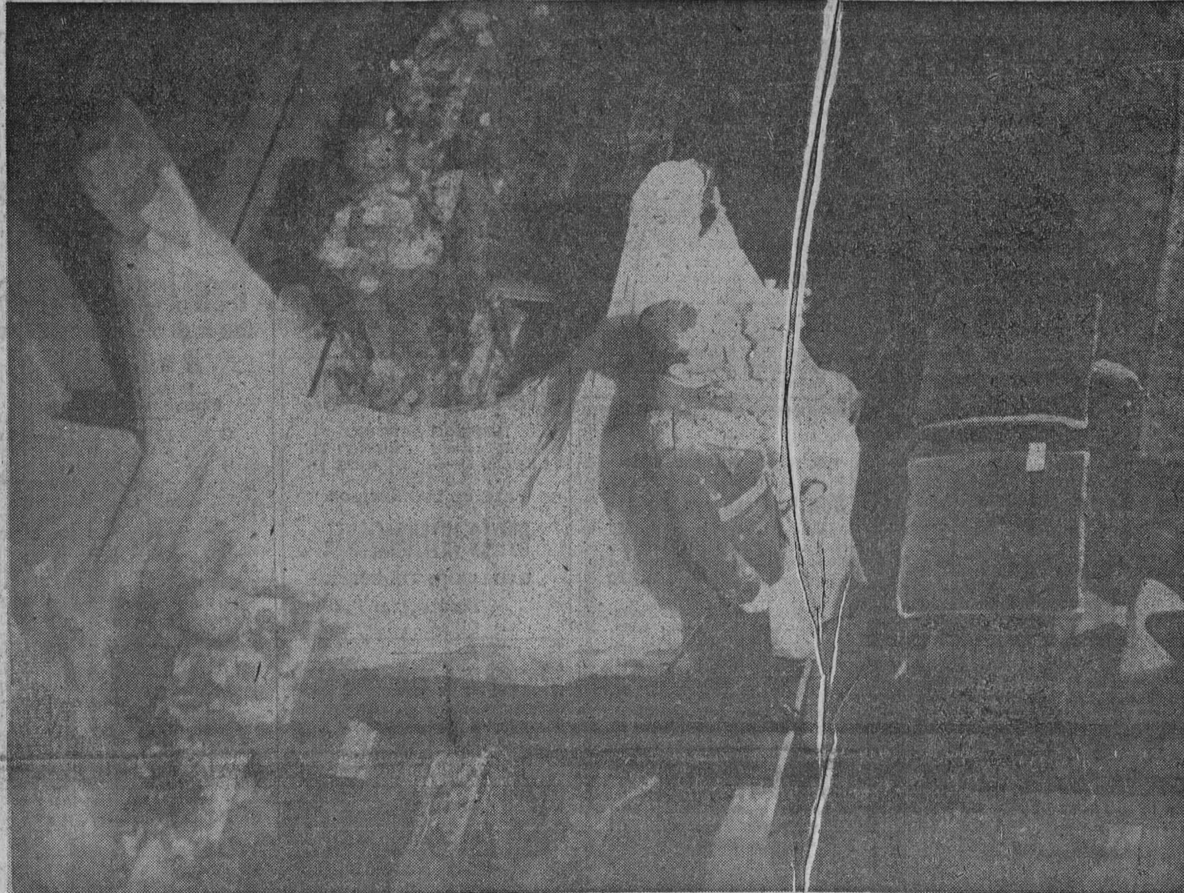
DIARIO DE BURGOS se complace en ofrecer hoy a sus lectores un extraordinario servicio gráfico e informativo, del gran acontecimiento que tuvo ayer por marco la capital de Grecia. Nuestro periódico, sin regatear medios ni desembolsos económicos, contrató con la gran Agencia de Prensa nacional y extranjera "Europa Press", con carácter de exclusiva para Burgos, un servicio gráfico de urgencia, del fausto suceso real de ayer, para lograr el cual "Europa Press" hizo particularmente un avión especial, que trasladó desde Atenas a Madrid los documentos gráficos más señalados del enlace matrimonial entre la Princesa Sofía de Grecia y el Príncipe Juan Carlos de Borbón. Estas fotografías, que ilustran el presente número, estaban en nuestro poder, ayer a primera hora de la noche, batiendo un auténtico récord de transmisión en la historia del periodismo burgalés.

por el cónsul general de su país y los ganaderos señores Osborne y Bohorquez, recorrió durante toda la mañana el Real, donde admiró el desfile de los caballistas, de las parejas y de los coches enjambados. Mister Woodward se detuvo con mayores y pequeños a los que hizo numerosas preguntas sobre el típiamo, el folclore andaluz etc.