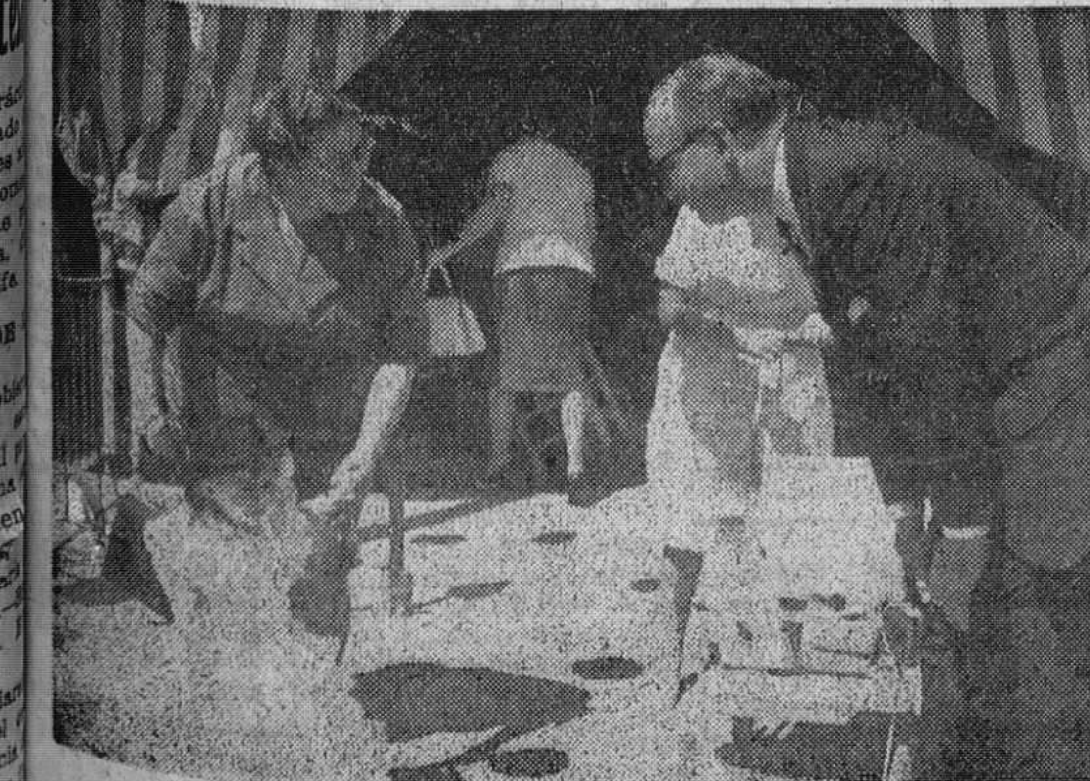
El nuevo embajador norteamericano en la feria de Sevilla

Al subir las escalinatas de la iglesia de San Dionisio, la Princesa (Pasa a quinta página)