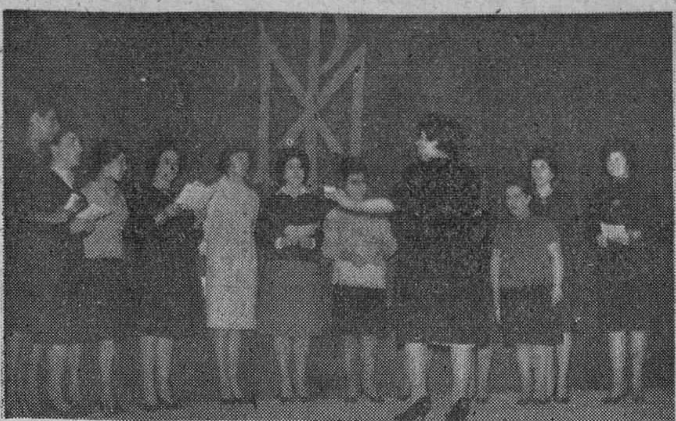
He aquí un momento de la actuación de grupos artísticas durante el acto de afirmación celebrado el domingo, con motivo del "Día mundial de las Congregaciones Marianas".

Celebró la misa de comunión el obispo de Vagada y el Padre Blajot, S. J. pronunció una conferencia