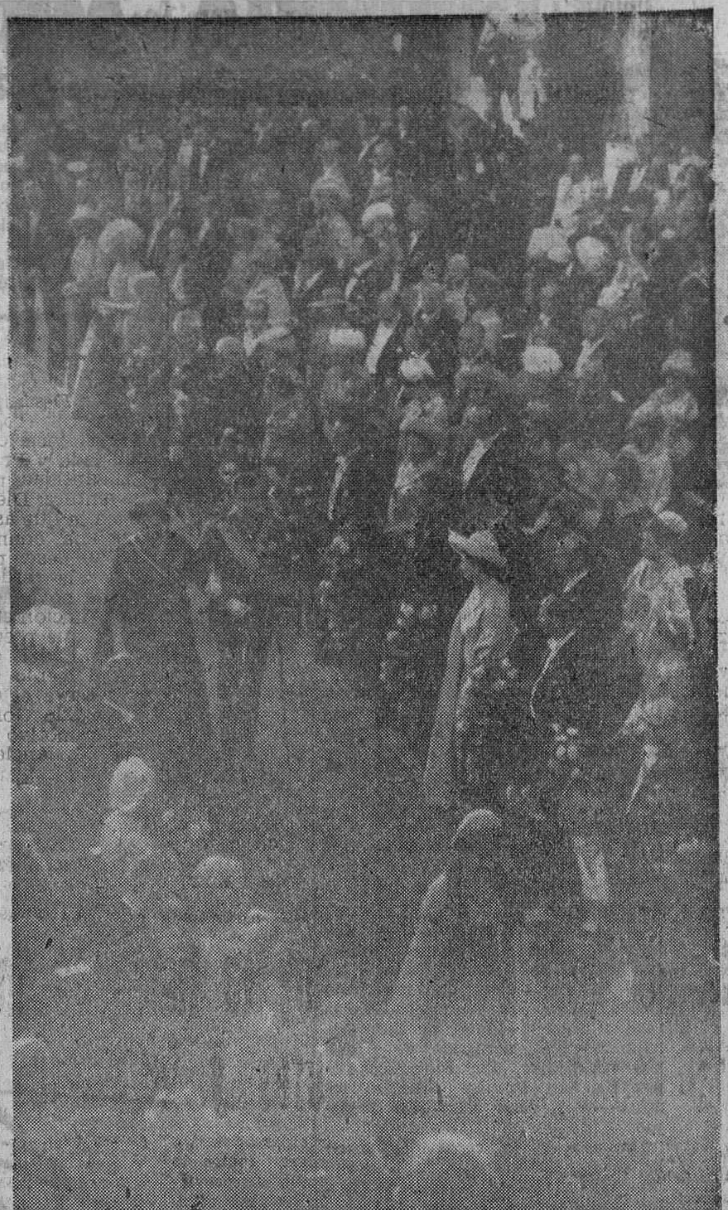
Atenas.—La comitiva nupcial, a su entrada en el templo de San Dionisio. — El novio, Príncipe D. Juan Carlos, avanza hacia el altar, acompañado de su augusta madre. Ante ellos marcha el Conde de Barcelona, dando el brazo a la Reina Federica de Grecia.

Indudablemente, el pueblo griego se siente satisfecho ante esta boda de su Princesa Sofía con un Príncipe español. Grecia admira, desde luego a España, a la que reconoce las virtudes del heroísmo, la nobleza y el ingenio, al mismo tiempo que se da entre españoles y griegos una compenetración rápida. En el momento en que las salvas de artillería anunciaban la conclusión de las ceremonias, los griegos estrechaban sus manos con los españoles, deseando felicidad a los Príncipes, en esta espléndida jornada de amistad hispanogriega, a la sombra de la imponente Acrópolis.