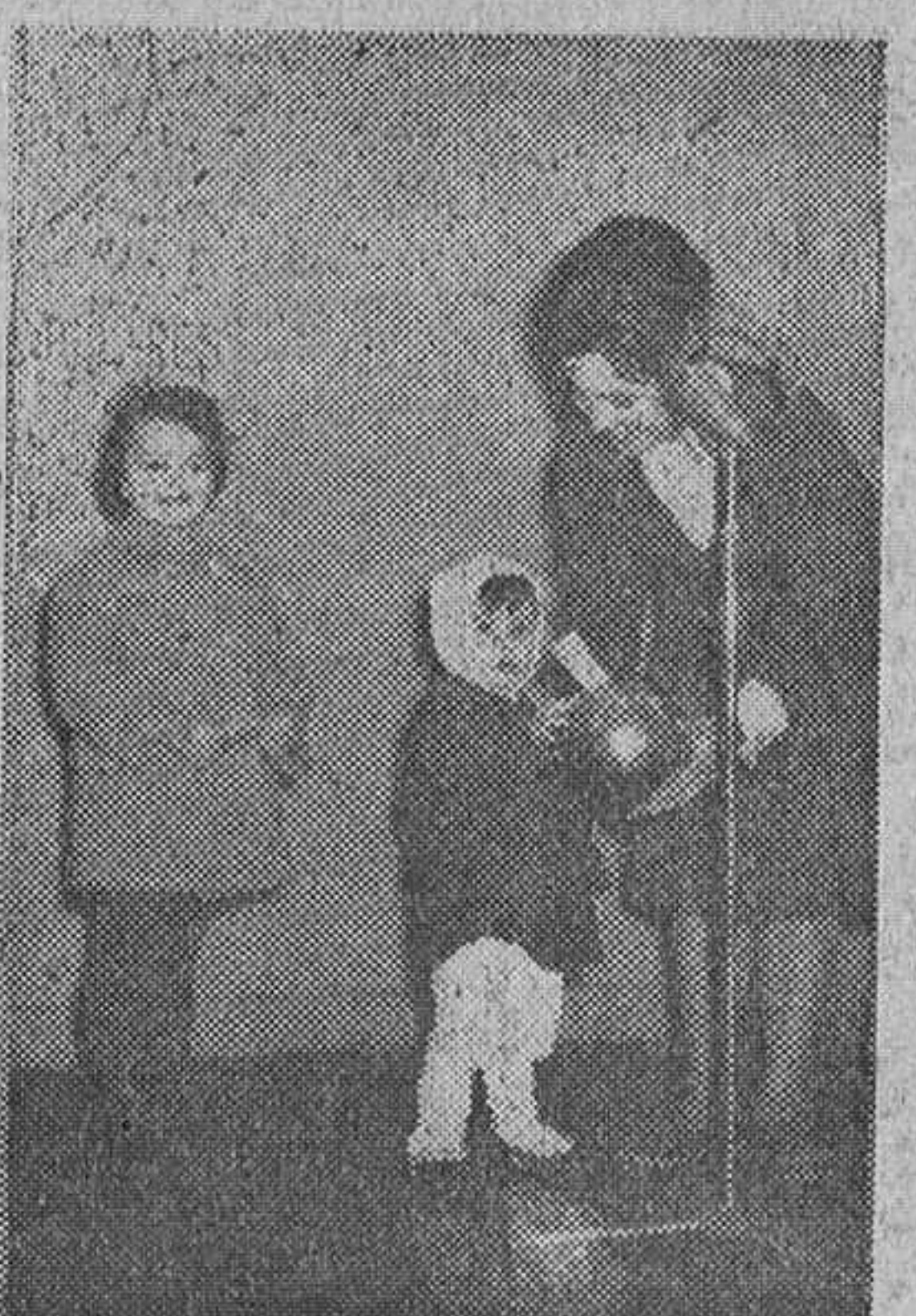
Del admirable ejemplo de caritativa solidaridad que Burgos está dando en favor de los niños inválidos pobres, ha aquí una estampa conmovedora: este pequeño entregando su donativo en los estudios de "Radio Popular".

Madrid. — La comisión organizadora del "Festival de las fibras modernas", reunión a los representantes de la Prensa, Radio y Televisión, para informarles del susodicho festival que, a beneficio de las obras asistenciales del Ayuntamiento de la villa, se celebrará la noche del 27 de Abril en los jardines de don Cecilio Rodríguez del parque del Retiro. El presidente de la comisión organizadora y delegado español del II Congreso Mundial de las Fibras Artificiales y Sintéticas, don José Antonio Plaza de Ayllón, explicó el alcance y significado del "Festival de las fibras modernas", que pretende no solo ser un acto social, el de mayor exponente del auge que en nuestro país alcanza la industria de fibras artificiales y sintéticas, no solo en su vertiente textil, sino que también en la de la industria química. Luego hablaron el alcalde de Madrid y don Rodrigo Vivar Téllez, presidente del Sindicato Nacional Textil.