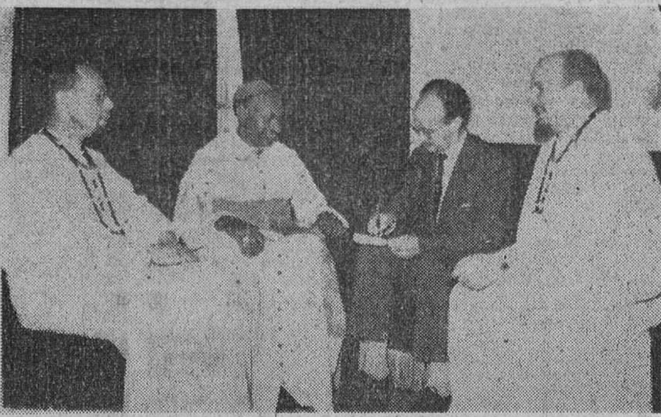
EL OBISPO AFRICANO CONVERSANDO CON NUESTRO REDACTOR «CALLE», EN PRESENCIA DE OTROS DOS PADRES BLANCOS.

Fue bautizado a los diez años y consagrado obispo hace pocos meses. Ochenta misioneros para 800.000 hombres. — Después de los sucesos del Congo, la Iglesia africana aparece más pura a la vista del pueblo. — «El Papa me levantó del suelo, exclamando: ¡Somos hermanos!»