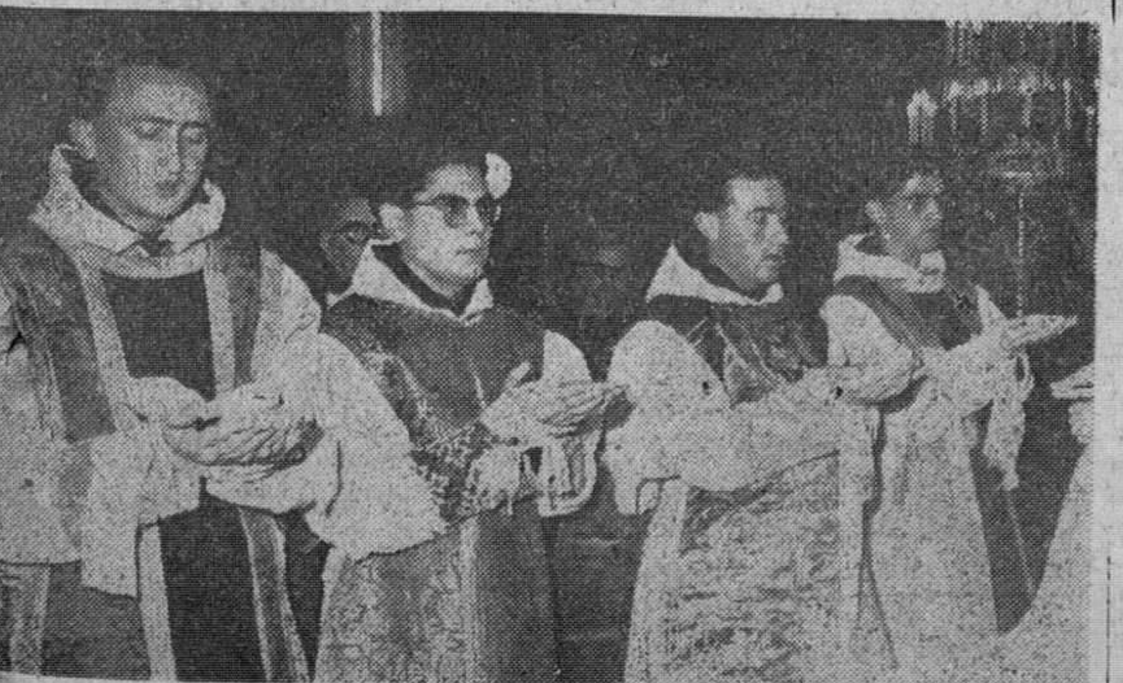
Han subido por vez primera las gradas del altar cuatro Padres Carmelitas que recibieron la ordenación sacerdotal el sábado último, de manos del obispo auxiliar de la diócesis. En nuestra foto, los miscantanos.