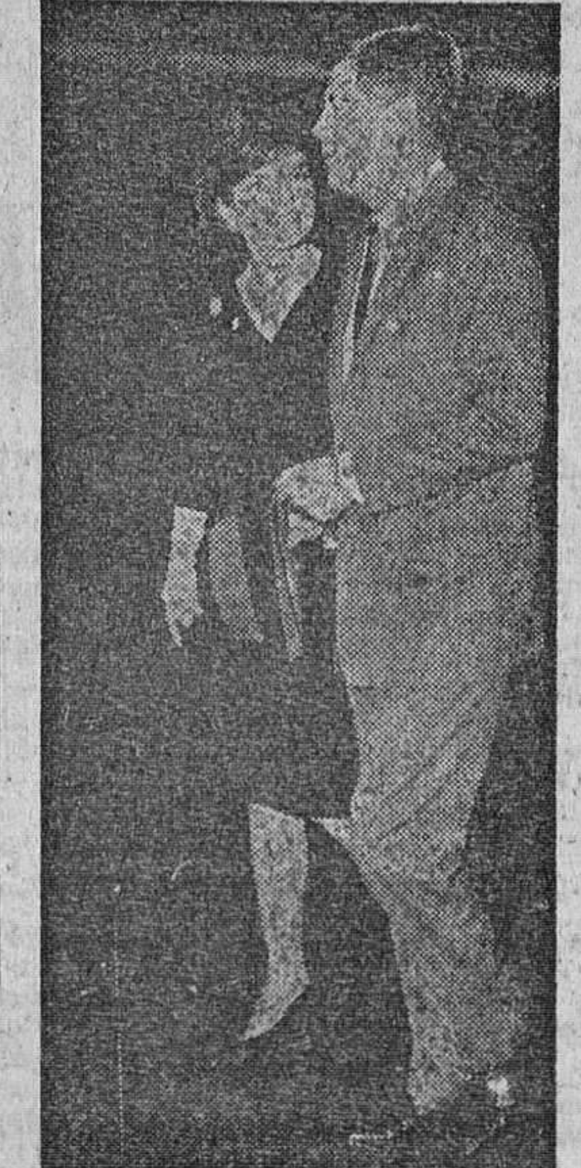
Washington.— Después de su largo viaje por el Oriente y por Europa, la bella esposa del presidente de los Estados Unidos llega a Washington, donde fue recibida por su esposo, el presidente Kennedy.