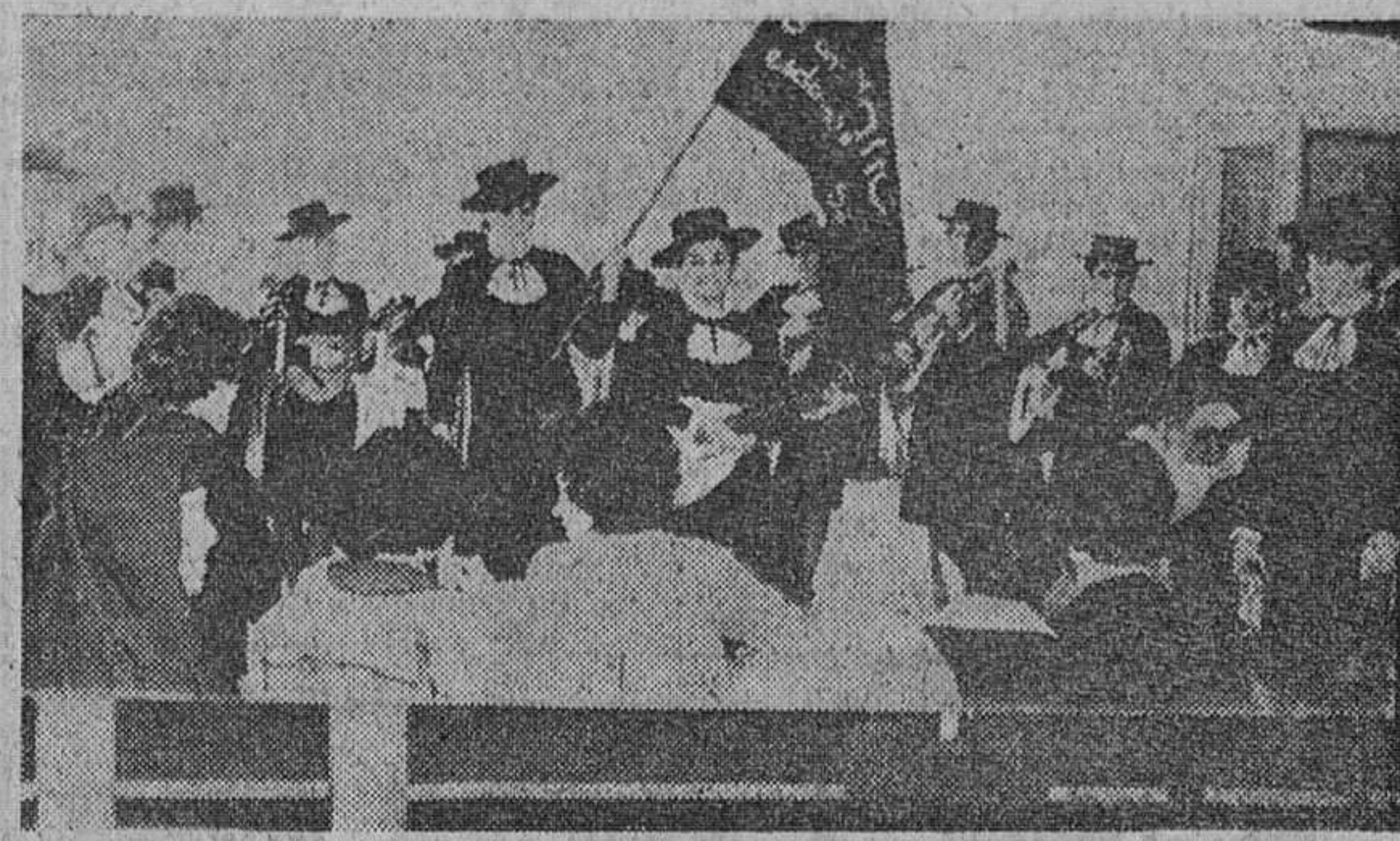
Cádiz.—La «Tuna» femenina del Colegio de las Esclavas, de Bilbao, se encuentra en gira benéfica por Andalucía y con tal motivo, tocadas con sombrero cordobés, ofrecen su arte en los hospitales y centros benéficos de la ciudad.