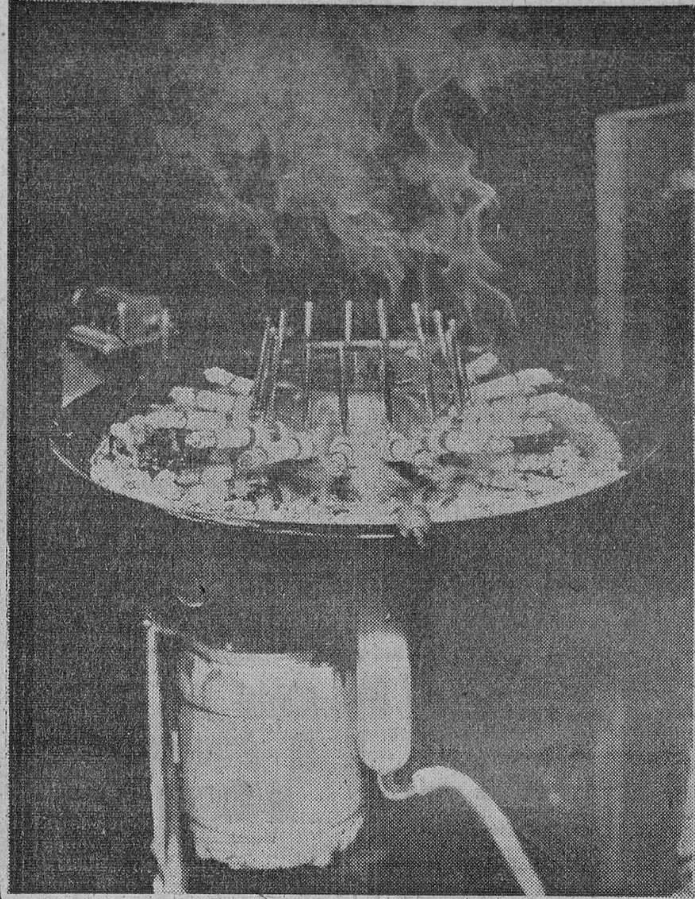
La instalación automática de fumar revela el secreto de cada clase de cigarrillo. Puede descubrirse mediante este aparato la clase de tabaco usada, su contenido en nicotina, la cantidad de tabaco empleada y muchas cosas más. Los estudiantes muestran un interés particular al hacer ensayos con este pulmón artificial.