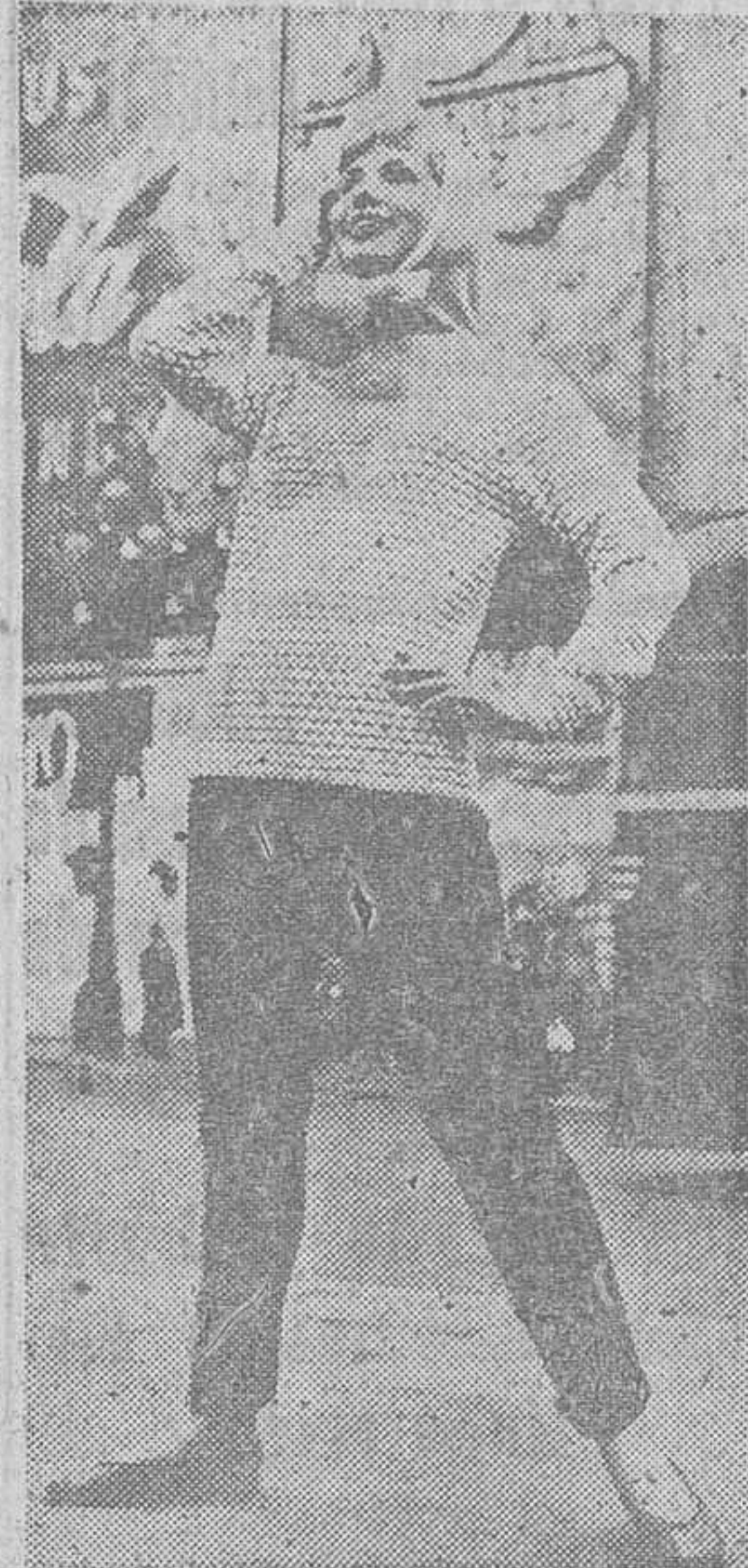
Elegante conjunto para montaña presentado por una casa de modas londinense

Pierre Cardin, digno de ser considerado como lo fue Dior en los tiempos en que atrajo la atención del mundo, presentó entre sus abrigos uno de color verde esmeralda, con el cuello y las