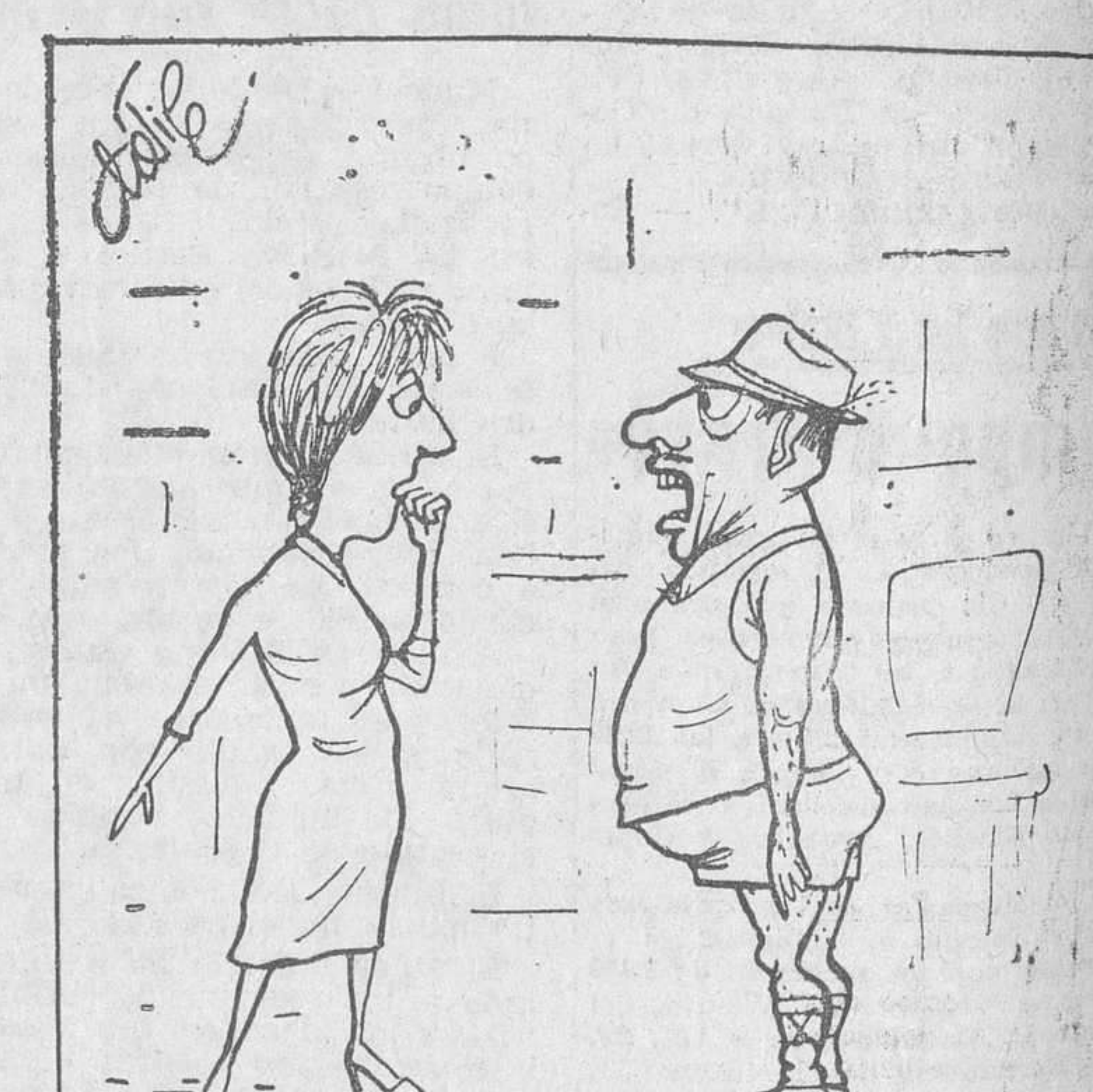
—Te convences ahora de que lo menos fundamental para ir bien vestido es el sombrero?