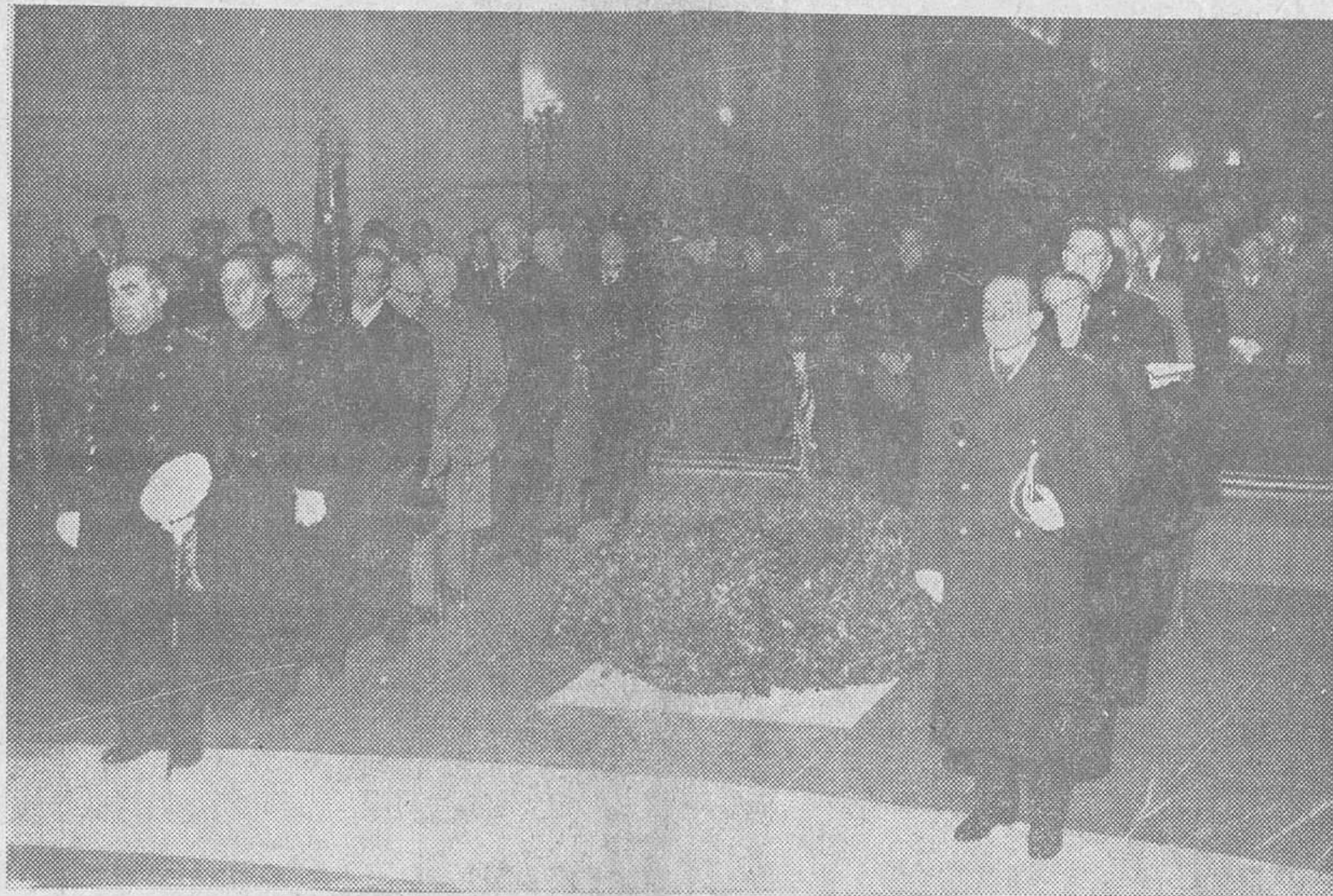
Santa Cruz del Valle de los Caídos.—Miembros del Gobierno dando guardia de honor durante la celebración del solemne funeral por José Antonio, en el XXV aniversario de su muerte. Presidió Su Excelencia el Jefe del Estado.