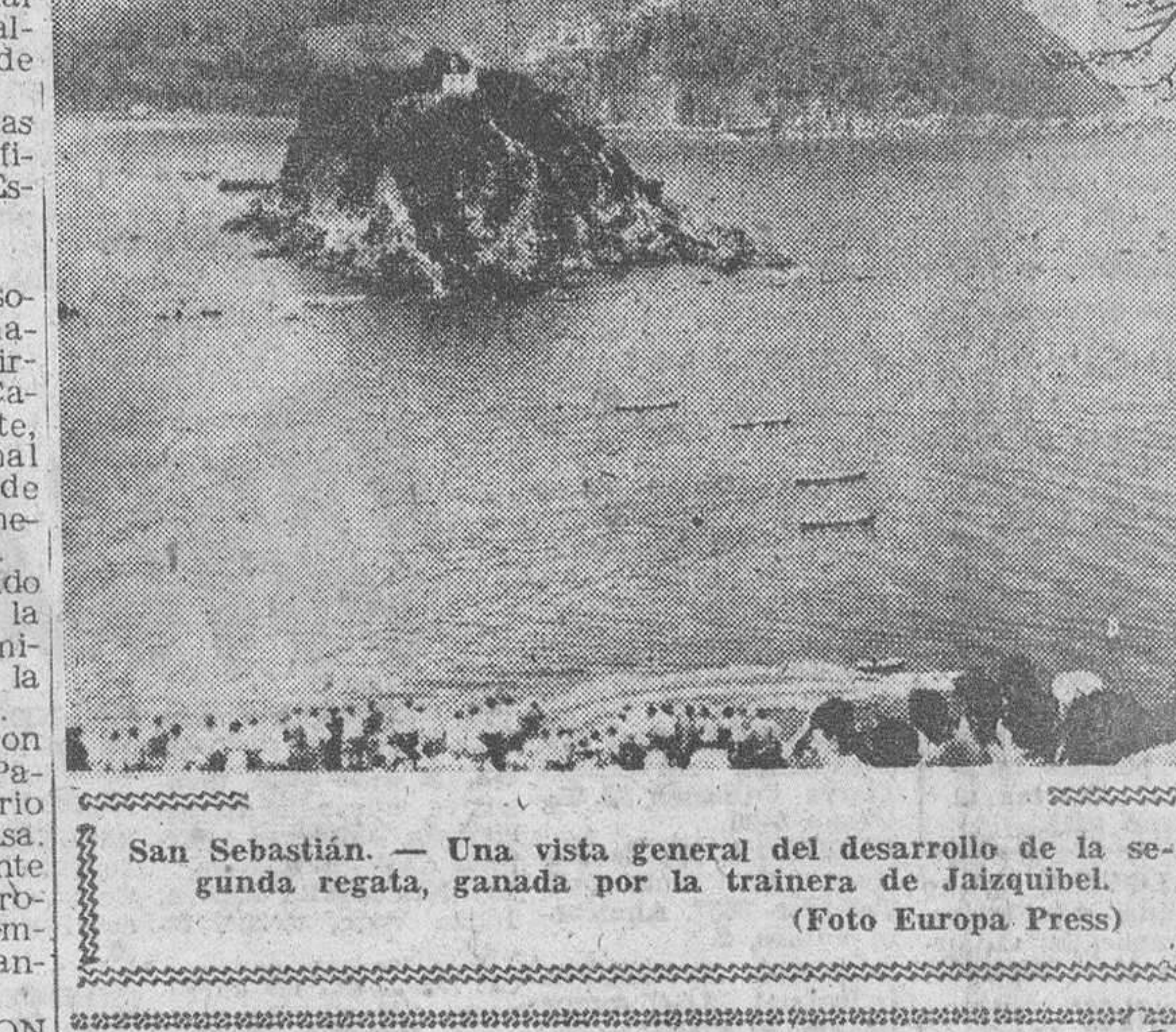
San Sebastián. — Una vista general del desarrollo de la segunda regata, ganada por la trainera de Jaizquibel.