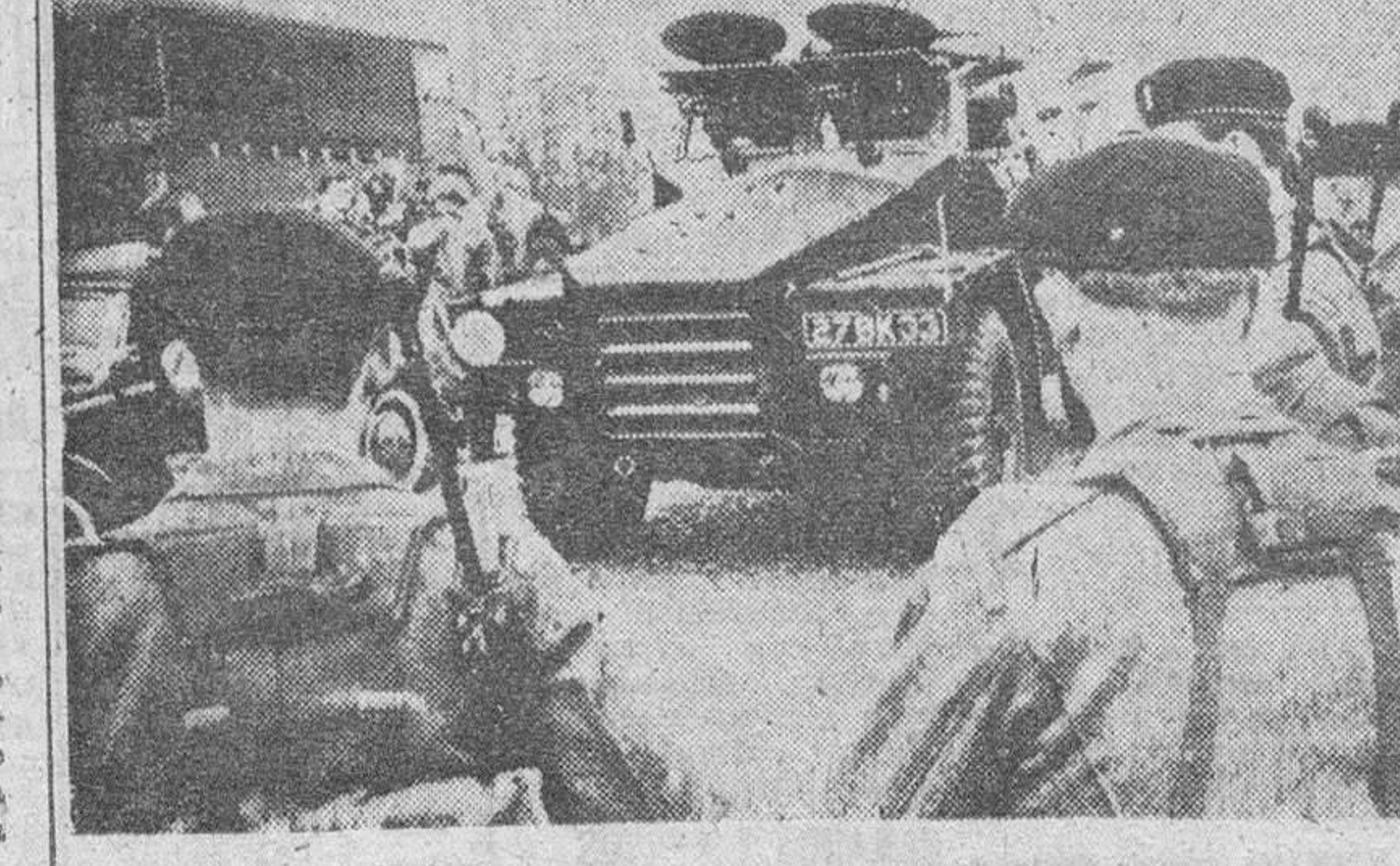
Llegada de vehículos acorazados británicos Berlín. — Soldados británicos observan la llegada al Berlín Oeste de los vehículos blindados y su dotación procedentes de los acuartelamientos británicos en Alemania occidental.