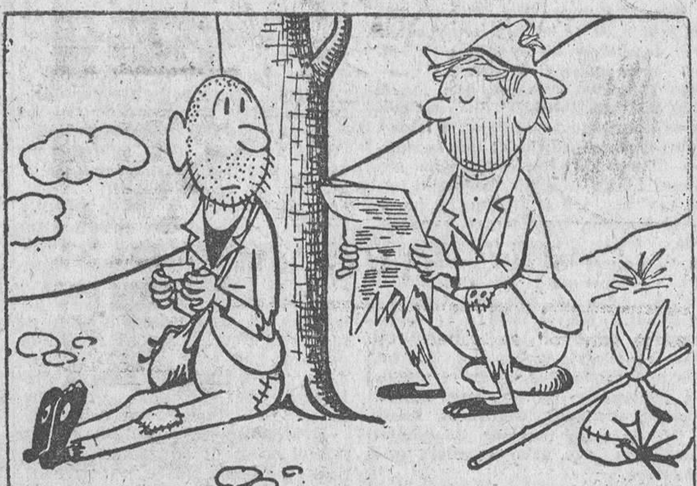
—Berlín, pruebas atómicas, Brasil, terrorismo... La verdad es que noticias como la de que también cobrarán los doce acierios de las quinielas levantan el ánimo.