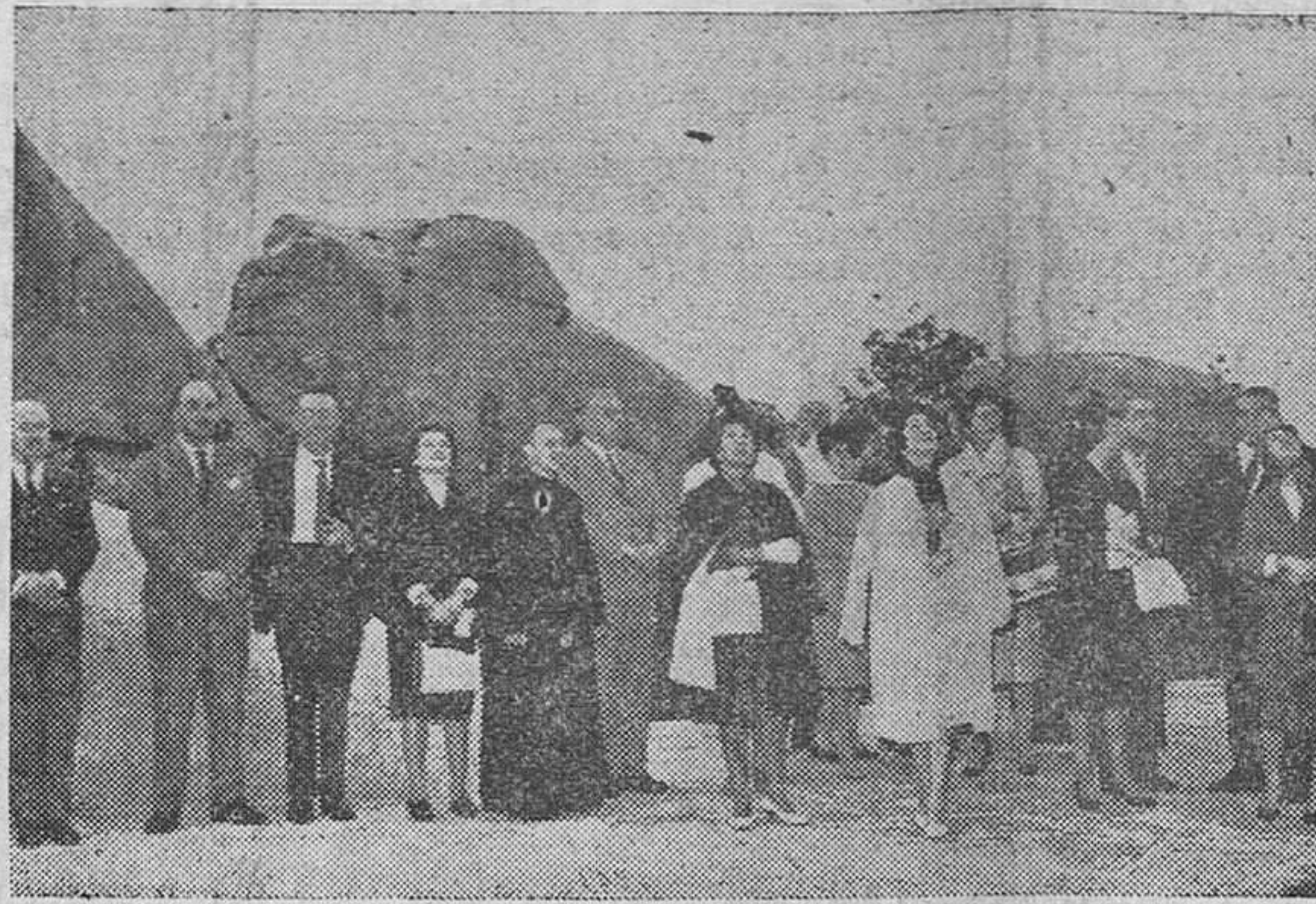
Cuelgamuros.—La delegación oficial argentina que se encuentra en Madrid para asistir a los actos de inauguración del monumento al general San Martín, durante su visita al Valle de los Caídos.

Culminaron así, en la capital de España, los actos conmemorativos del aniversario de la Revolución de Mayo