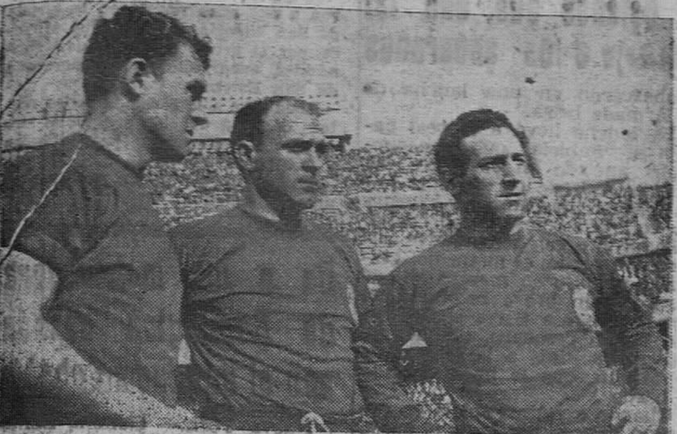
Madrid.—He aquí las tres figuras más destacadas del equipo español antes de jugar el encuentro. Kubala facilitó el pase del primer gol, Di Stefano y Gento, que marcó el segundo.