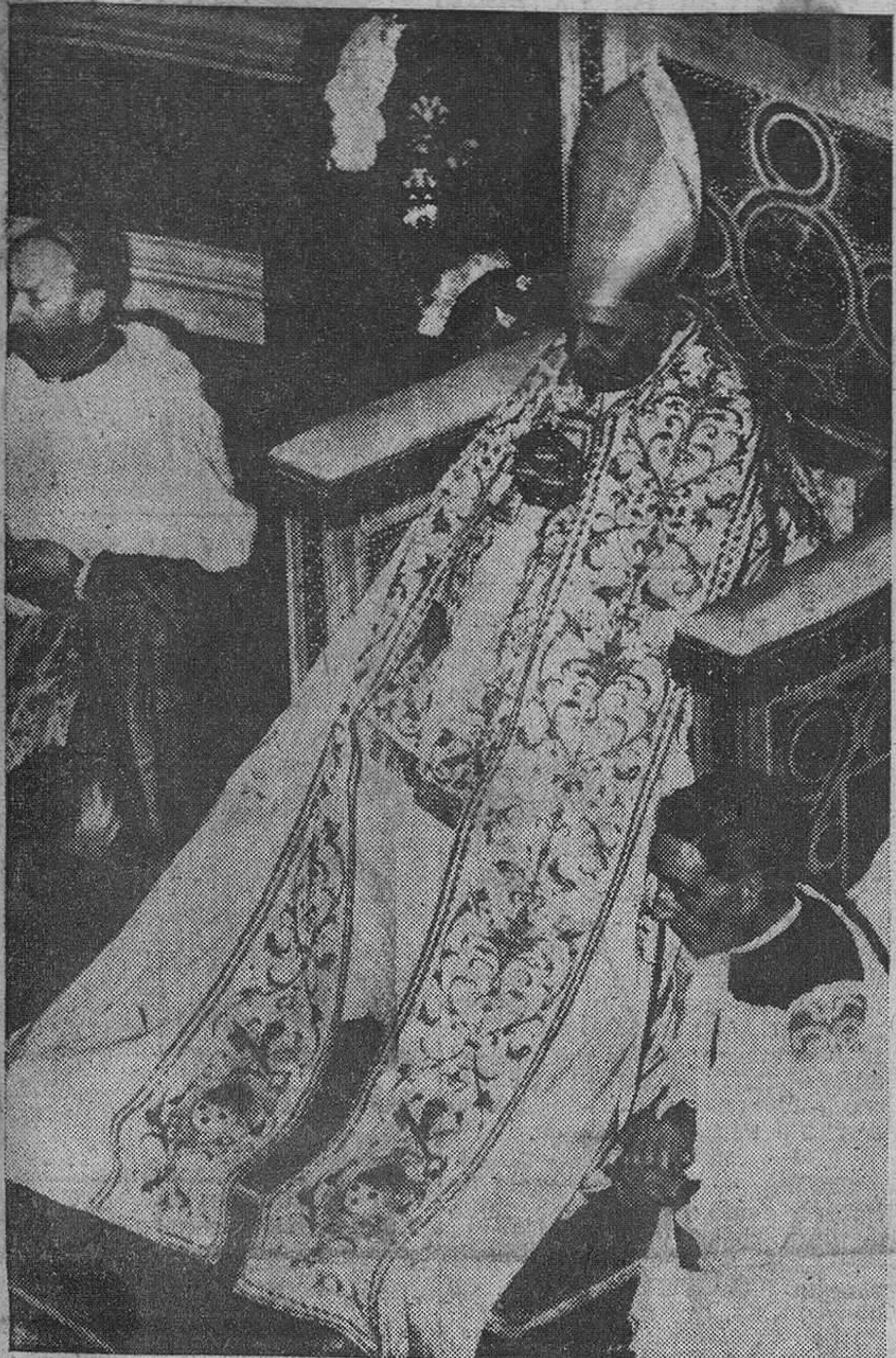
Roma. — S. S. Juan XXIII fotografiado en la Basílica de San Juan de Letrán, durante la ceremonia del lavatorio del pasado Jueves Santo, y durante el cual el Santo Padre, en acto de humildad, lavó los pies a trece seminaristas de distintas nacionalidades.

«Todos los intentos de cerrar la boca a la Iglesia son completamente vanos», dice el Cardenal Wysinski