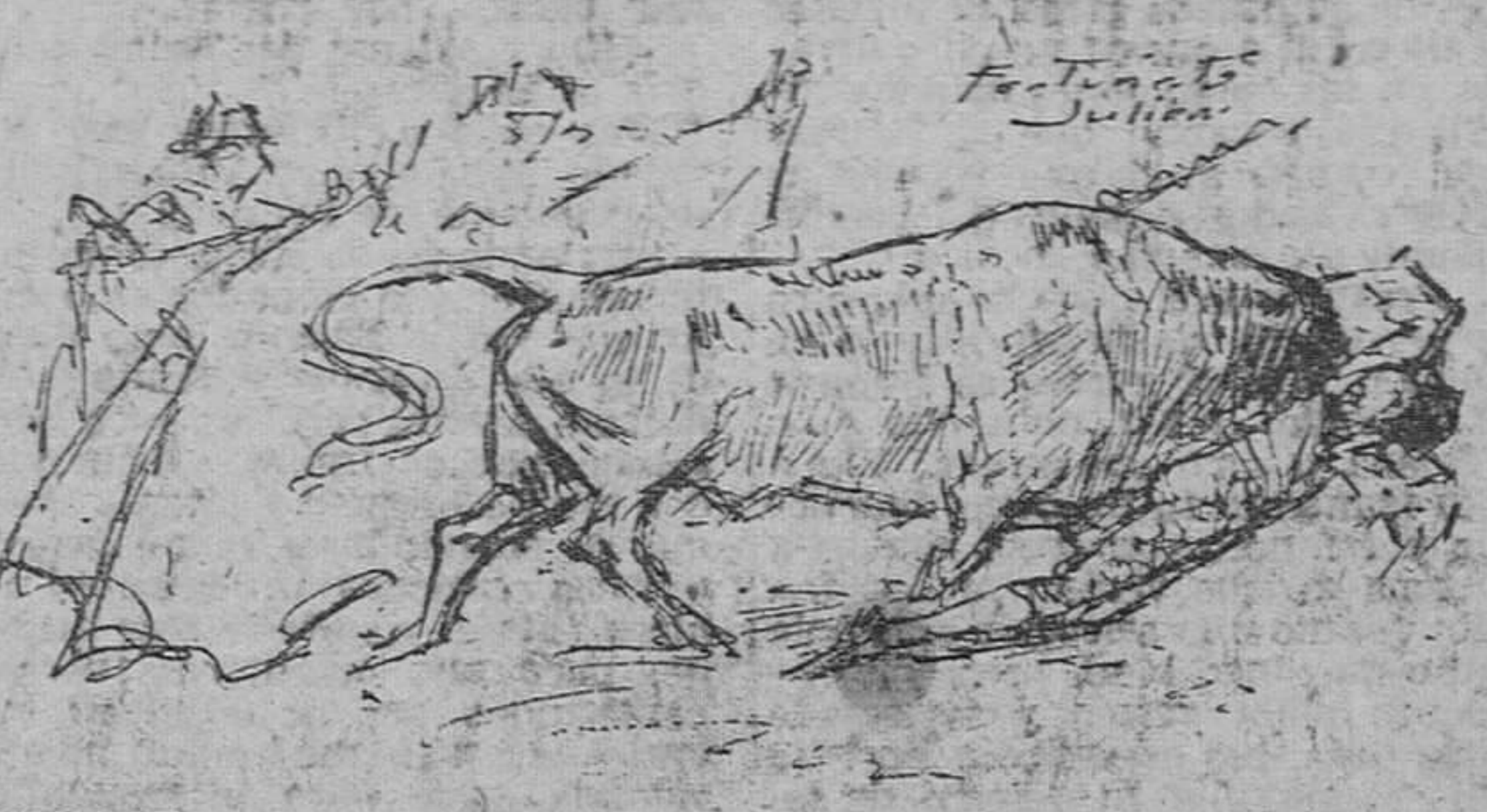
La espectacular cogida de "Curro" Lago en el sexto de la tarde. — (Apunte del natural, de Fortunato Julián).

En verdad que el festejo novillero del domingo resultó aburrido y soportable. El público — que llenó las localidades baratas — se mostró benevolente con los diestros actuantes, y la lidia de los seis astados duró por encima de cuarenta minutos, a pesar de que los tres matadores percaron graves y los tres mochos espaldas volvieron al hotel por su propio pie.