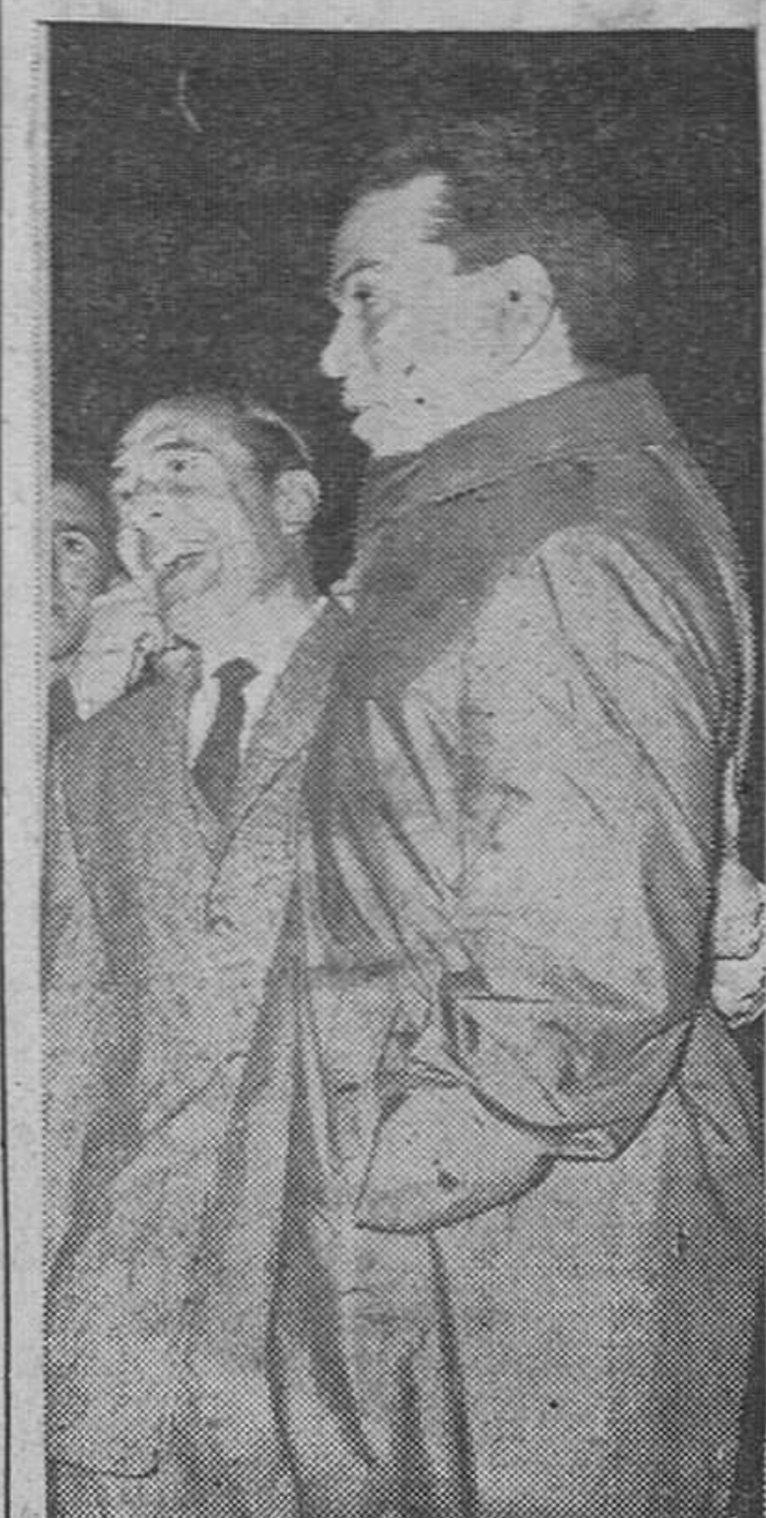
Madrid. — Para presentar su última película ha llegado a Madrid procedente de París, el famoso actor mejicano "Cantinflas", que fue recibido en el aeropuerto de Barajas por numerosos periodistas y admiradores. En el hotel donde se hospedó concedió una entrevista a los informadores.

El candidato de la oposición es Nguyen Dinh Quat, un multimillonario propietario de una plantación de caucho, ha dicho que, si es elegido, llevará al país a una completa democracia, pondrá en libertad a todos los detenidos políticos y acabará con la guerra de guerrillas que comenzó hace año y medio. Quat añade que, una vez que restaurase la paz en el país, piensa llegar a la celebración de las previstas y aplazadas elecciones reconstituidoras, que habrían de celebrarse simultáneamente también en el Vietnam del Norte, comunista.—Efe.