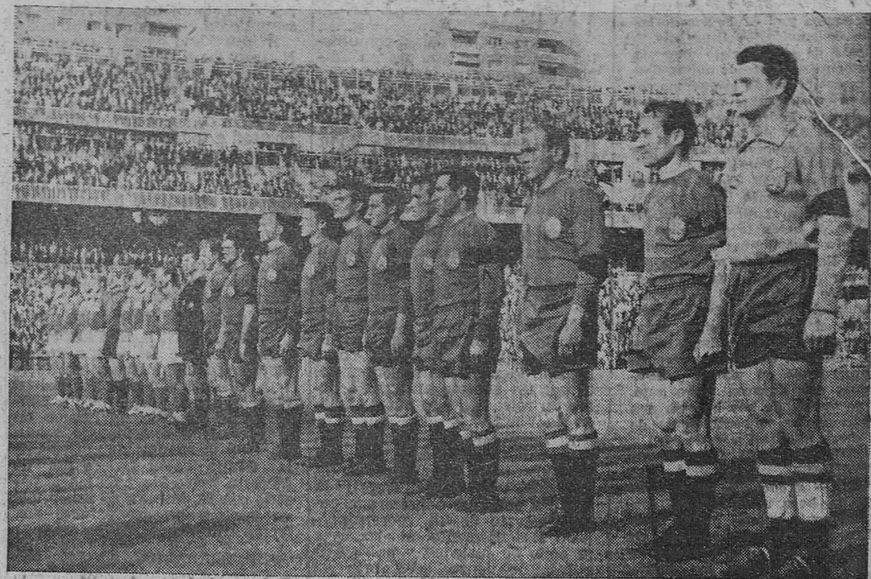
Madrid.—Los equipos alineados mientras se interpretan los himnos.

Continúan los acosos de la vanguardia española y Gento, Del Sol y Kubala ensayan repetidamente el disparo, pero no tienen suerte, en especial en un tiro de Kubala, que pasó por delante de la meta de Bernard, cuando éste se hallaba batido, sin encontrar