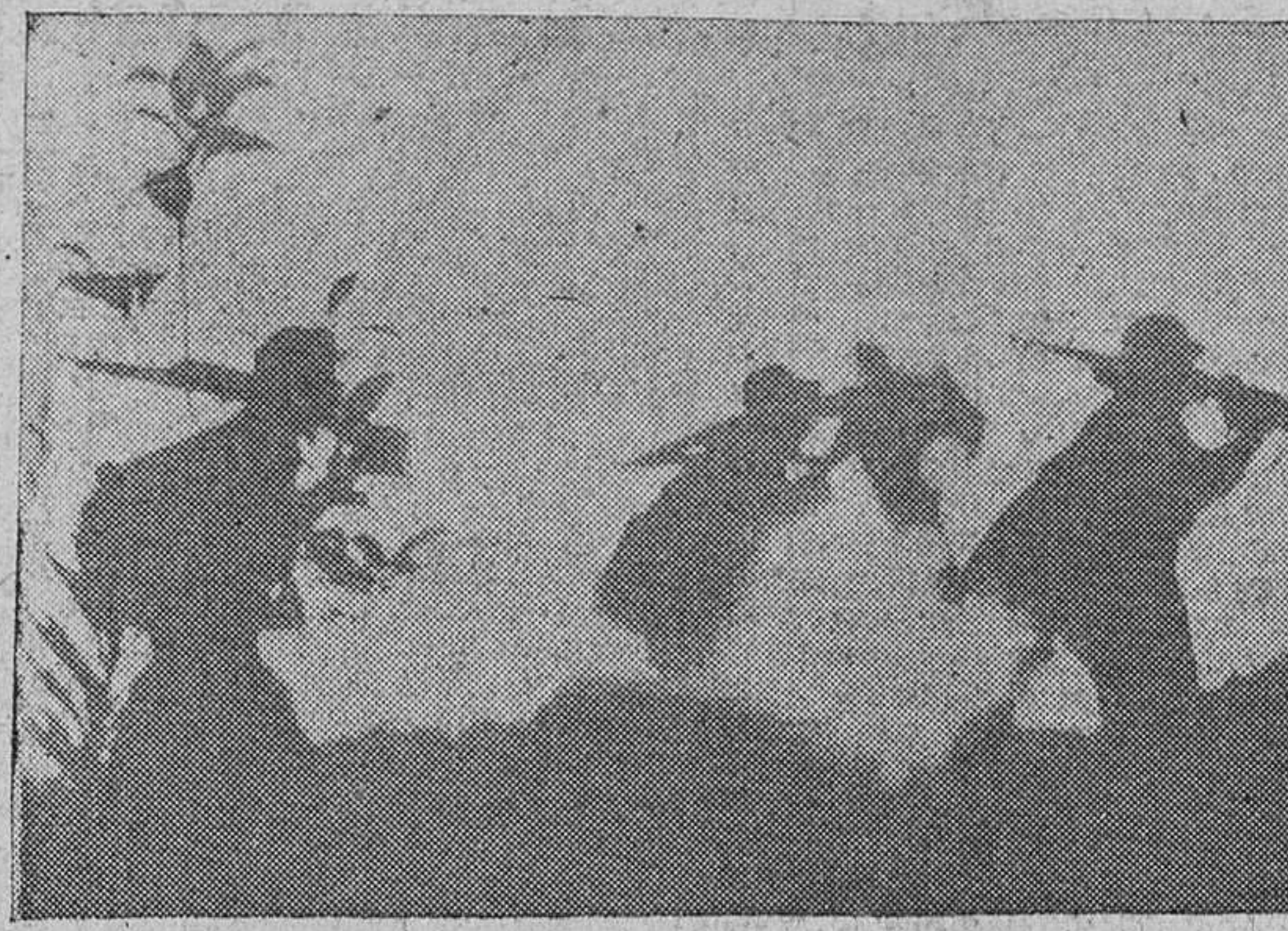
La resistencia contra el régimen fidelista se ha echado al monte. Como hasta el 1.º de Enero de 1959, las sierras del interior ven regresar al alba a los guerrilleros.

Casi desde mi llegada a la capital tuve contactos con los elementos antirrevolucionarios. En otros capítulos de esta serie quizá hable de ellos, porque hoy, para ofrecer una panorámica general de la situación, quiero limitarme a la entrevista que sostuve con "Francisco", el jefe del