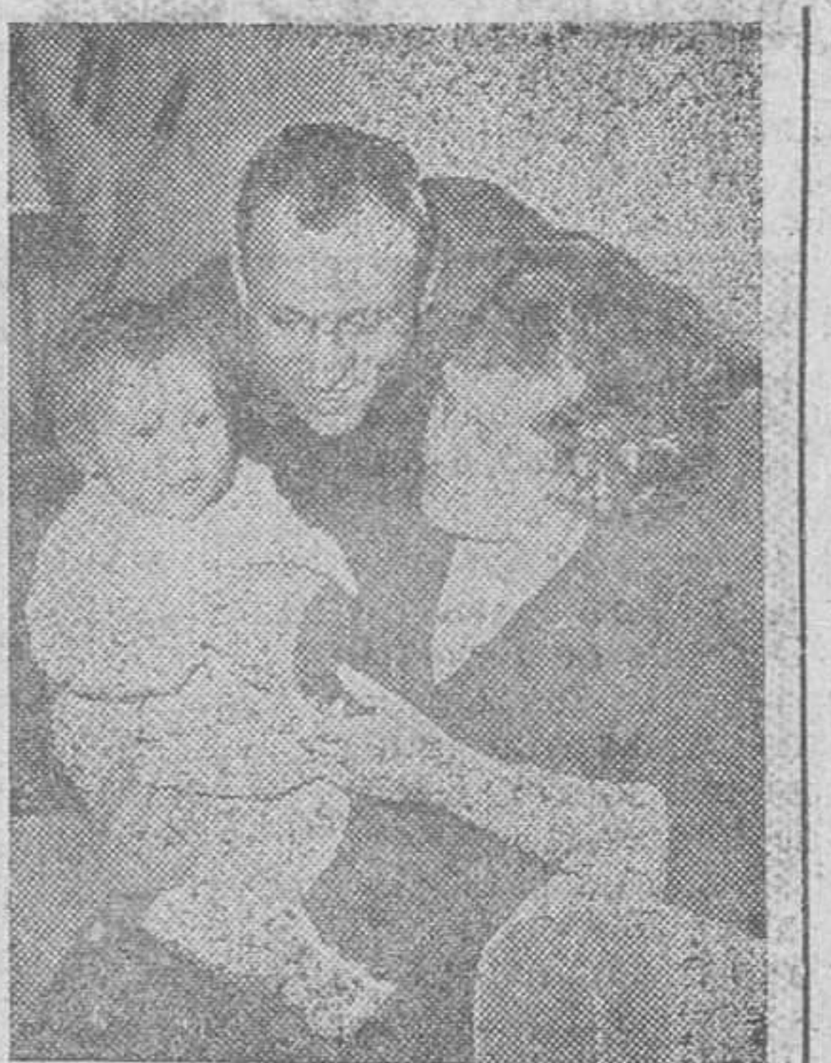
Uwe Seeler, su hijo y una pelota

Como delantero centro, el idolo de la juventud futbolista alemana. — Entrenamiento en los zapatos de su hermano