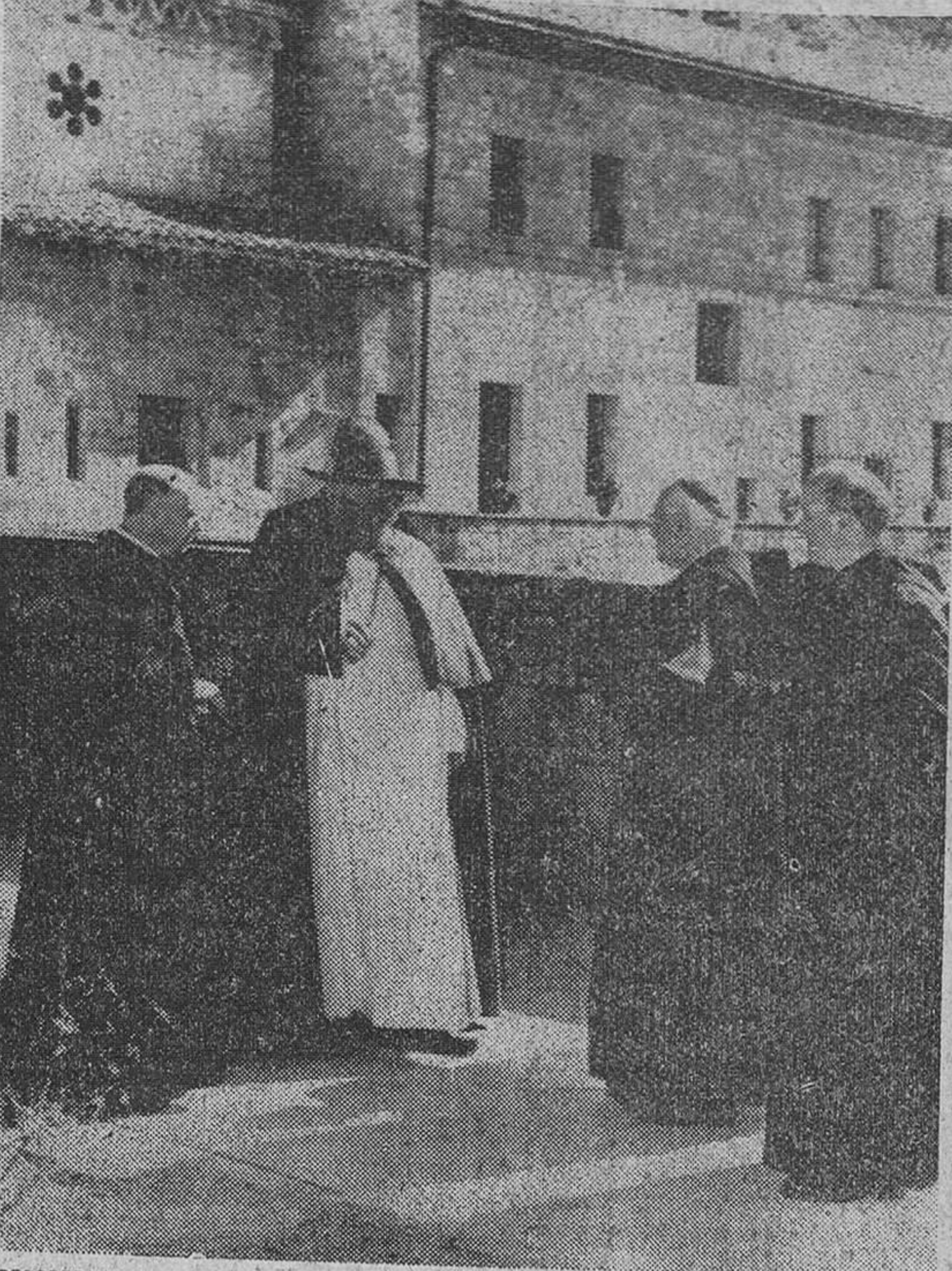
Subiaco (Italia). — S. S. Juan XXIII conversa con los Padres benedictinos durante su visita al Monasterio más antiguo del Mundo, situado a 40 millas de Roma. La Abadía fue fundada en el año 529 por San Benedito.