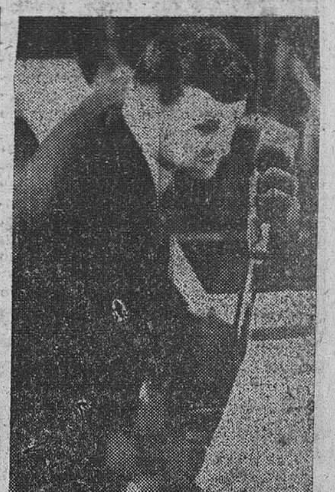
El piloto Francis Powers prestando declaración en la sesión de la mañana del jueves, 18 de Agosto, contesta a las preguntas del fiscal sobre los vuelos del U-2 sobre la Unión Soviética.