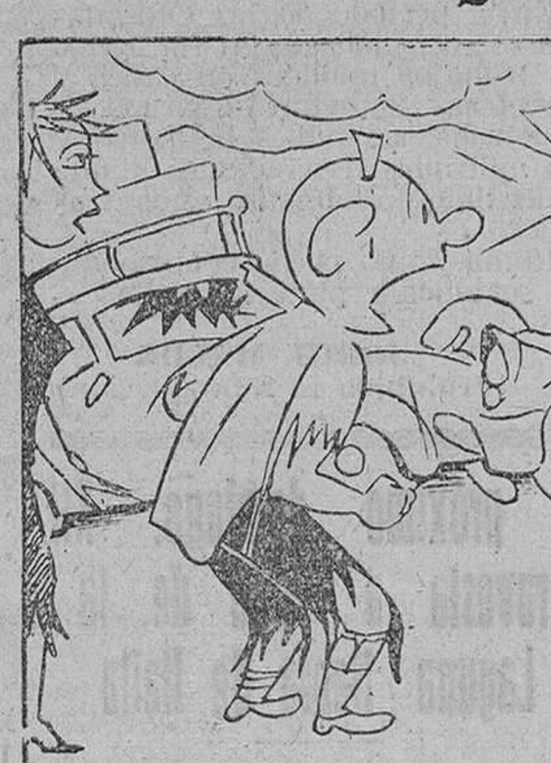
—¡Sí, pero ustedes regresan del verano y nosotros salíamos!