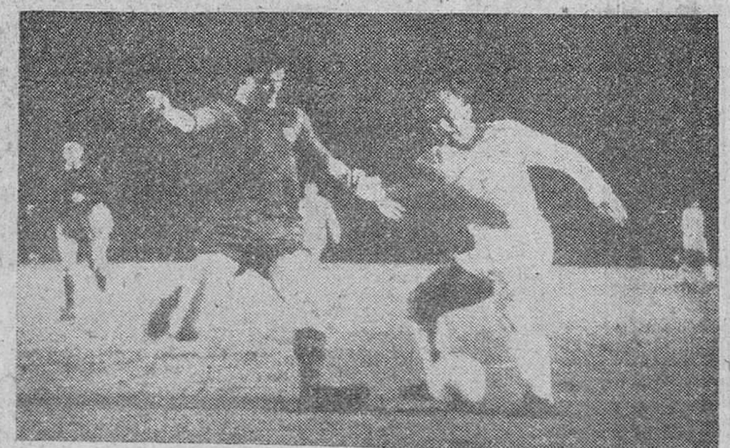
El Madrid finalista de la Copa de Europa