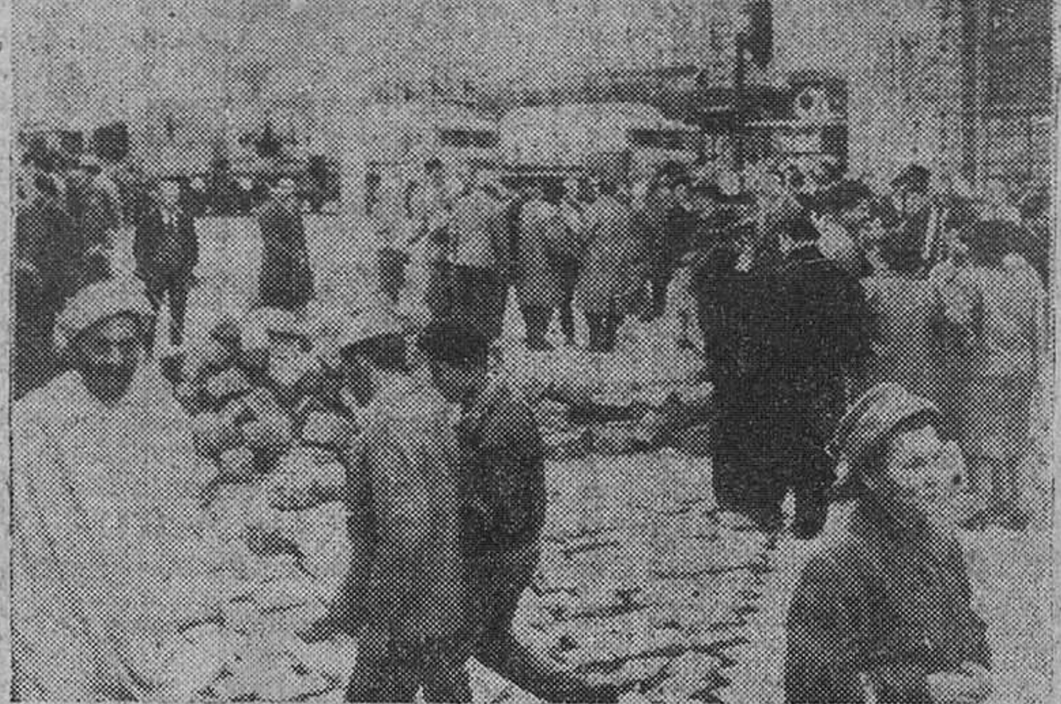
Argelia. — Grupos de personas conversan sobre los acontecimientos que se registraron en Argel y otros puntos de Argelia. En la foto puede observarse el pavimento levantado para las barricadas. Al fondo, camiones para el transporte de las tropas que mantienen el orden.

Argel. — Radio Argel anunció a primera hora de la tarde que "los elementos insurrectos de las armas han sido desarmados". (Pasa a cuarta pag.)