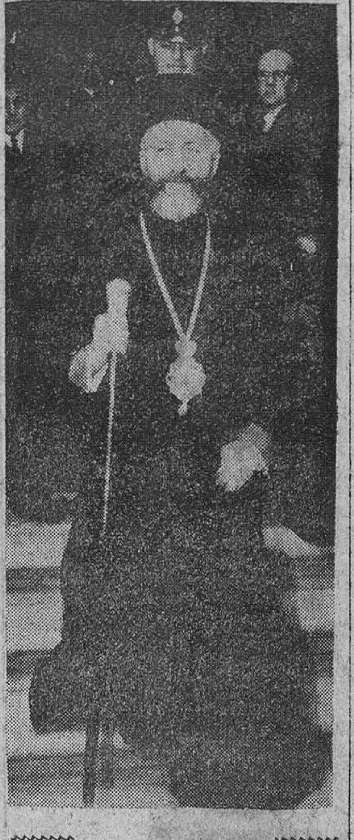
Londres. — El Arzobispo Makarios, presidente electo de Chipre, saliendo del Foreign Office, después de una de las sesiones de la Conferencia sobre Chipre, para asistir a un almuerzo privado.