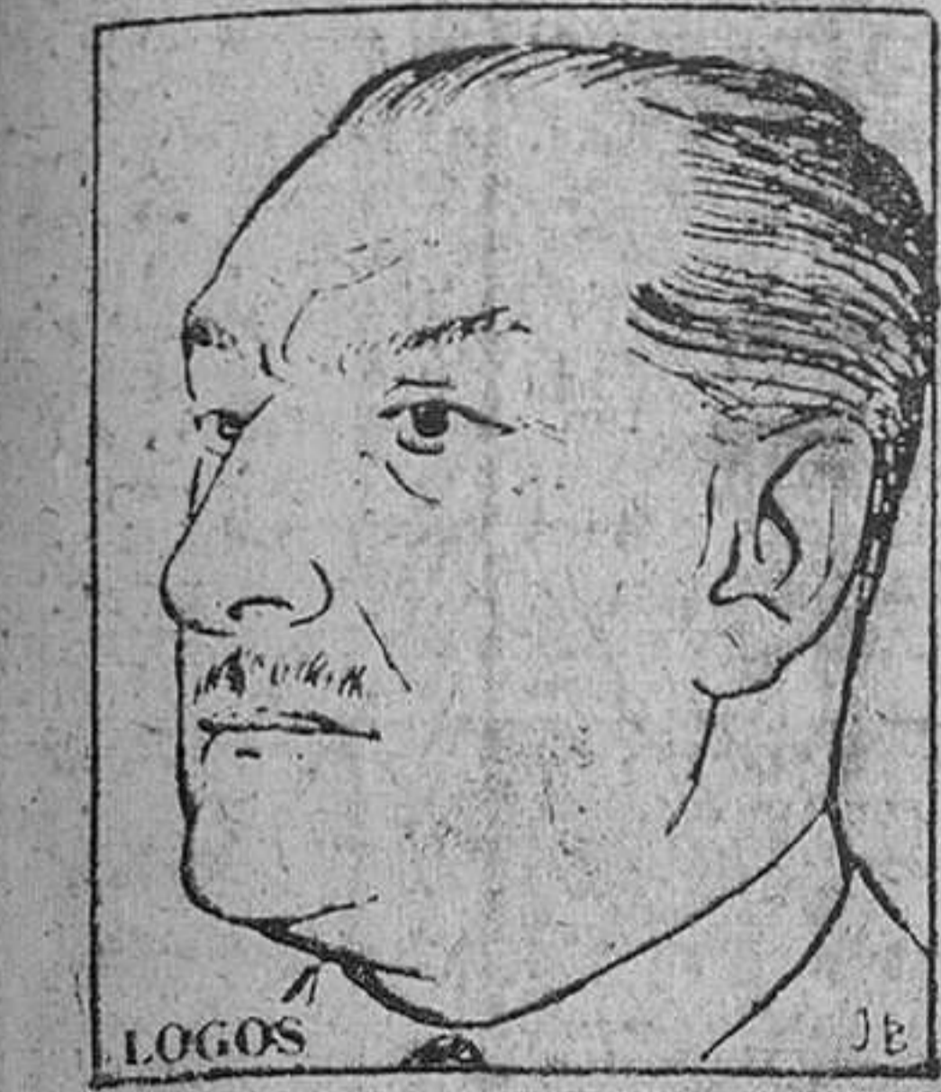
EL MARQUÉS DE VELLISCA EMBAJADOR DE ESPAÑA EN CUBA

En un tumultuoso episodio ante la T. V., le prohibió que rechazase las acusaciones de que la Embajada española y la de EE. UU. ayudaba a los contrarrevolucionarios