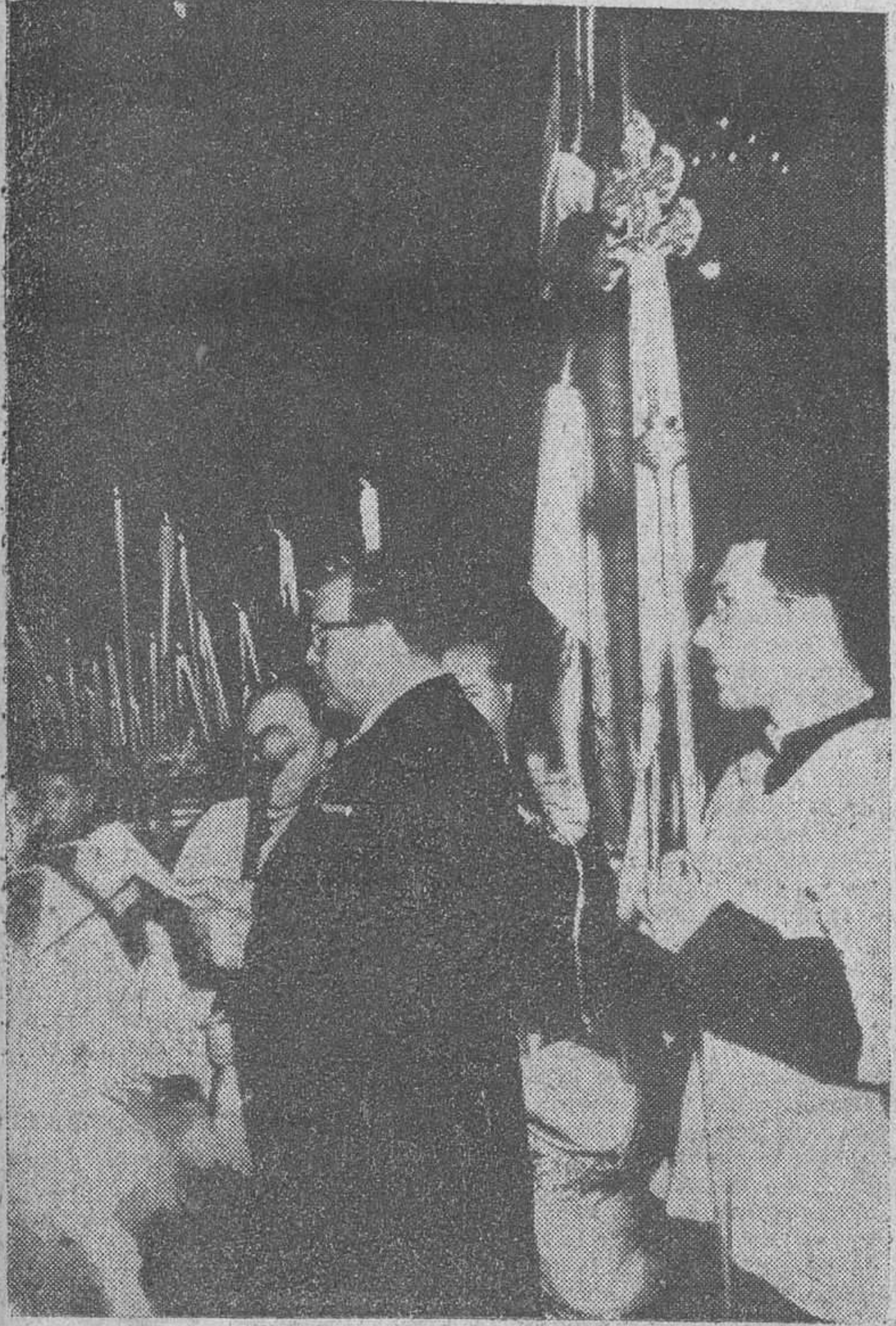
Oirenda de una bandera cubana a la Virgen del Pilar

Expresa también su confianza en que 1960 será para España un año de precios estables, equilibrio externo, más producción y consumos