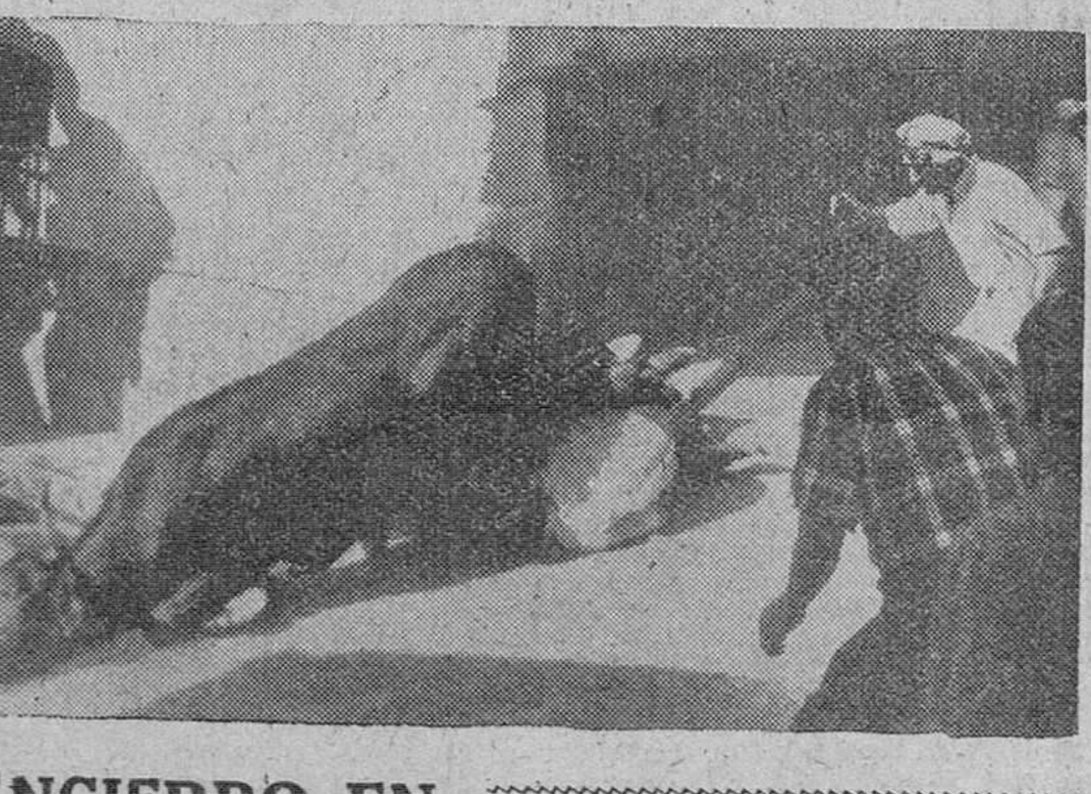
ENCIERRO EN CUELLAR... Cuellar.— Uno de los muchos incidentes del popular encierro taurino que tradicionalmente se celebra en esta población...