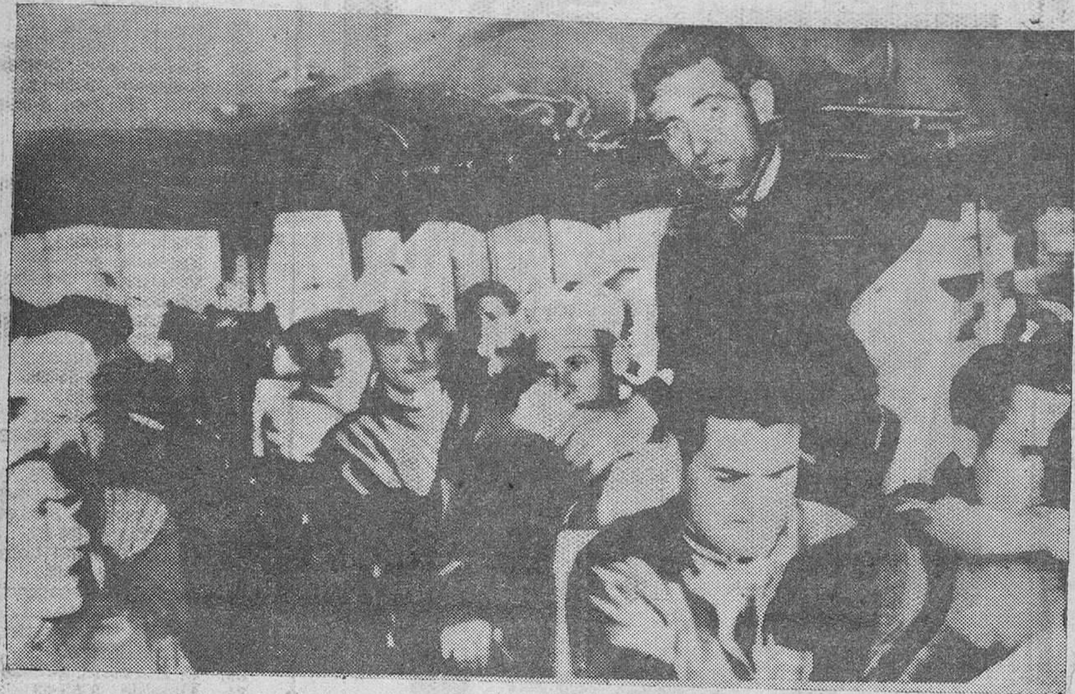
TOLEDO. — LOS CICLISTAS QUE CORREN LA VUELTA A ESPAÑA, HICIERON EL RECORRIDO TOLEDO-MANZANARES, NEUTRALIZADO, EN AUTOBUS, EN LA FOTO, ALGUNOS DE LOS CORREDORES DEL EQUIPO "BOXING" DE ESPAÑA Y LORONO, DE PIE, DISPUESTOS A CUBRIR ESTE TRAYECTO, QUIZA EL MAS COMODO PARA ELLOS DE TODA LA VUELTA. — (Servicio urgente de telefonos "Cifras")