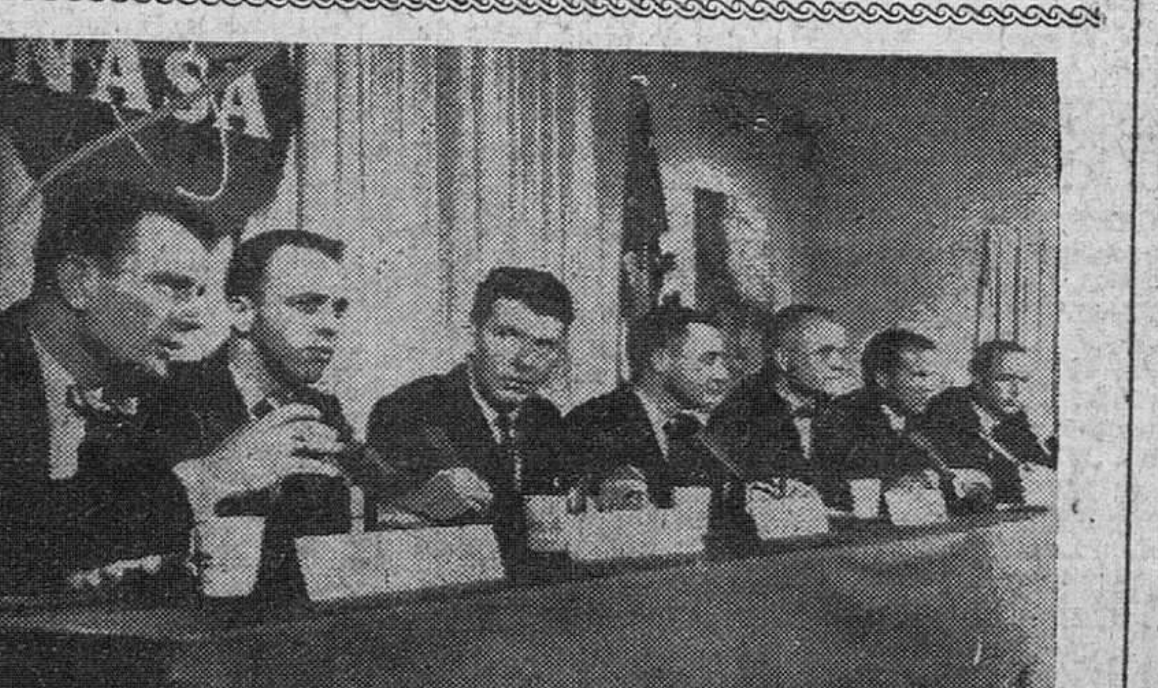
Alto honor a siete pilotos de prueba

Katmandu (Nepal). — El mando del ejército chino en el Tibet ha ordenado la ocupación de todos los Monasterios para evitar que puedan servir de base a los rebeldes, según informan de Katmandu.—Efe.