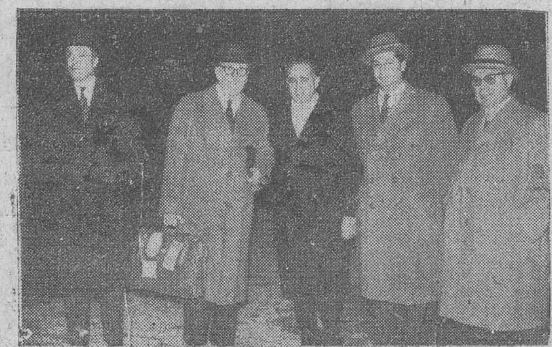
Madrid.— El embajador de España, don Manuel Aznar, al frente de los miembros que componen la Misión extraordinaria española en la ceremonia de la toma de posesión del presidente de Venezuela, don Romulo Betancourt, fotografiados en el aeropuerto de Barajas, momentos antes de tomar el avión que los trasladó a Caracas.

Sale para Caracas una misión extraordinaria española