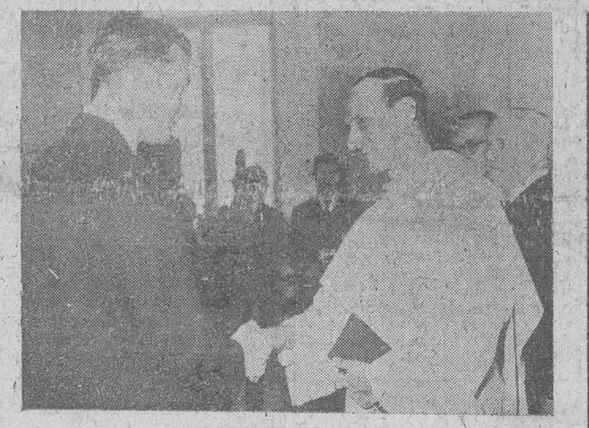
En el palacio de las Academias, de Bruselas, ha tenido lugar una sesión de homenaje nacional al Padre Pire, Premio Nobel de la Paz. En la foto aparece el Príncipe Alberto, representando a la Familia Real belga, saludando al Padre Pire.

firmadas al dorso. El plazo de presentación finaliza el 1 de Abril de 1959, en las oficinas de la Fundación, Núñez de Balboa, 68, Madrid. Los fallos se comunicarán por los jurados al Consejo de Patronato antes del 1 de Junio de 1959 y las ayudas serán individuales. Los trabajos objeto de la ayuda se presentarán, totalmente terminados al Consejo de Patronato de la Fundación antes del 1 de Julio de 1961. Se crean cien "Becas de estudios en España Fundación Juan March, año 1959", destinadas a los españoles que se comprometan a desarrollar en el plazo de un año a partir del 1 de Julio de 1959, y en las condiciones que se determinen, un trabajo comprendido en los siguientes grupos: Grupo A. Estudios técnicos e industriales; grupo B. Ciencias matemáticas, físicas y químicas, veinte becas de cada uno. Grupo C. "Ciencias naturales y sus aplicaciones"; grupo D. "Ciencias médicas"; grupo E. "Ciencias jurídicas, sociales y económicas"; grupo F. "Ciencias sagradas, filosóficas e históricas, quince becas de cada grupo. (Pasa a última pág.)