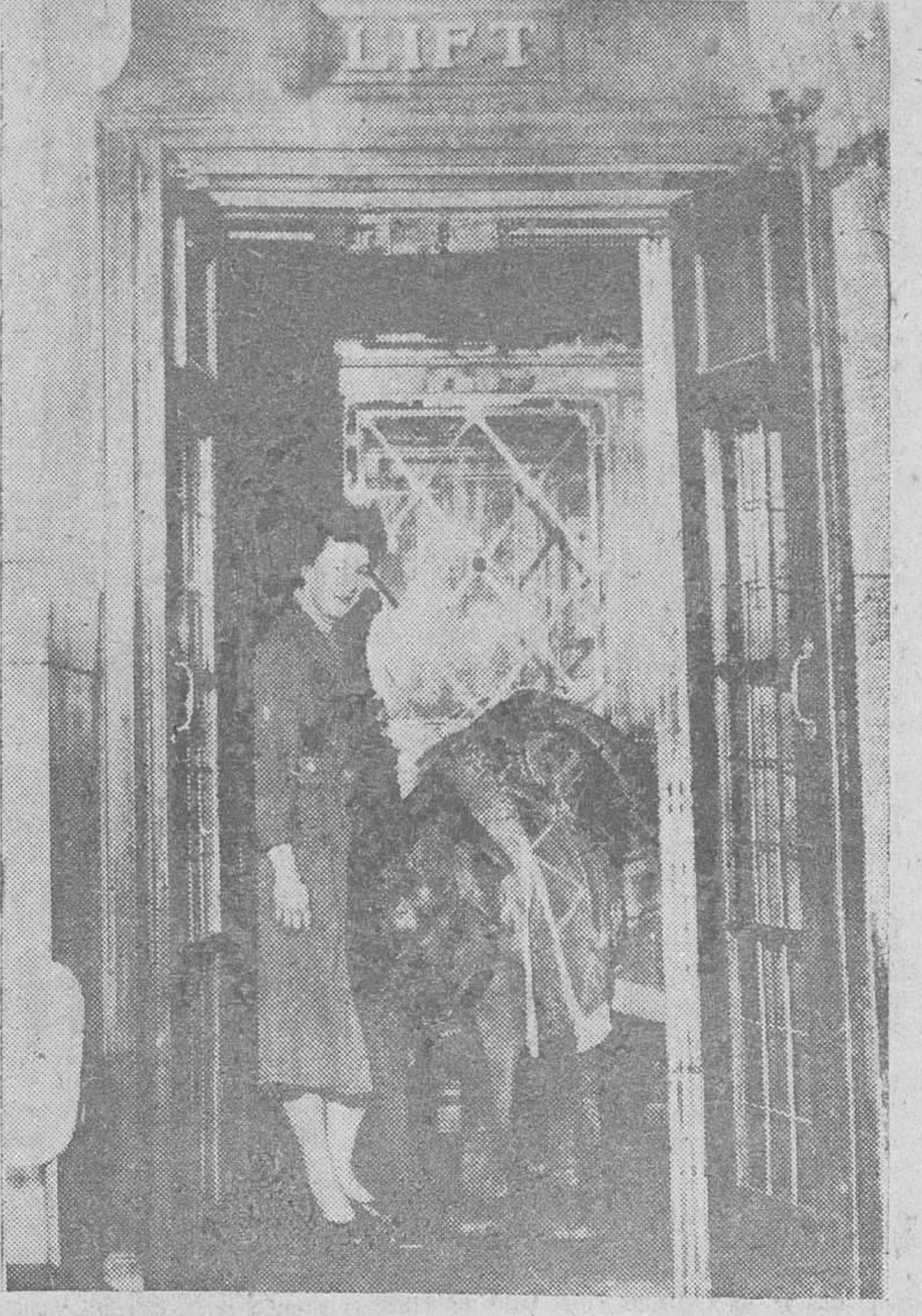
¡Cómo! ¿Un elefante en el ascensor? Sí. Más de un portero de los que conocemos hubiera muerto de un síncope al verlo, pero en Londres no es lo mismo. El joven elefante de circo ha sido invitado a una reunión mundana en el tercer piso de un restaurante de Piccadilly, y allí va, en compañía de una joven cuidadora.

contra veinticuatro mil millones de exportaciones, de las que fueron los principales usufructuarios la Unión Económica Belgo-Luxemburguesa y los Estados Unidos. La producción minera —antes en completo abandono— alcanza hoy cuantiosas cifras, entre las que descuellan los quinientos millones y medio de quintales de diamante industrial, y las 300.000 toneladas de cobre y otras tantas de manganeso y los doce mil kilos de oro fino. En el aspecto agrícola, hay que parar mientes en los ocho millones de toneladas de toneladas de mandioca, dos millones de toneladas de plátano, 300.000 de maíz, y 300.000 de caña de azúcar. La foresta proporcionó el pasado año cerca de un millón de metros cúbicos de madera en bruto y tres millones y medio de leña. Este gigantesco esfuerzo, esta colosal obra colonizadora, ha sido posible merced a una formidable administración y sabias reglas dictadas por el Gobierno de la Metrópoli, atento siempre a elevar el nivel de vida del indígena. Sería injusto a todas luces olvidar, cuando se aproxima la hora de la independencia de otro pueblo africano —no olvidemos que África puede ser el Continente del porvenir— la magnífica floración que hoy presenta una colonia, que, a juzgar por las promesas del Rey Balduino, dejará de serlo, para convertirse en un Estado libre e independiente. (Colaboración LOGOS).