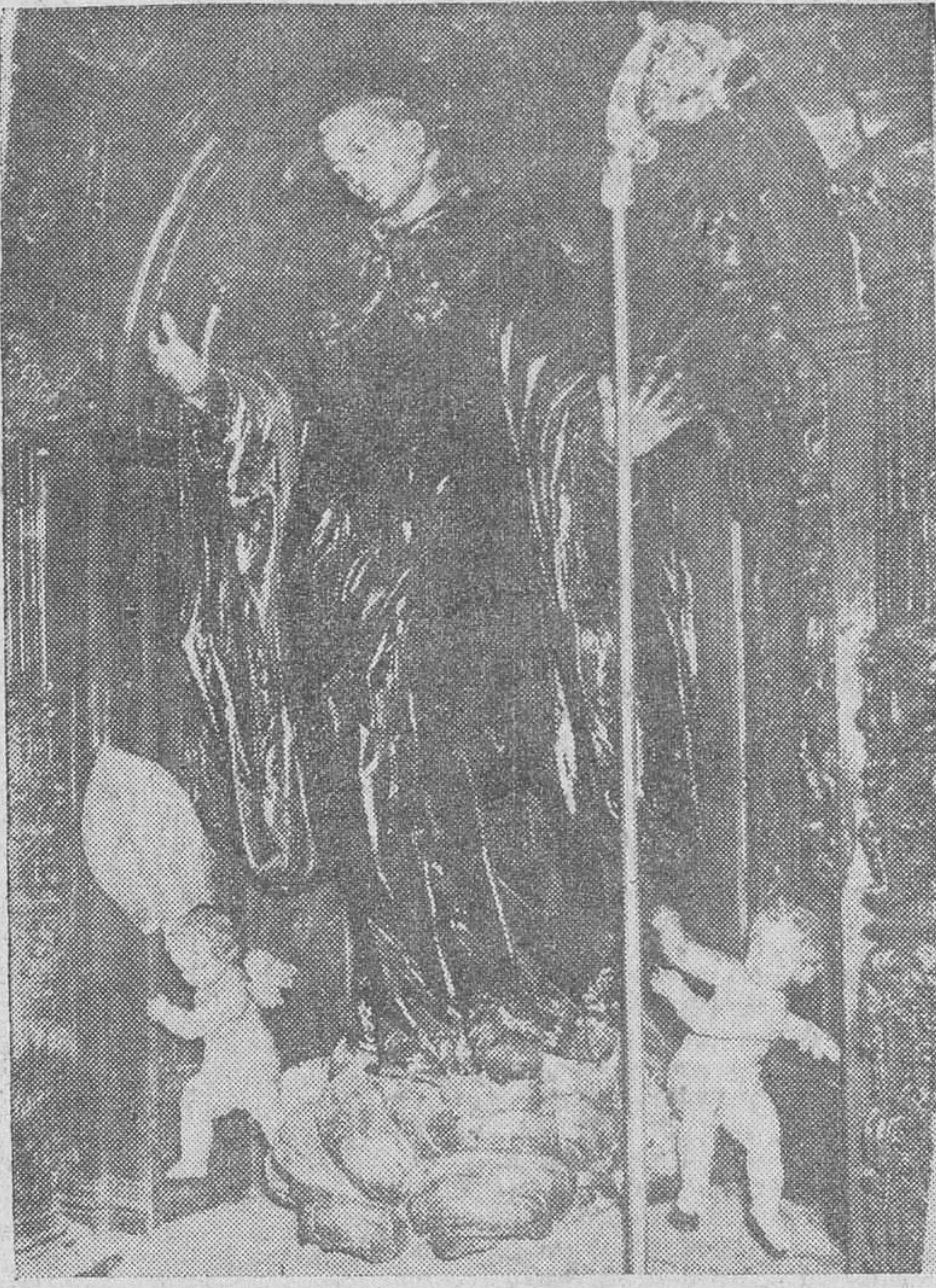
Esta es la magnífica talla de San Lesmes que preside el altar mayor y tal como aparece actualmente, después de la minuciosa limpieza artística a que ha sido sometida.

Desde que en el siglo XVI nuestro noble y ojalval templo patronal de la Ciudad, San Lesmes, Abad, cuya erección, como es sabido, data de la baja Edad Media, estuvo a punto de desmoronarse —y lo hubiéramos perdido irremisiblemente de no haberse fortalecido a tiempo sus pilares y rehecho la nave central y el cruceo—, hay que reconocer ahora que nunca después se cernió tan inquietante el peligro latente de ruina como en el año 1955, debido al lastimoso y putrefacto estado de su cubierta y principales bóvedas que amenazaban con hundirse. Su inseguridad era tan manifiesta y grave que se imponían remedios urgentes, por lo que, una vez informado al arzobispo de la diócesis, doctor Pérez Platero, fue acordado, con su aliento y bendición, acometer las necesarias obras de reforma y reparación de la iglesia, confiando en los divinos auxilios de la Providencia, en la generosidad de los feligreses y en la inmediata solidaridad del pueblo, amante de su Patron, San Lesmes. A mediados de 1956 empezaron los trabajos de restauración, desahucados conforme al ritmo impuesto por la naturaleza específica de la obra y las disponibilidades económicas, factores que ha habido necesidad de armonizar, arbitrando las soluciones más realistas.