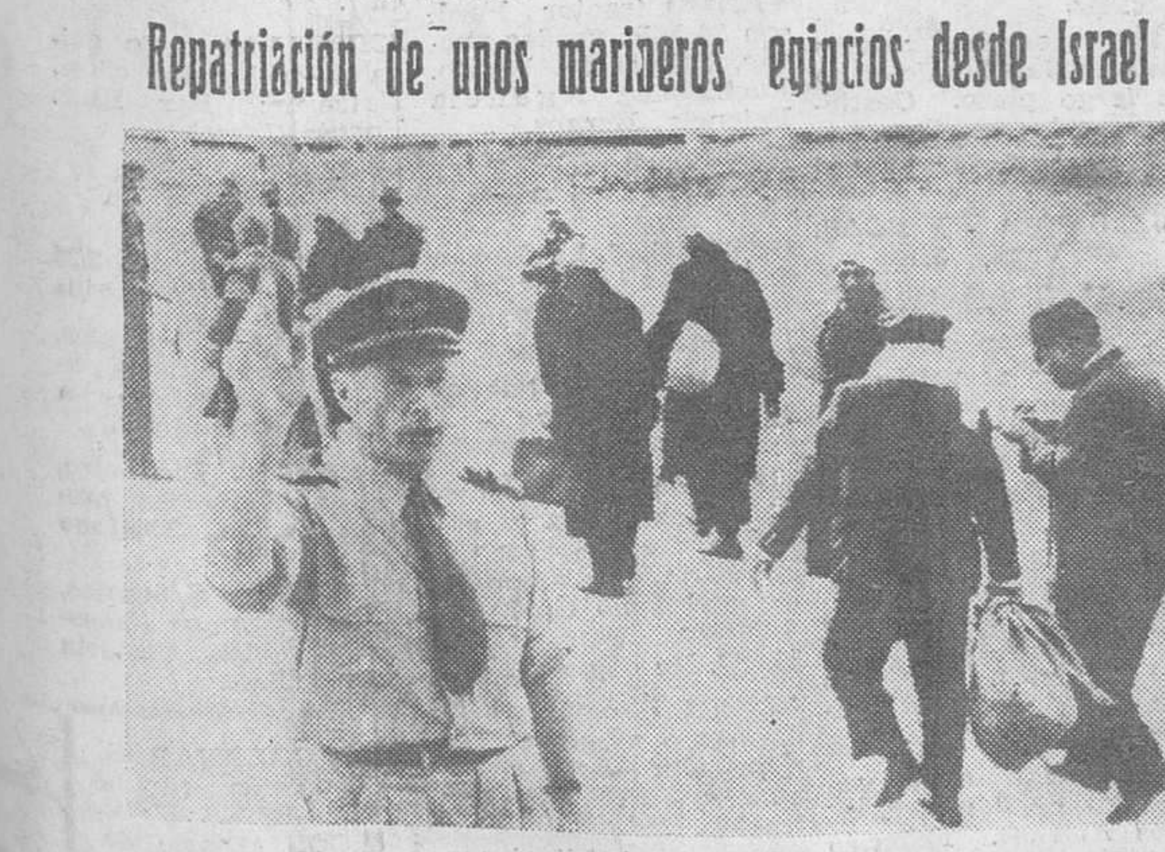
Zona de Gaza. — Un oficial del Ejército egipcio (en el extremo izquierdo de la foto), saludando a los ocho miembros de la tripulación del barco "Massoud", al pisar territorio egipcio procedentes de Israel. Dichos marineros fueron repatriados a través de los funcionarios de la ONU en la frontera de Gaza. En primer término, un oficial de las Naciones Unidas señala a los israelíes que dicha tripulación ya se encuentra en territorio de Egipto.