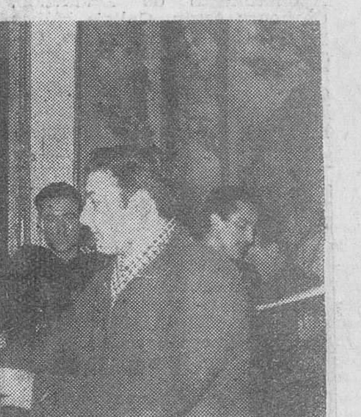
El Pardo. — Su Excelencia el Jefe del Estado hace entrega de los premios a los ganadores del III Concurso Nacional de Formación Profesional.