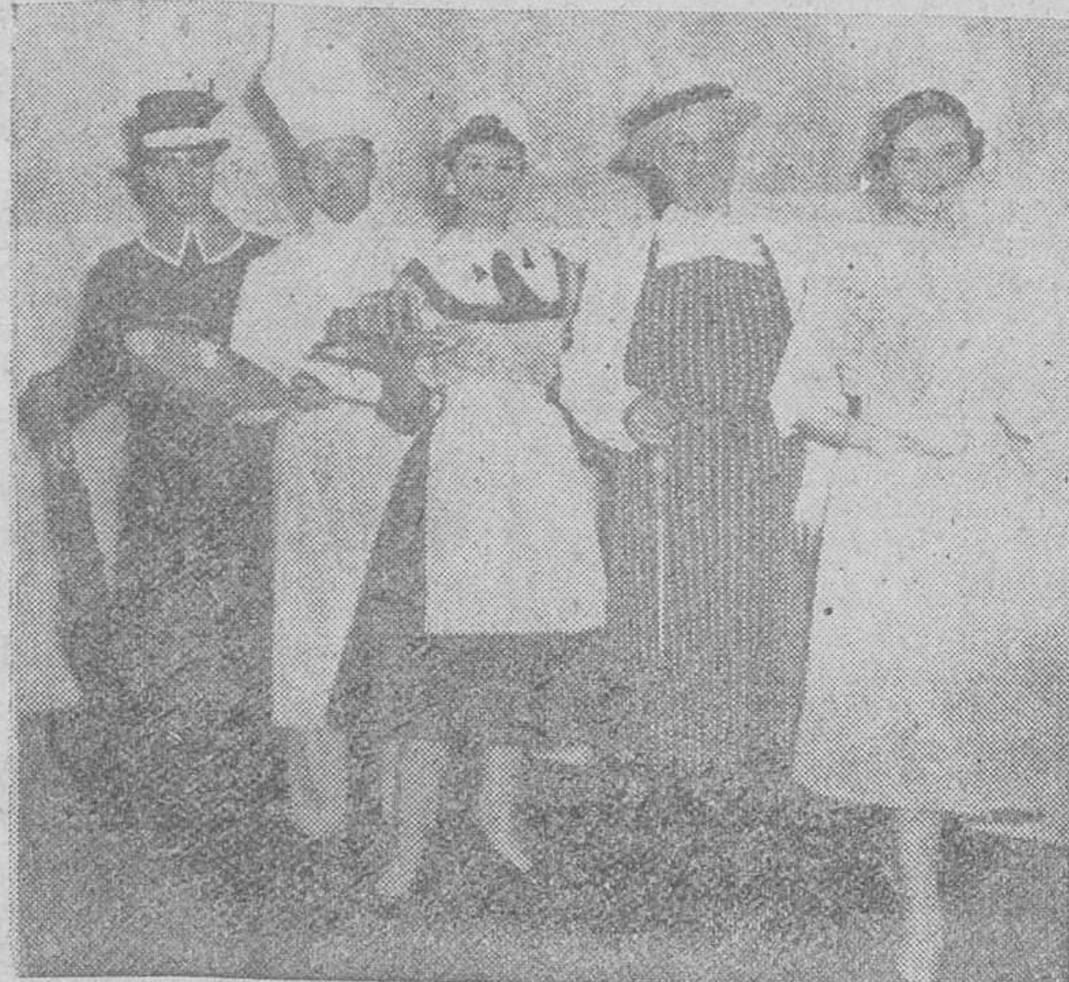
En una exhibición de la industria hotelera celebrada hace unos días en Londres, fueron presentados los nuevos diseños de uniformes para el personal de servicio, confeccionados totalmente de nylon. He aquí algunos modelos. De izquierda a derecha: conserje, cocinero, camarera, carnicero y doncella.