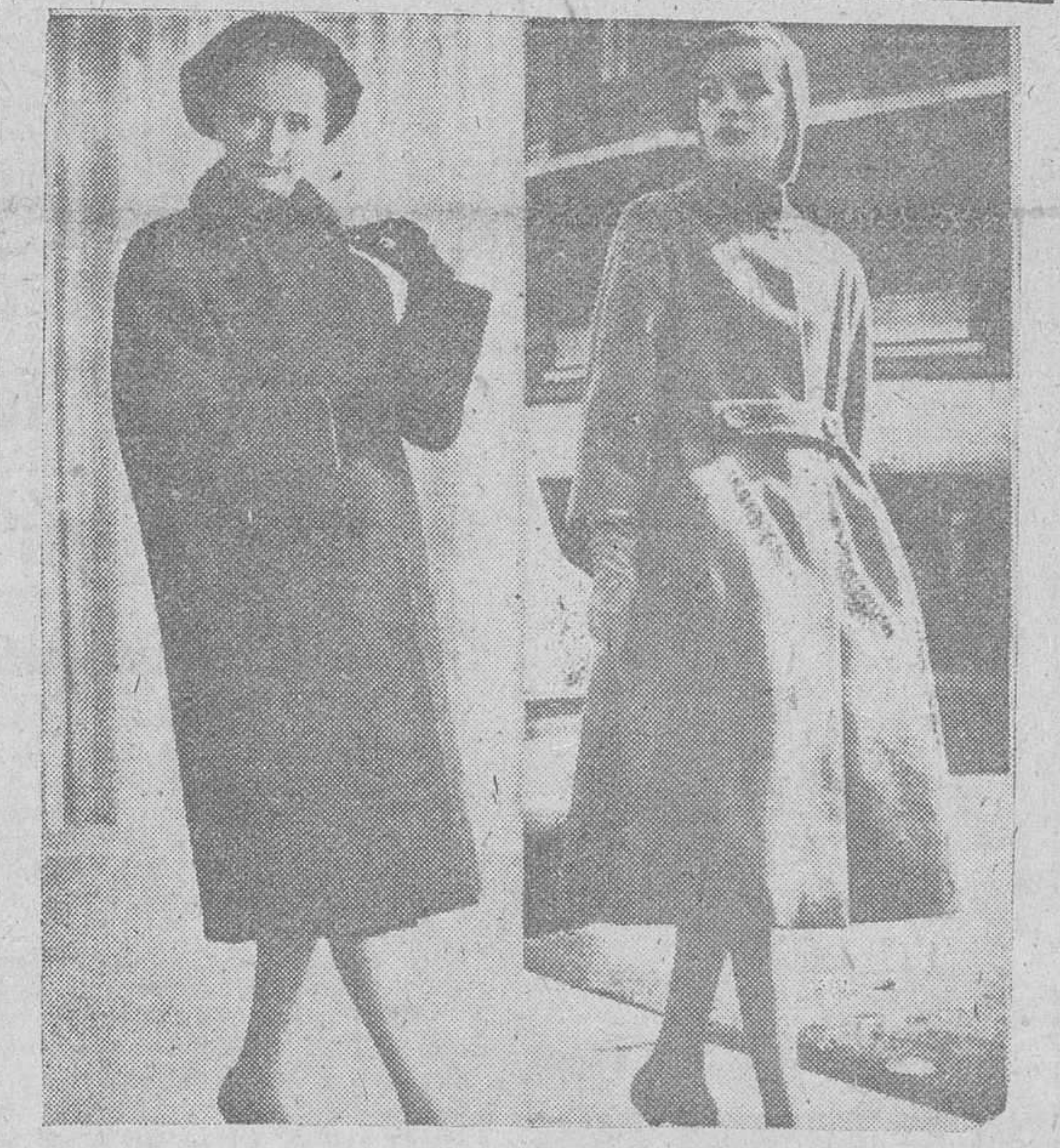
He aquí dos modelos para el próximo invierno, creados por la alta costura parisina. A la izquierda, abrigo en lana roja, con el cuello cerrado por un echarpe, original de Carven. A la derecha, abrigo de paño de cibelina, con talle suelto, de Pierre Cardin.