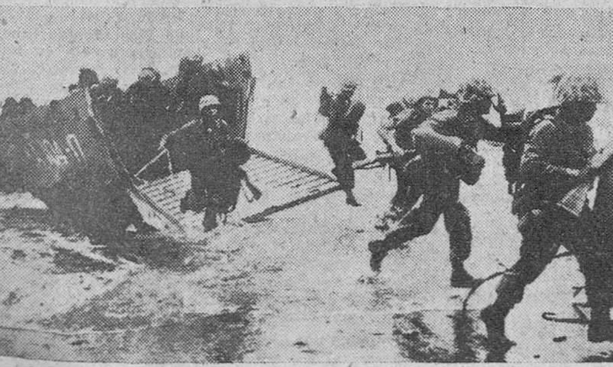
Taipeh. — "Marines" norteamericanos desembarcan en una playa de Formosa, durante las maniobras anfibia celebradas conjuntamente por fuerzas estadounidenses y chinas nacionalistas. El ejercicio, denominado "Land Ho", aunque de no mucha importancia, ha tenido una gran significación en vista de la crítica situación existente en los estrechos de Formosa.