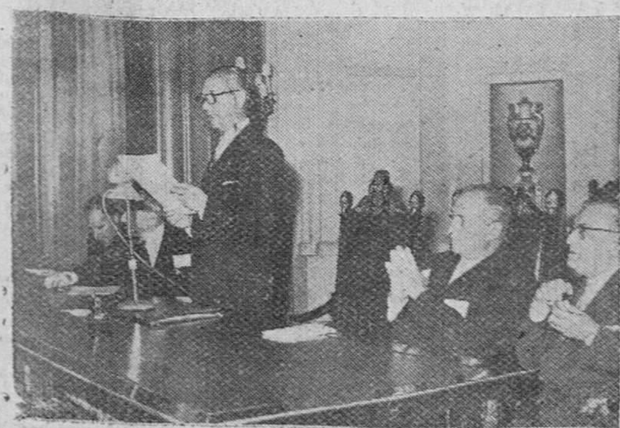
Madrid.—El ministro del Aire durante su discurso en el acto inaugural del Congreso Internacional de Ciencias Aeronáuticas que se celebra en esta capital.