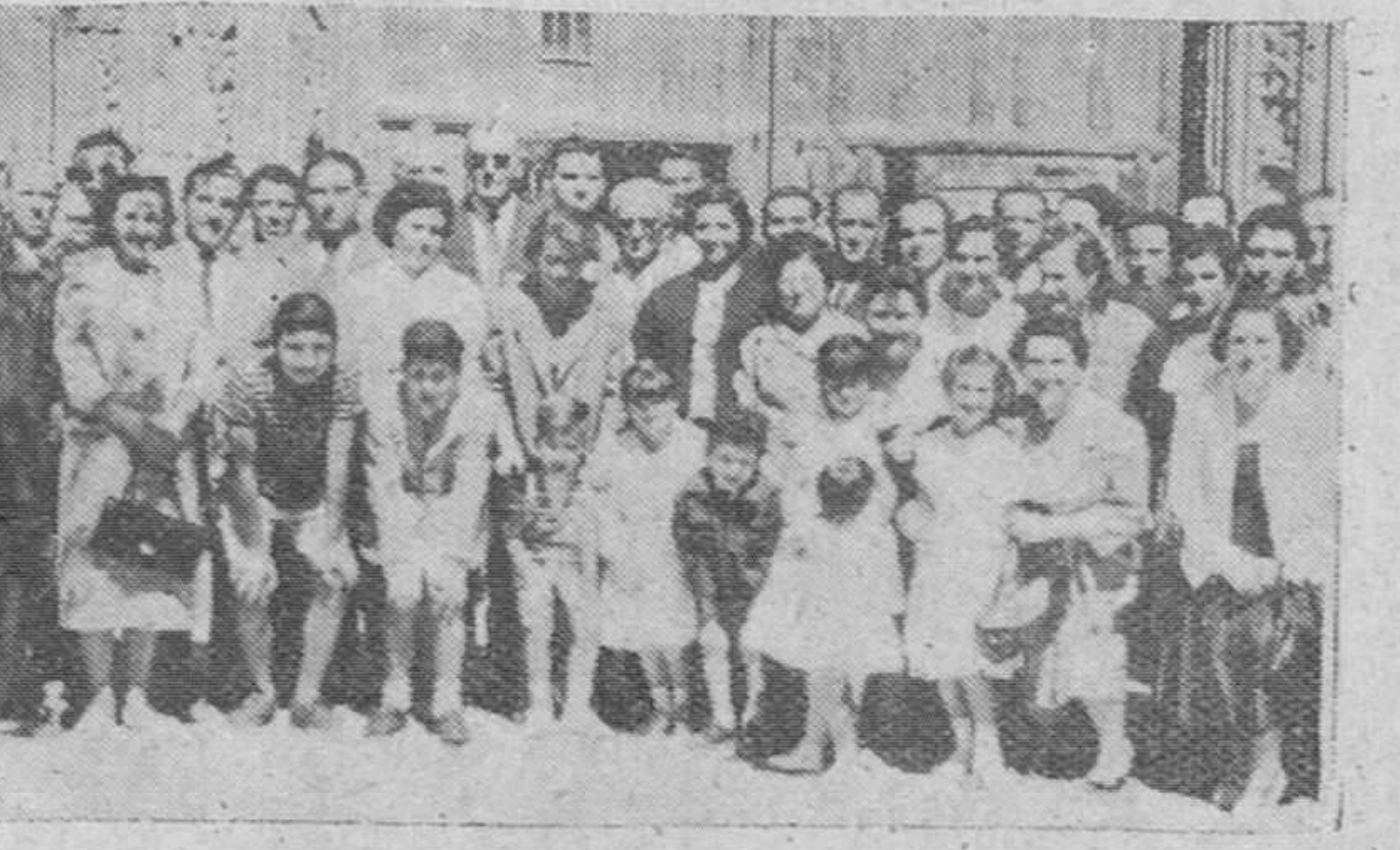
Grupo de palentinos que asistieron ayer a la misa celebrada en la Iglesia de San Lesmes, Abad, y que fue organizada con motivo de la festividad de San Antolín, por la "Casa de Palencia" en nuestra ciudad.