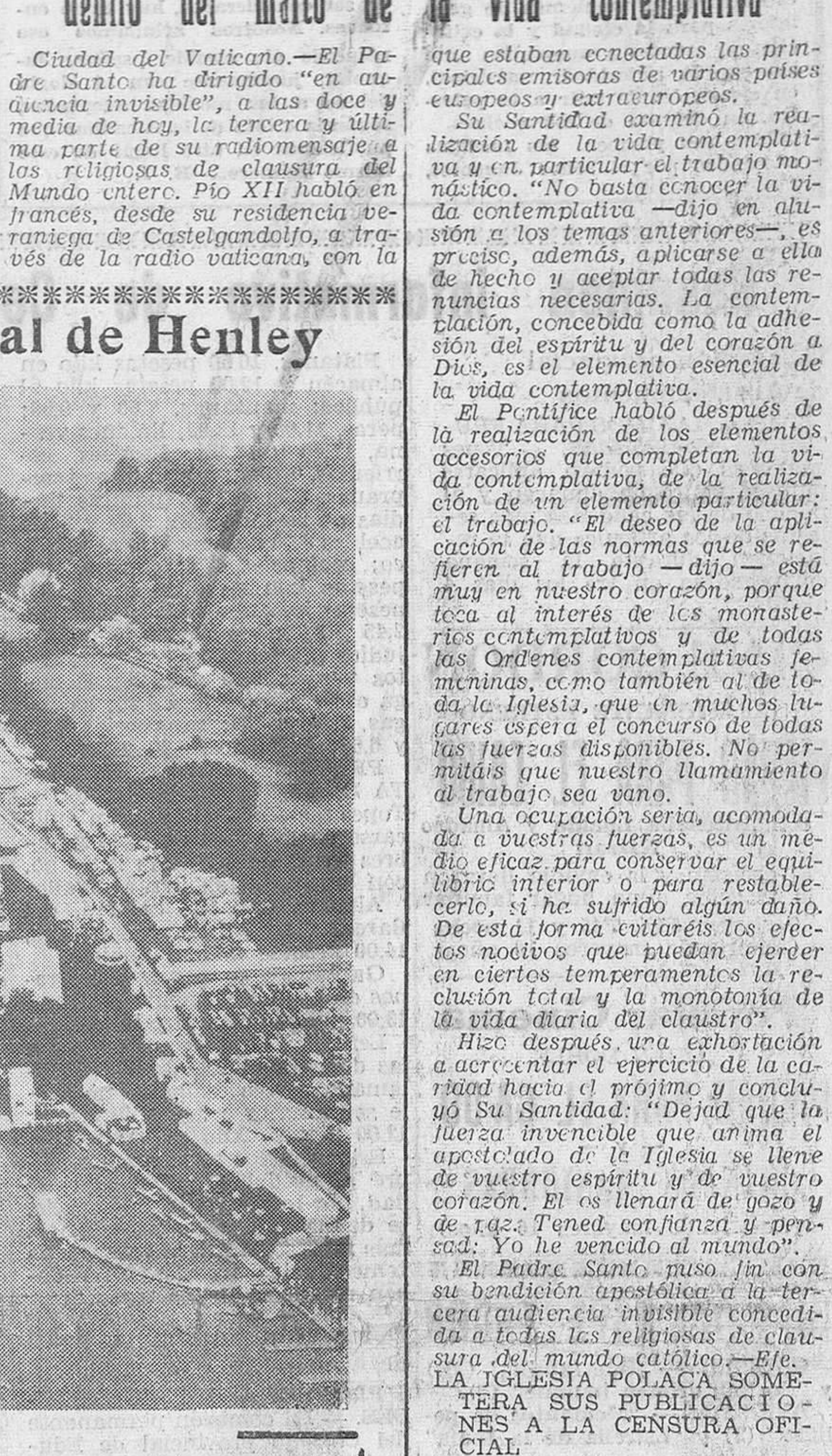
Una vista aérea del Támesis a su paso por Henley, durante la disputa de la famosa Regata Real, en la que se han enfrentado remeros británicos y de otros muchos países.

Hoy se efectuará la consagración episcopal de monseñor Lecuona en la S. I. Catedral