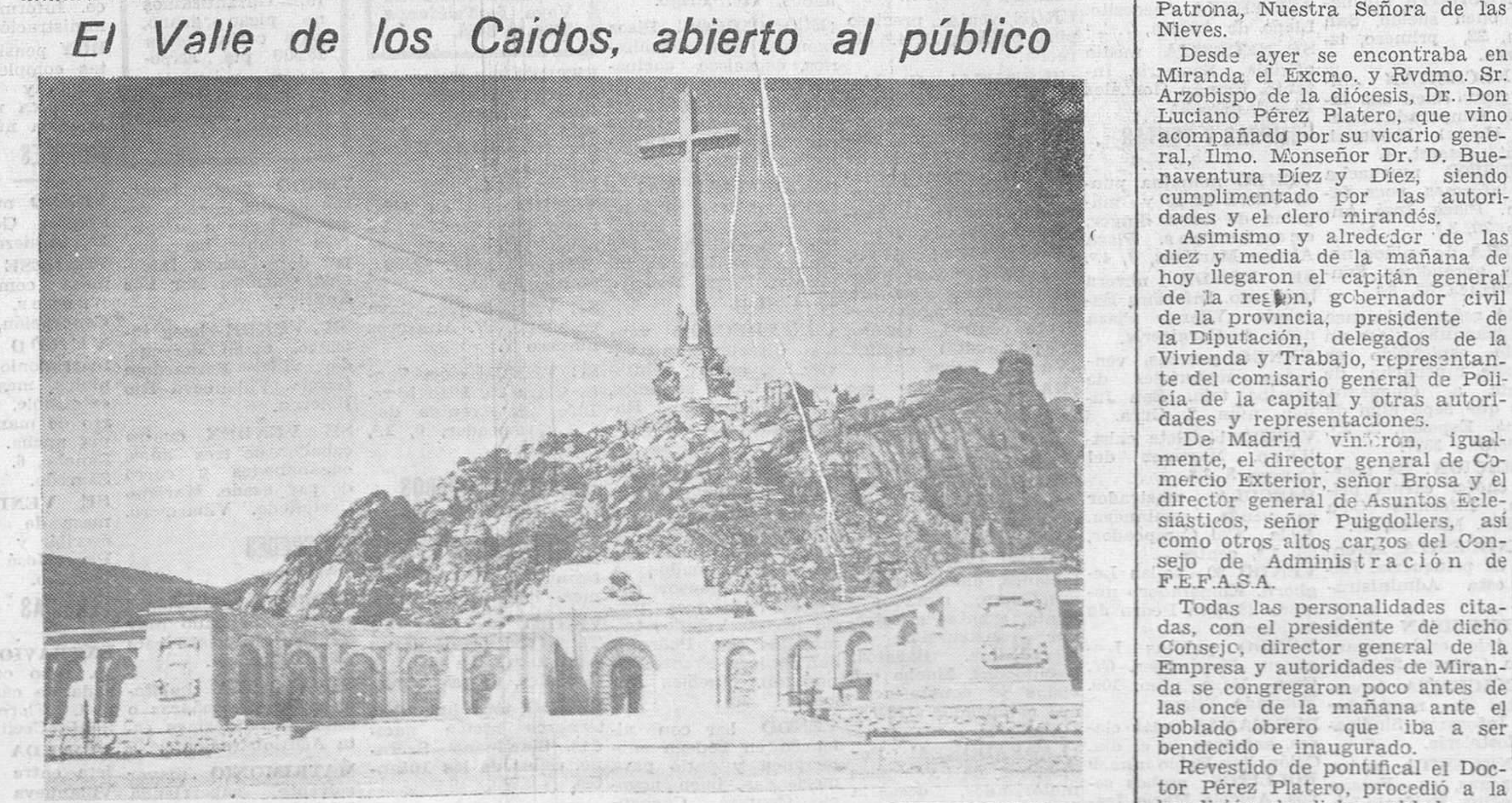
El Valle de los Caídos, abierto al público

Terminada la ceremonia, se celebró, desde el atrio, la bendición de la nueva iglesia, en la que penetraron el arzobispo de