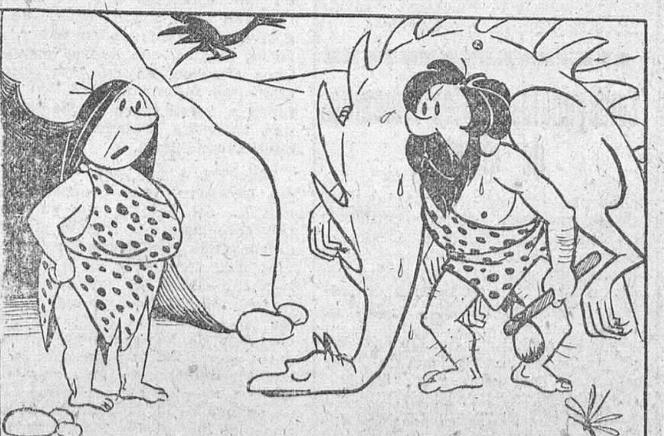
—Pero ya no te acuerdas que hoy comemos fuera de casa?