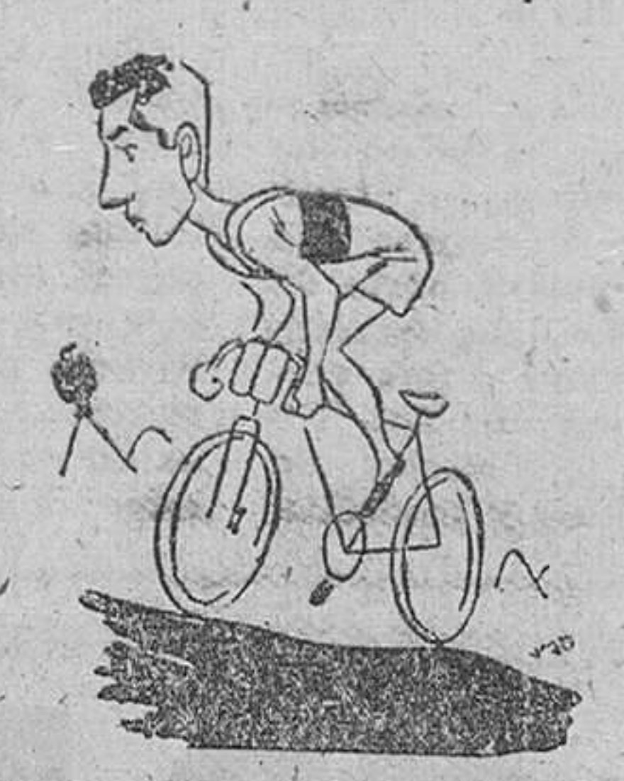
BAHAMONTES, vencedor de la cuarta etapa del "Giro"