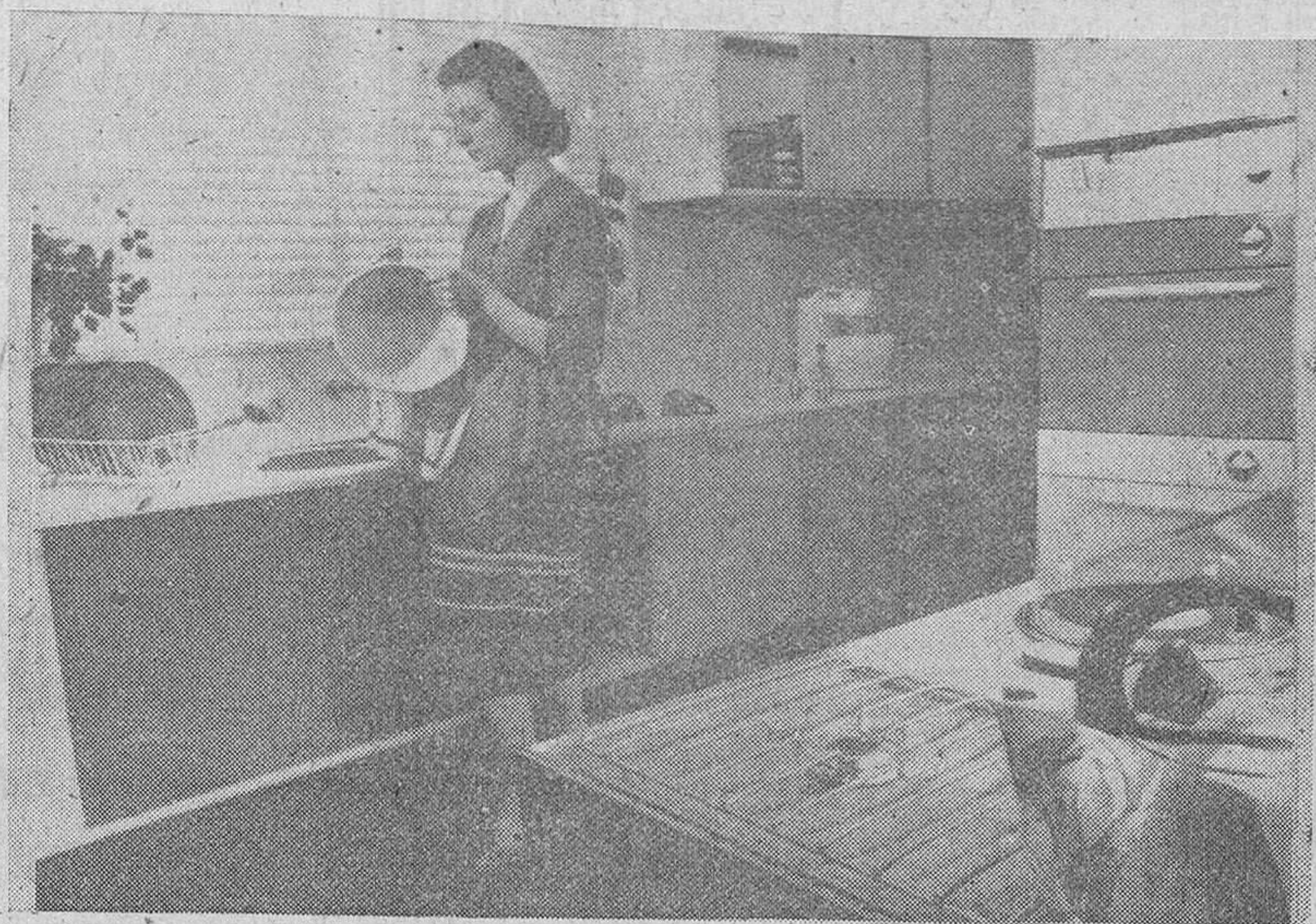
En la exposición londinense del "Hogar Ideal", puede admirarse esta moderna instalación de cocina, donde están previstas y hallan adecuada solución, todas las necesidades del ama de casa, bajo una rigurosa electrificación doméstica.