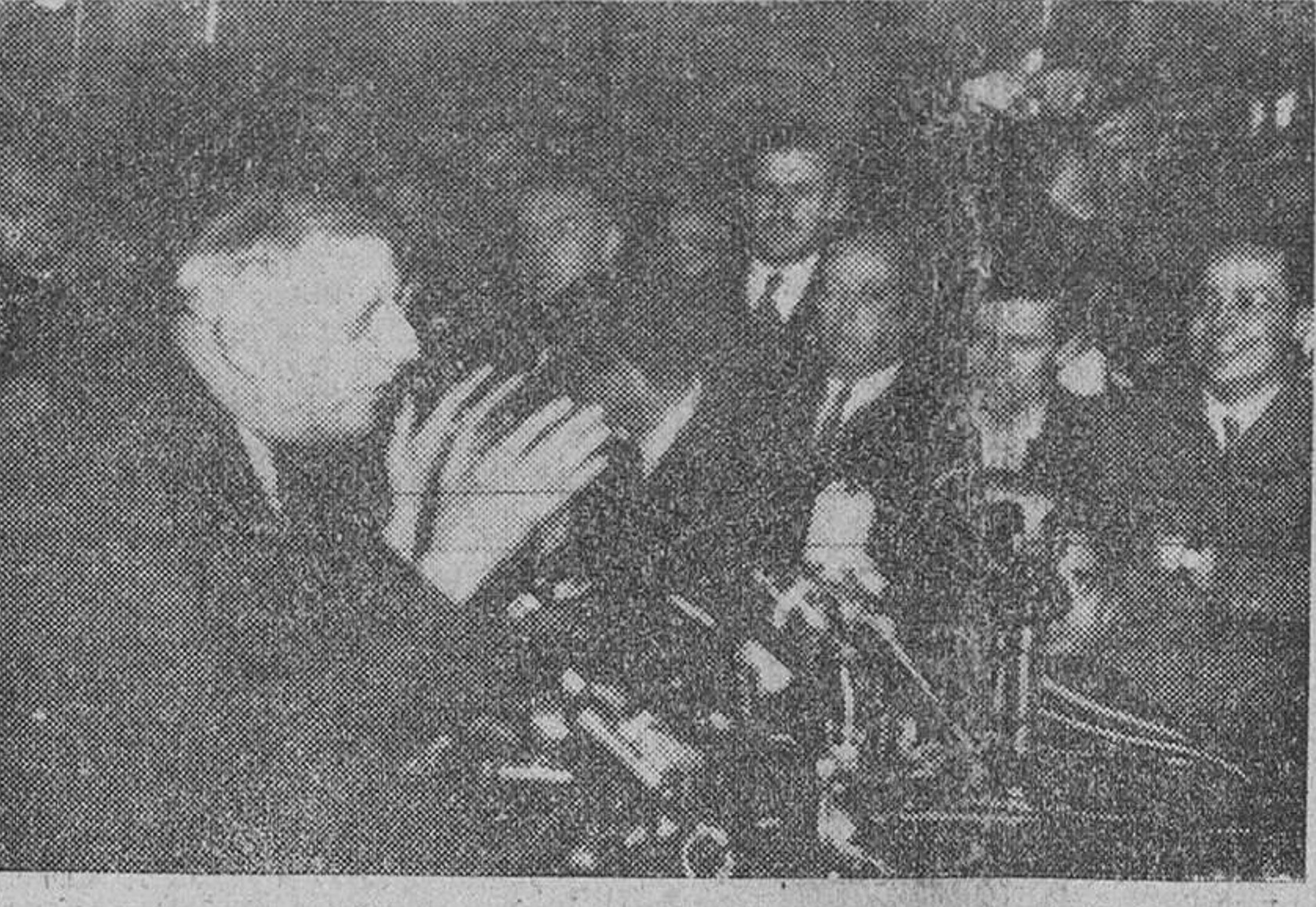
París. — El general De Gaulle, en una característica actitud durante su conferencia de Prensa del lunes en París, parece tratar de convencer a sus interlocutores y al Mundo entero, de la necesidad que tiene Francia de nombrarle jefe de Gobierno.

Según el jefe de los rebeldes del FLN, De Gaulle es capaz de hallar una solución que les satisfaga