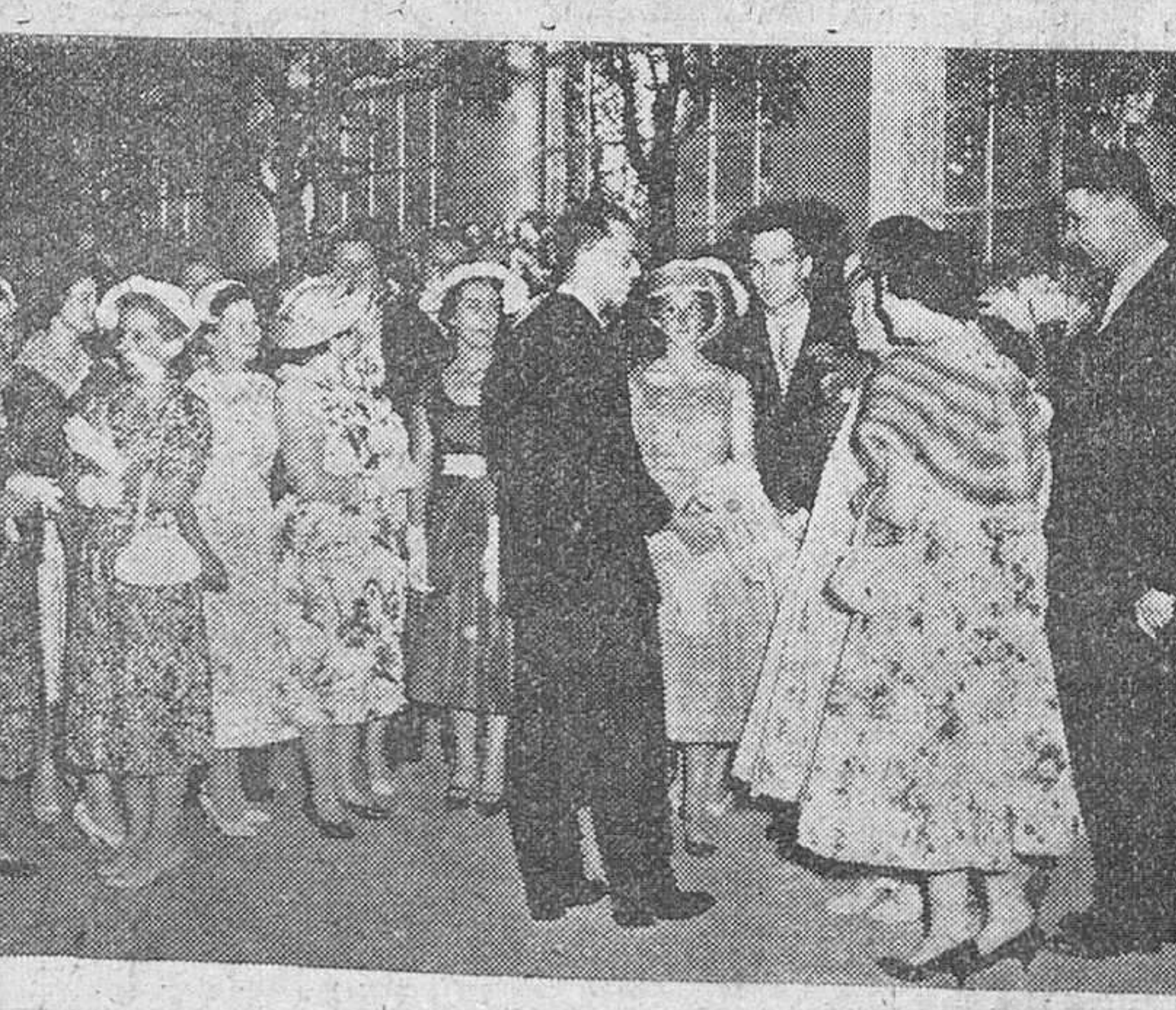
Bruselas. — Unos seis mil invitados han tomado parte en la fiesta ofrecida por el Rey Balduino de Bélgica, en los jardines del Castillo de Laeken. Estos jardines, fueron "construidos por iniciativa del Rey Leopoldo II y gozan de fama en el Mundo entero, por estar allí reunidas las más preciosas colecciones de flores y plantas raras. En la foto vemos un aspecto de la fiesta que resultó de gran brillantez. En el centro y casi de espaldas, el Rey Balduino.