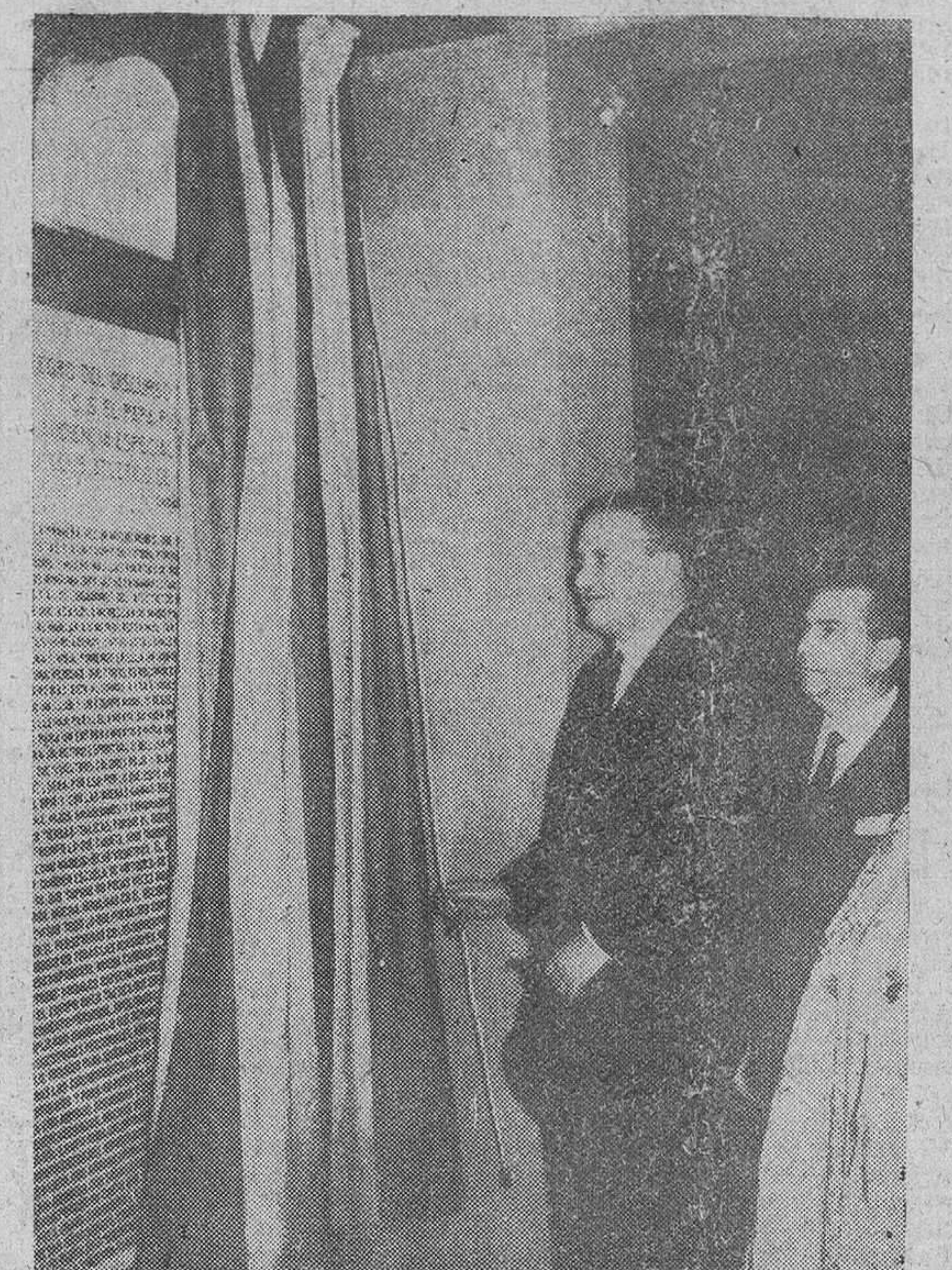
Bilbao. — El ministro de Asuntos Exteriores, Sr. Castiella, en el momento de descubrir la lápida colocada en el campo de San Mames, que recoge el discurso íntegro que Su Santidad, el Papa, dedicó al Atlético de Bilbao, en la visita que sus jugadores y directivos le hicieron en julio de 1956, con motivo de sus partidos de la Copa Latina.