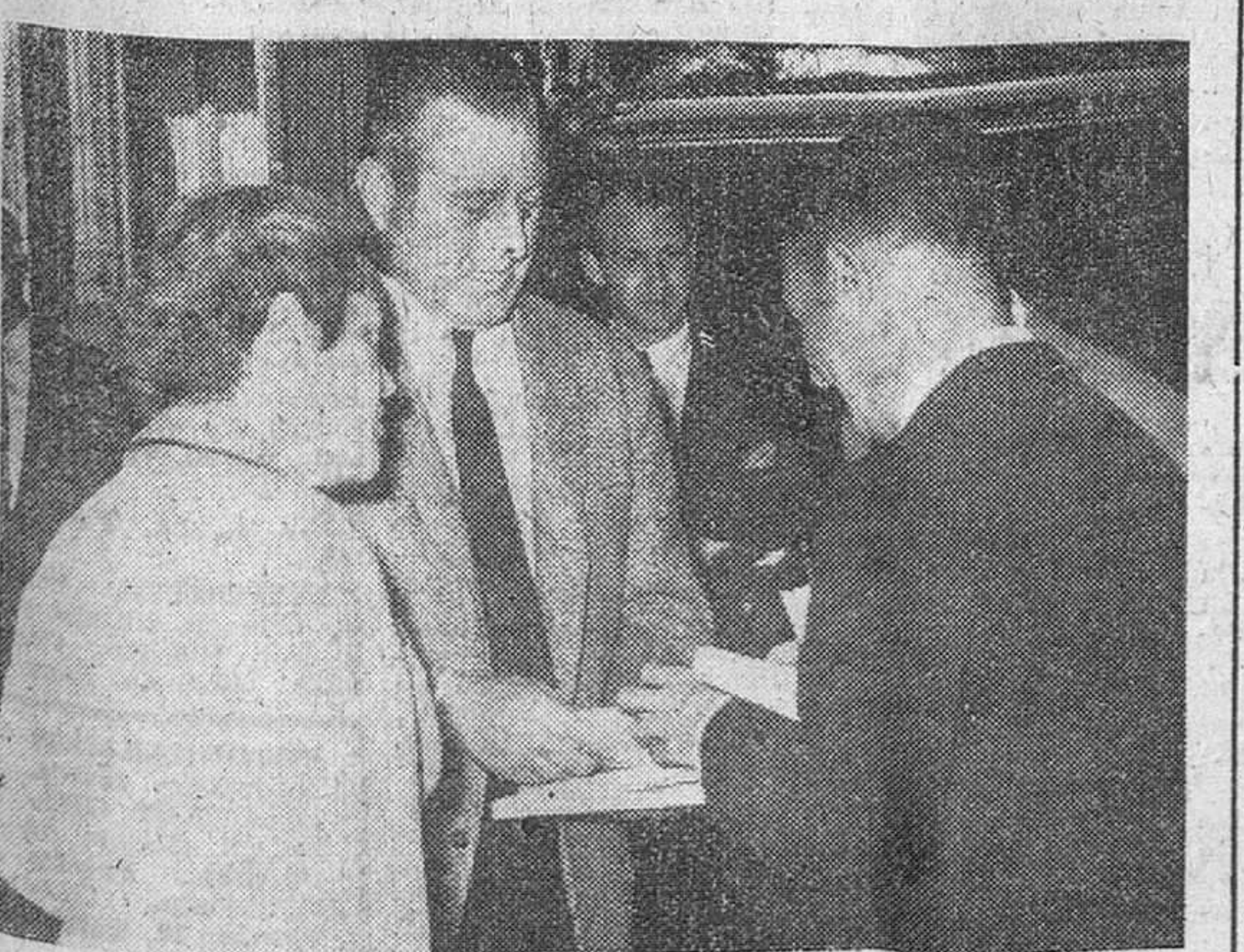
Madrid.— Un momento de la visita efectuada por un grupo de periodistas norteamericanos y suscriptores del «Camden Courier Post» —que realizan por España un viaje de turismo— al alcalde de esta capital. El Conde de Mayalde obsequió a los visitantes con una copa de vino español.