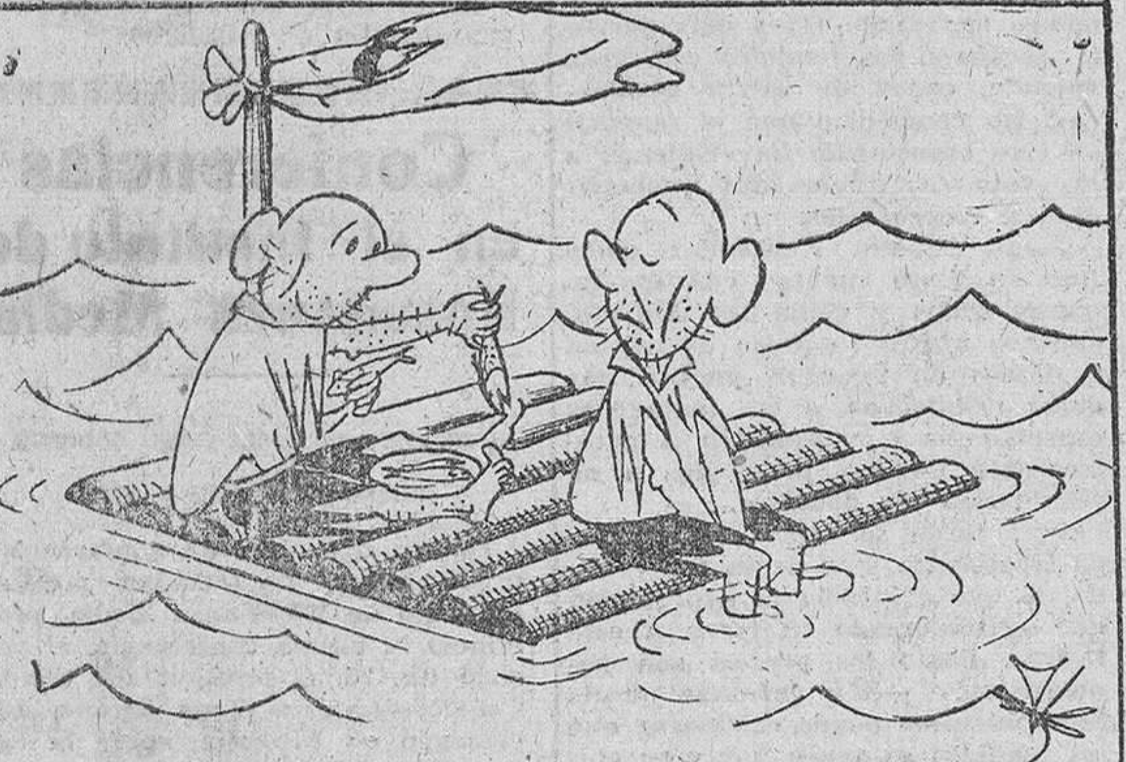
—No, gracias; el pescado azul me sienta mal.