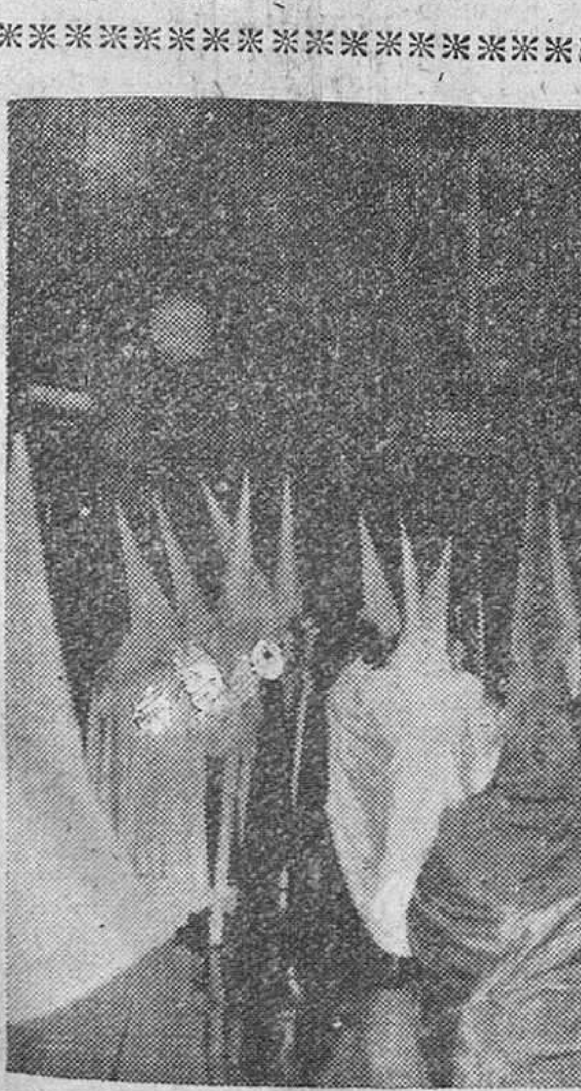
El Via-Crucis penitencial de anoche

Sollihull (Inglaterra). — Un gas para cocinar no venenoso, cuya base es el petróleo y carbón en polvo, sustituirá al gas ordinario en todas las casas del país, afirma el doctor Frederick Dient, director de investigación del Consejo nacional del gas.—Efe.