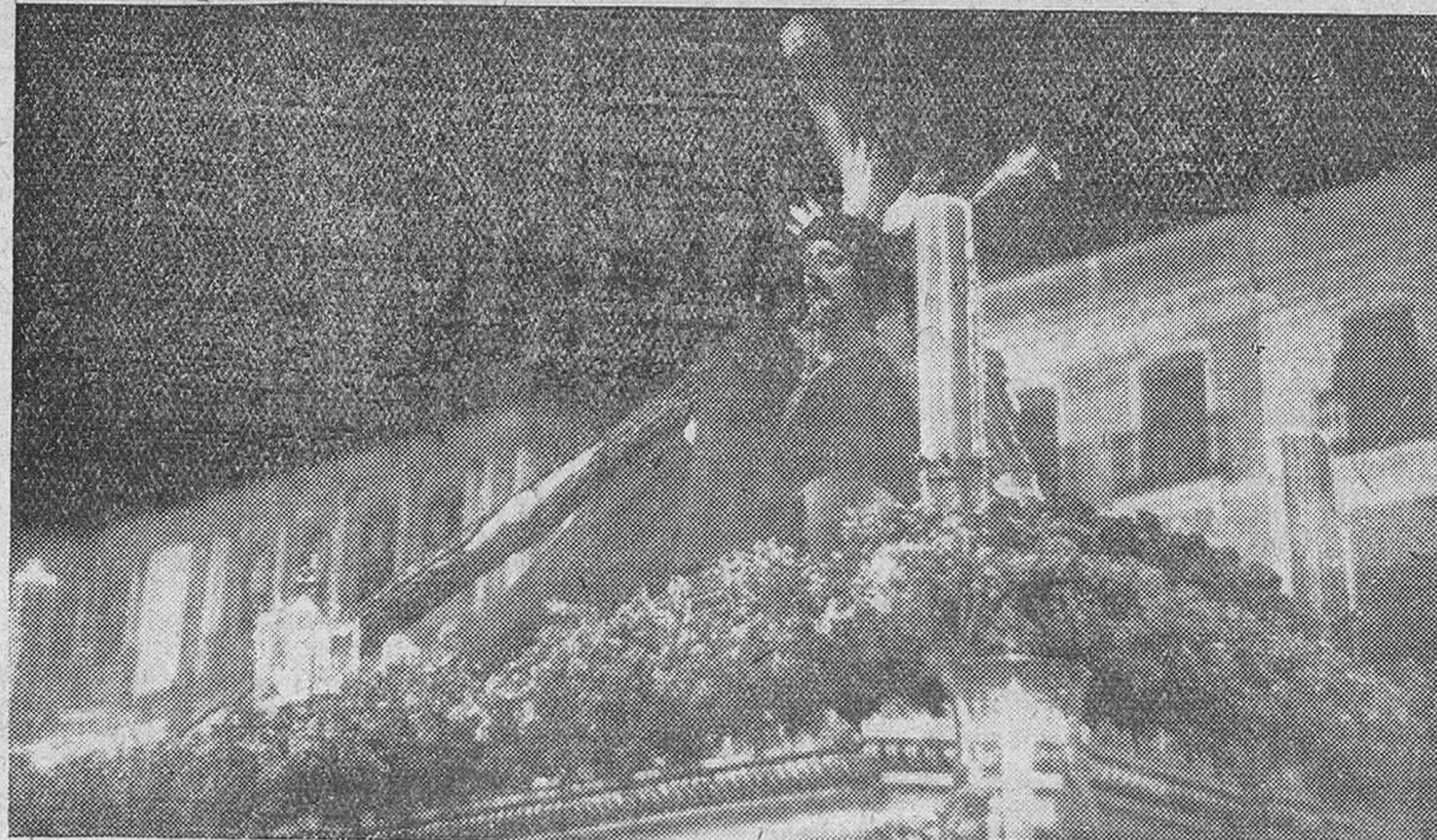
"CRISTO DE LAS PENAS", EN LA PROCESION DEL MARTES SANTO, EN SEVILLA

No es menos hermosa la Semana Santa de Murcia, con su Anjel de Saltillo, tan dulce, tan hermoso en su escultura —cumbre del arte de la imaginaria barroca española— que enamora a lo hondo del espíritu. Dicen que Saltillo se inspiró en su hija, para tallar su Anjel, cuando ya la muchacha había muerto. Del mismo orden de inspirada gracia levantada, es el libro de Gabriel Miró: "Estampas; Figuras de la Pasión del Señor", una de las más bellas obras de la literatura contemporánea, de España. Si la gracia preside la Sema-