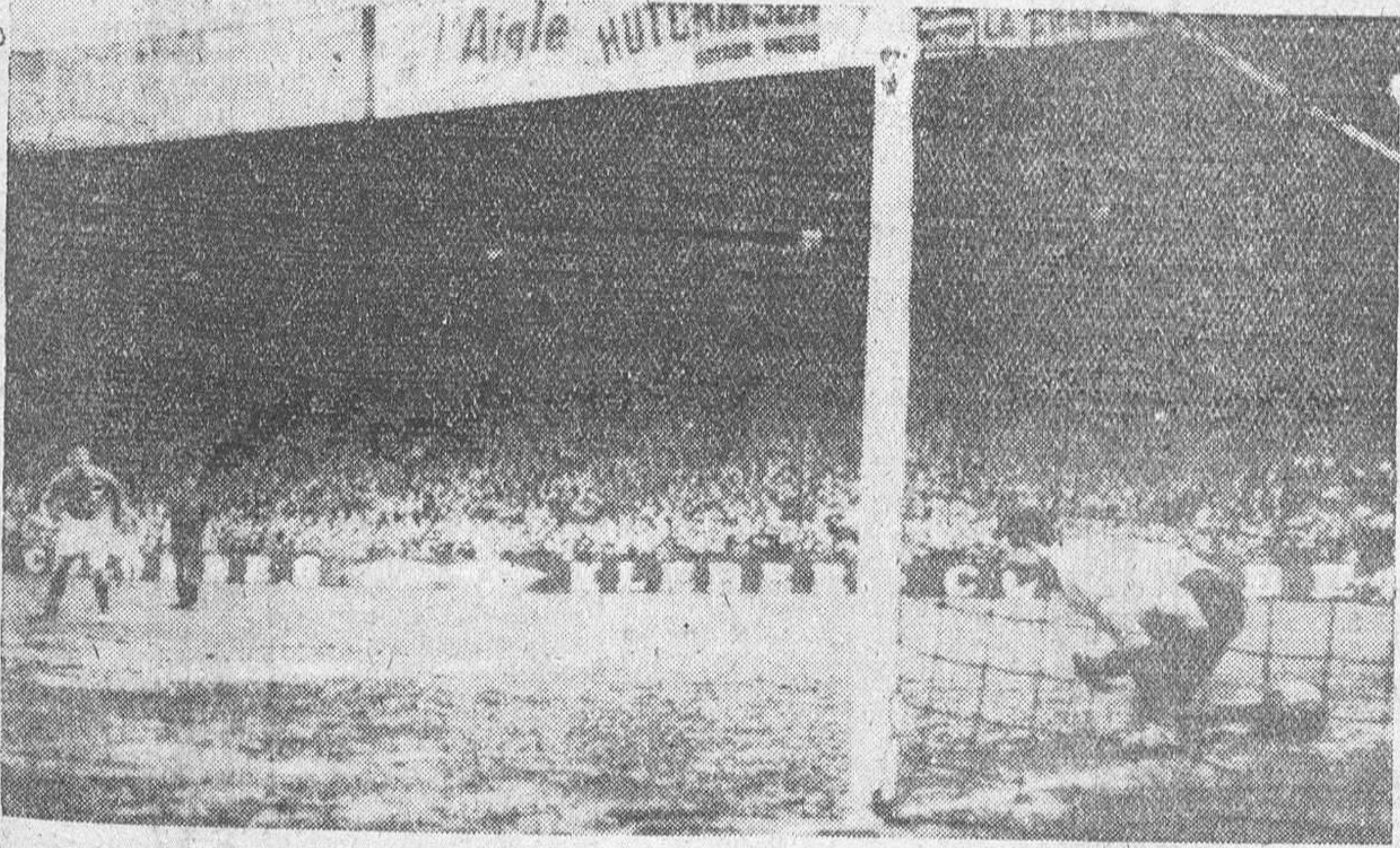
Empate a dos entre las selecciones futbolísticas de España y Francia

París. — Momento de producirse el primer gol del equipo español, en el partido internacional de fútbol, jugado en el Parque de los Príncipes, entre las selecciones nacionales de Francia y España, que concluyó con empate a dos. El fuerte tiro de Kubala, no pudo ser neutralizado por el portero francés y el balón, pasó por entre las piernas de Abbas para alojarse en el fondo de la jaula.