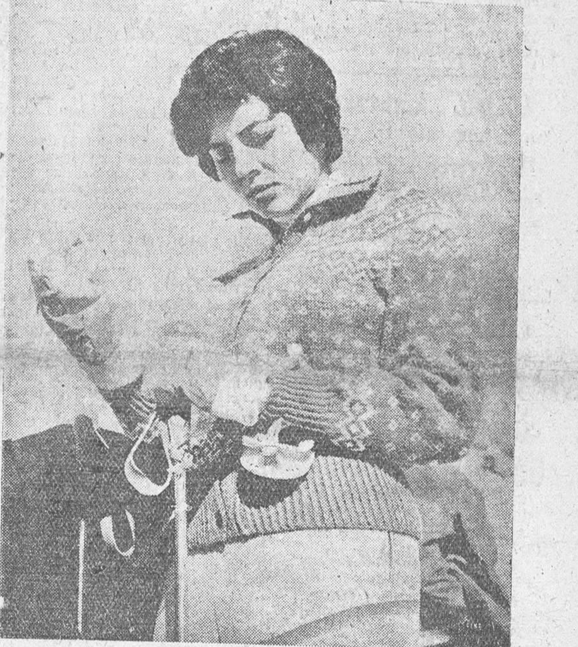
Una de las más recientes fotografías de la emperatriz Soraya, obtenida en las pistas de Saint Moritz (Suiza), donde acaba de pasar una temporada de descanso.

«Sacrificaré mi felicidad personal por el bien del pueblo iraní», ha dicho la Reina