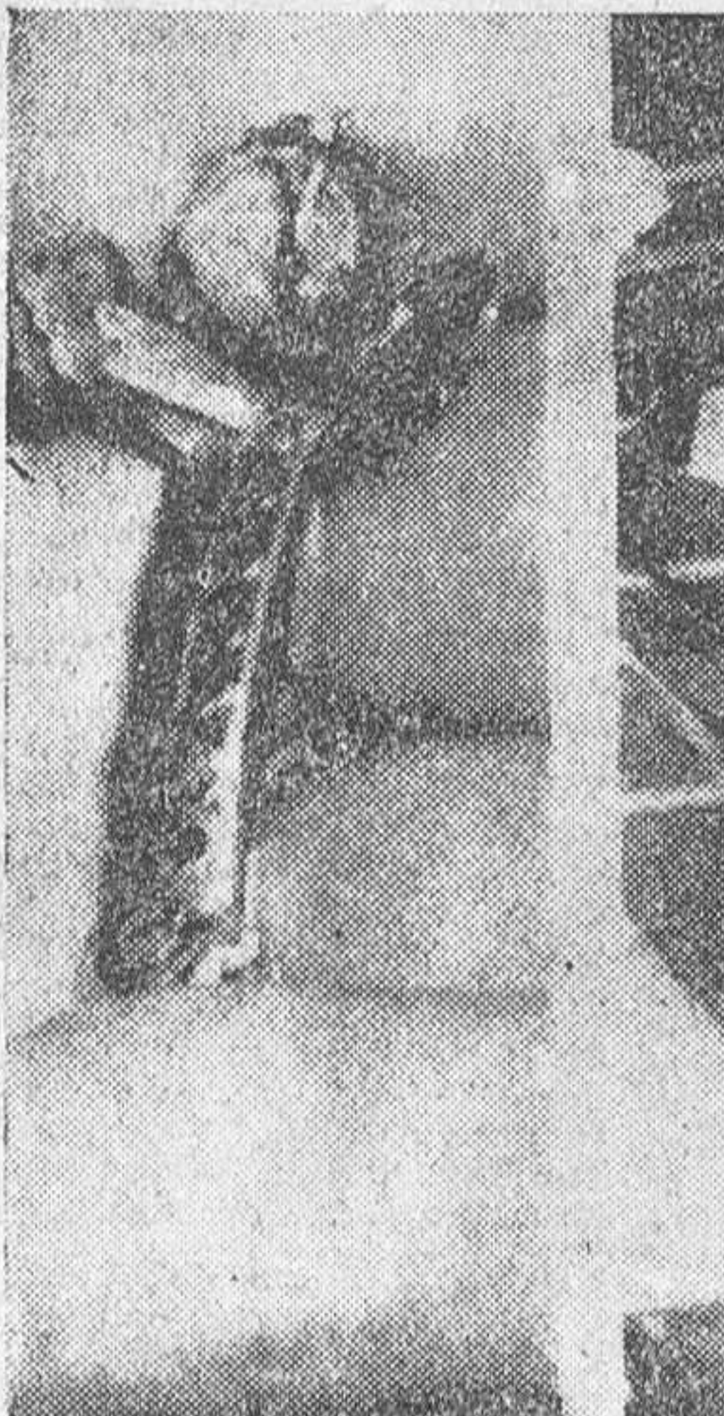
El crucifijo salvó su vida