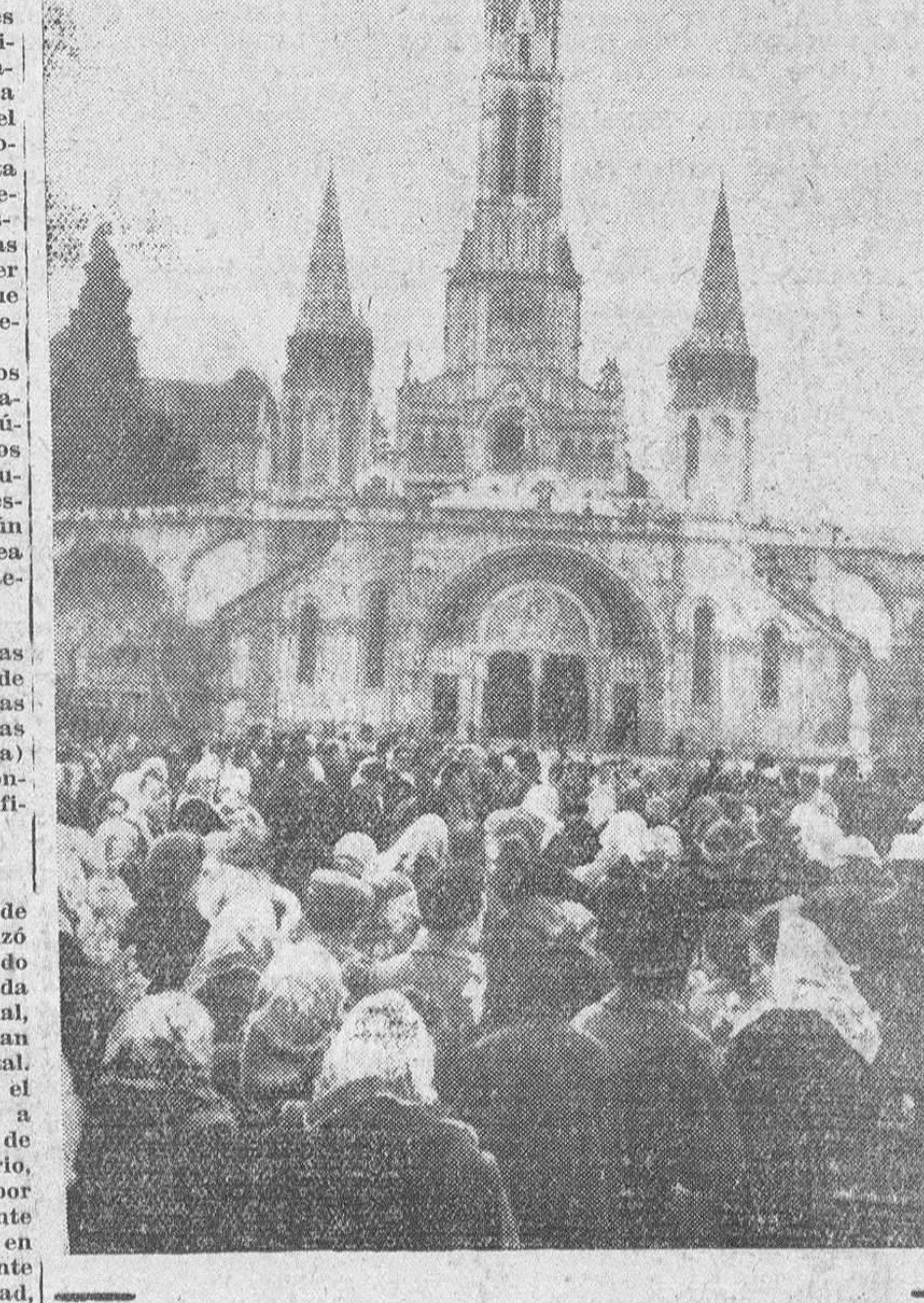
Lourdes. — El pasado día 11 se cumplieron los cien años de la primera de las Apariciones de la Virgen a Bernadette Soubirous en la gruta de Massabielle. Millares de peregrinos de todo el Mundo asistieron a las solemnes ceremonias celebradas. En la foto, un nutrido grupo de peregrinos ante la fachada principal de la basílica.