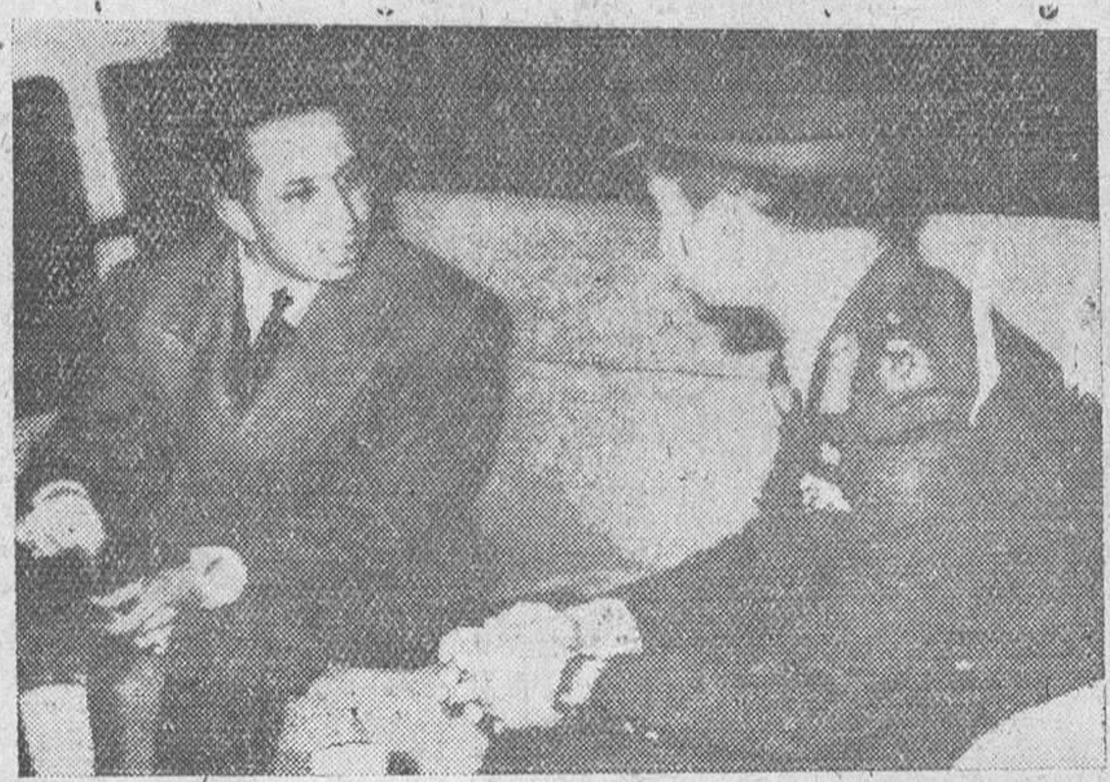
Amman (Jordania). — El Rey Faisal del Irak (a la izquierda) conversando con su primo, el Rey Hussein de Jordania, en el curso de las negociaciones llevadas a cabo entre ambos soberanos de 22 años de edad, y en las cuales ha quedado consolidada oficialmente la unión de ambos países en un Estado federal.

Amman.— Jordania e Iraq se han unido oficialmente en un Estado federal, con un solo Gobierno central, un Parlamento, un solo Ejército, la misma política exterior y una sola economía.