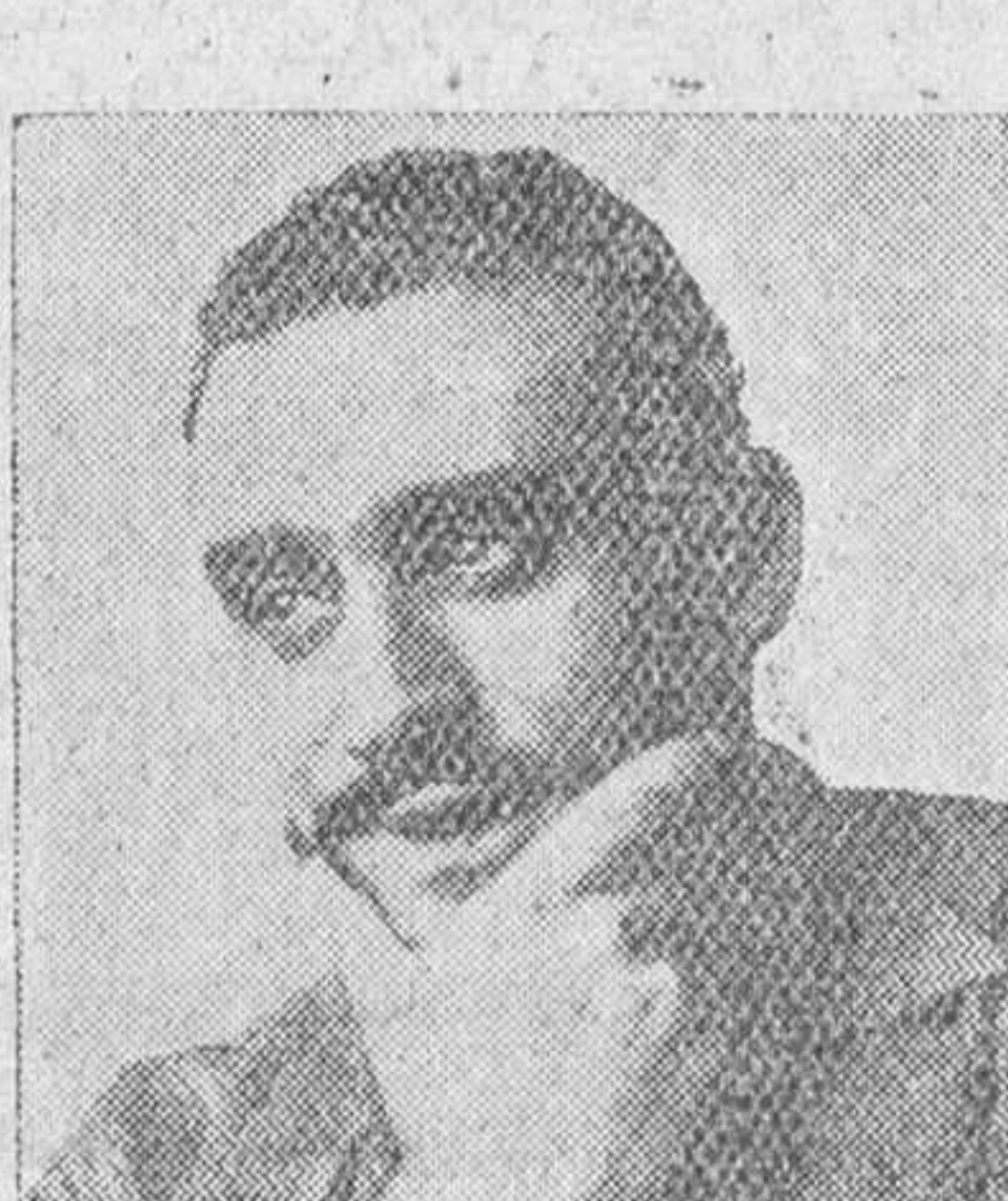
Manuel Ydígoras Revenga

Su obra "Algunos no hemos muerto", está incluida entre las grandes novelas bélicas del siglo XX