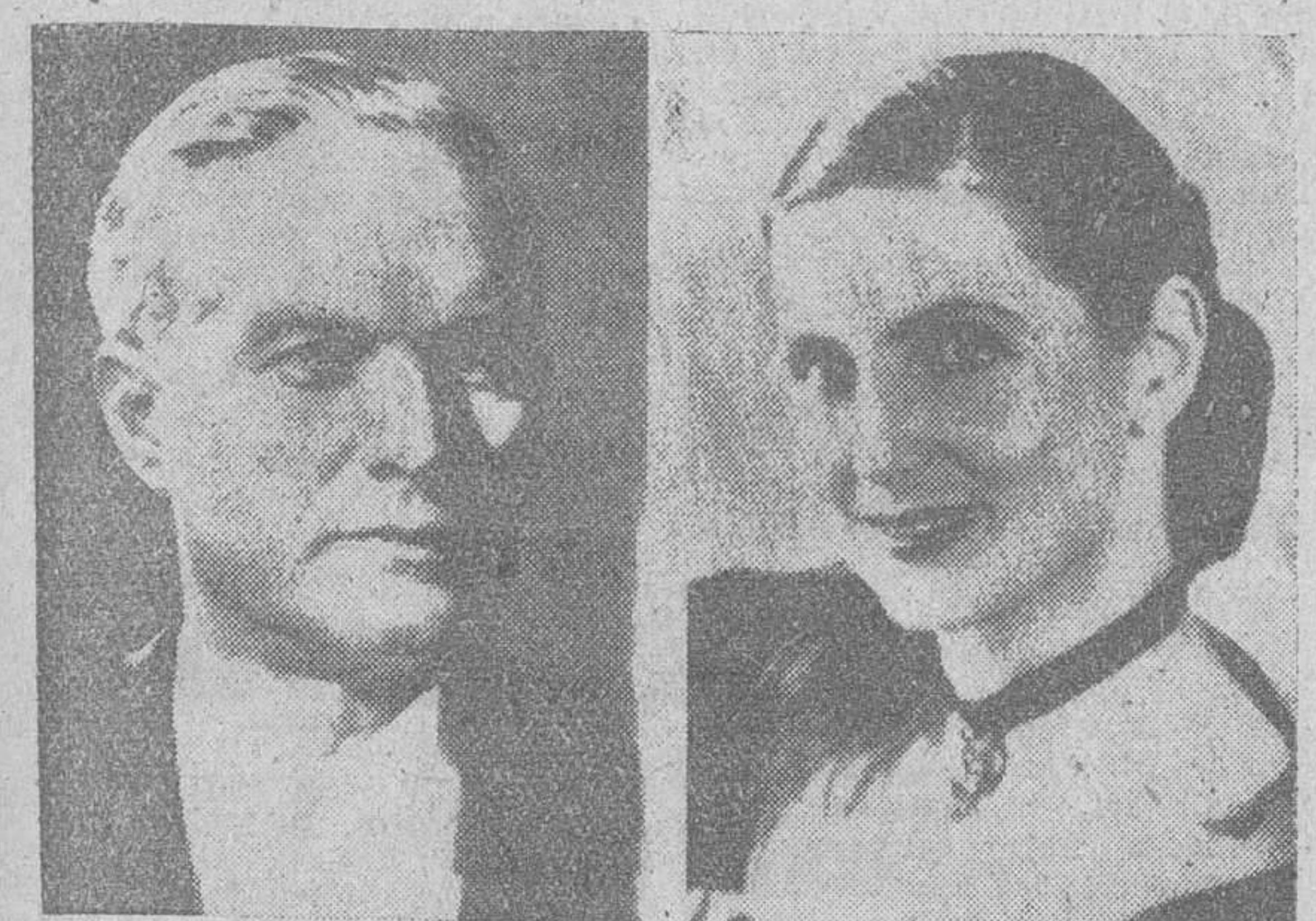
S. E. el presidente de la República del Líbano, Sr. Camille Chamoun, y su esposa doña Zalfa Chamoun, que ayer lunes llegaron a Madrid, en visita oficial a España.

Fueron recibidos en Barajas por el Caudillo y señora, Gobierno en pleno y otras personalidades