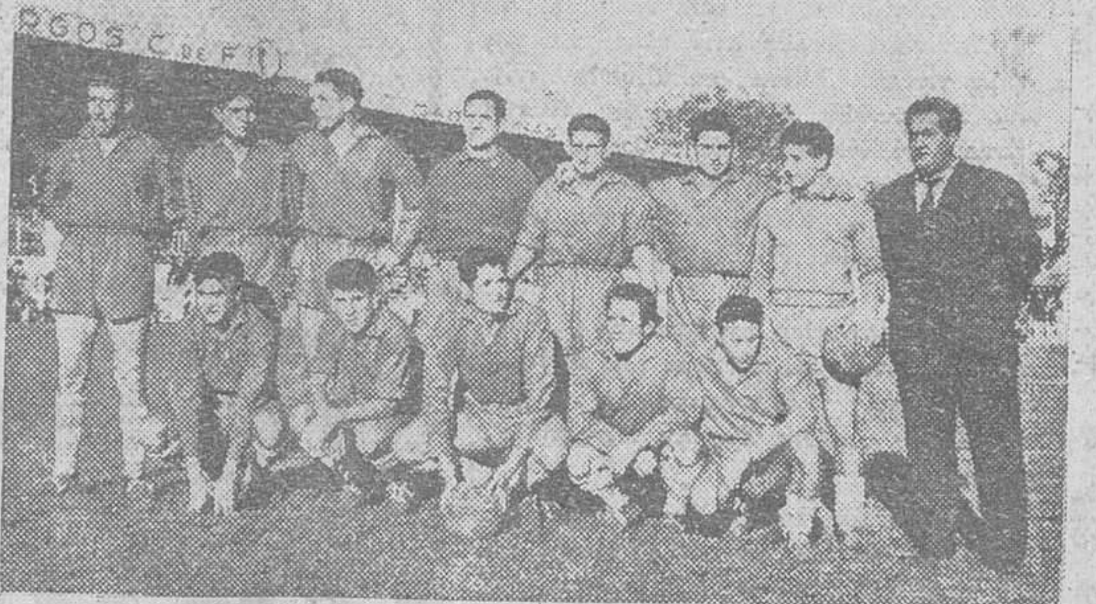
EL EQUIPO SAN PEDRO, DE PONFERRADA, QUE PERDIO EL DOMINGO EN ZATORRE POR 4-0