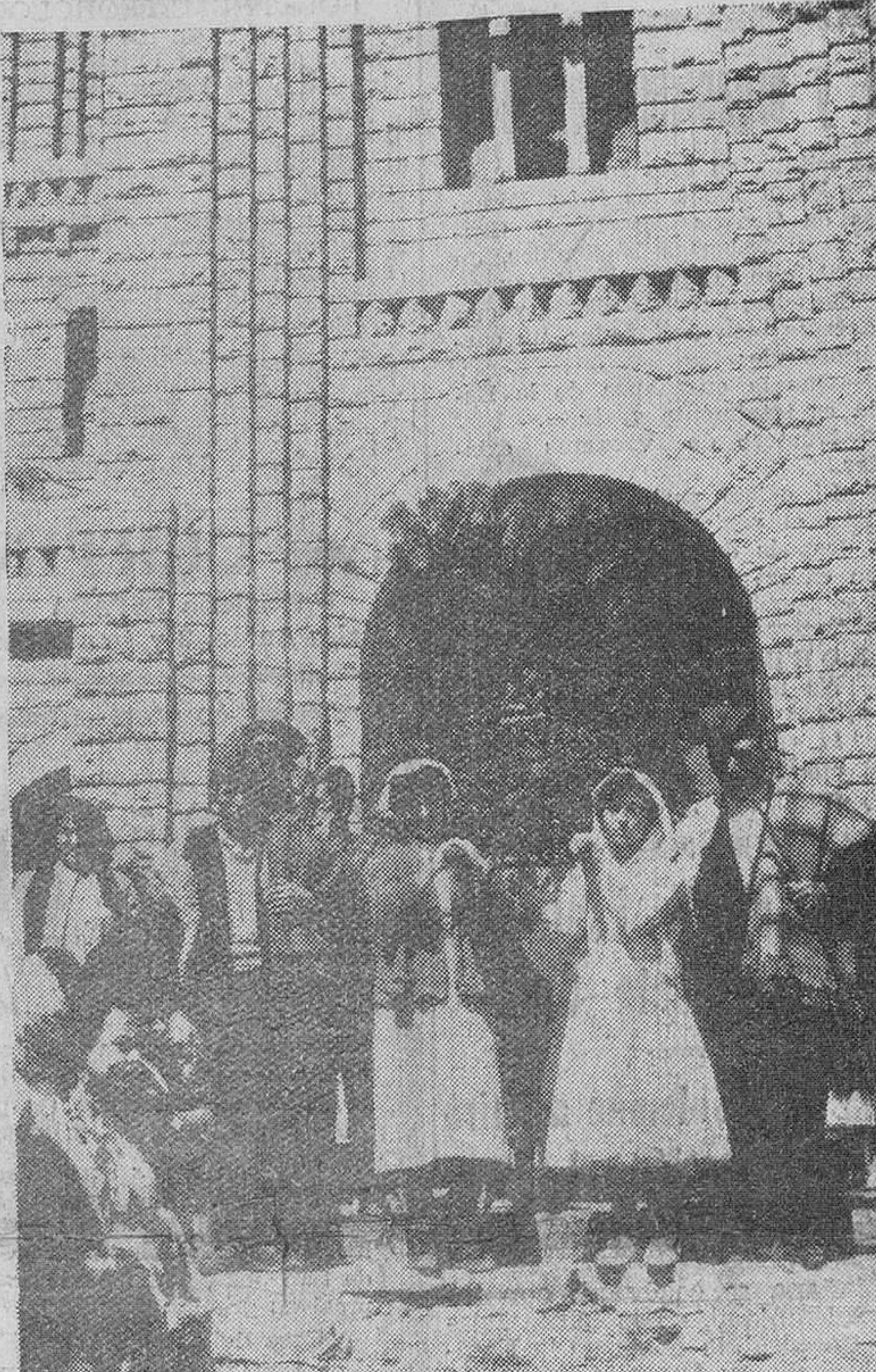
Nuria. — Un momento de la procesión de la imagen de Nuestra Señora de Nuria a su capilla primitiva de San Gil, que data de 1644, y en cuya fachada figuran la campana, olla y la cruz, símbolos con los cuales hizo su aparición esta venerada imagen en el Valle de Nuria.