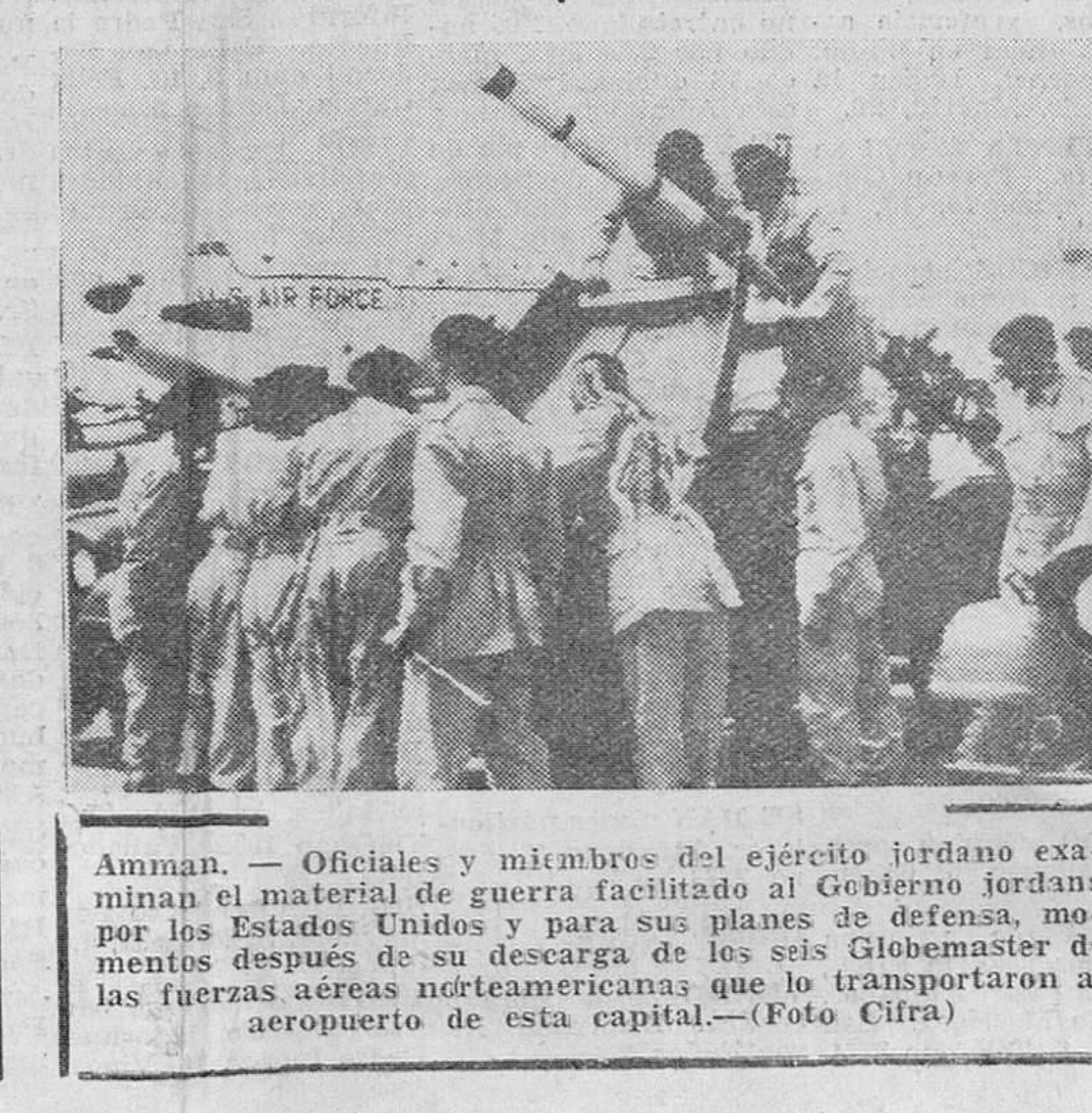
Amman. — Oficiales y miembros del ejército jordano examinan el material de guerra facilitado al Gobierno jordano por los Estados Unidos y para sus planes de defensa, momentos después de su descarga de los seis de transporte de las fuerzas aéreas norteamericanas que lo transportaron al aeropuerto de esta capital.