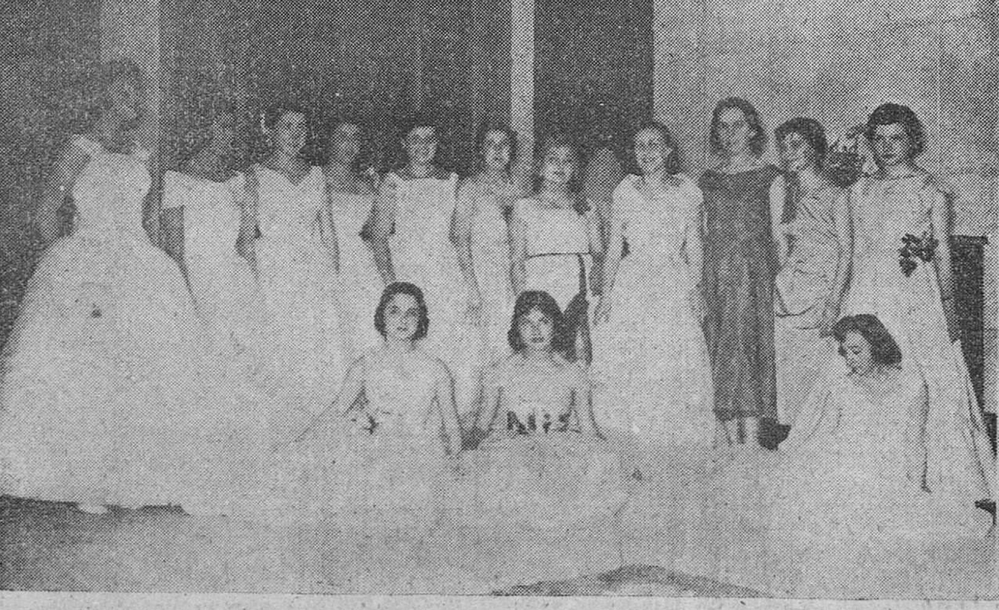
He aquí el grupo formado por catorce bellas señoritas de la buena sociedad burgalesa que, en la noche del jueves último, vistieron por vez primera sus galas de mujer, en el baile de gala celebrado en los salones de la Academia de Ingenieros, con motivo de la fiesta de San Fernando Rey, Patron del Arma.