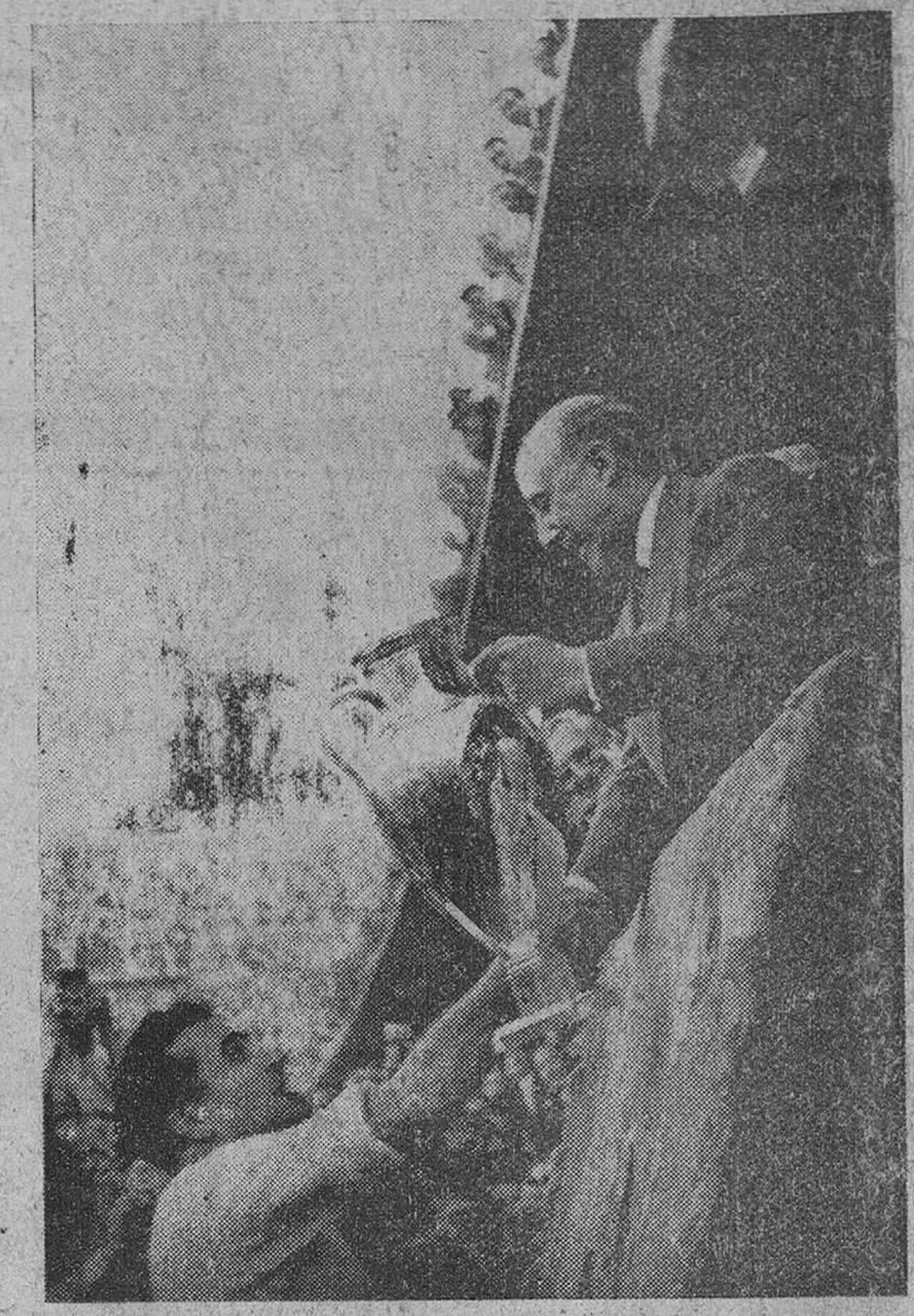
Madrid. — S. E. el Jefe del Estado, Generalísimo Franco, en el momento de entregar al capitán del Real Madrid, Muñoz, la Copa de campeón de Europa después del encuentro contra el Fiorentina, al que el conjunto madrileño venció en el estadio Santiago Bernabéu, por dos tantos a cero.