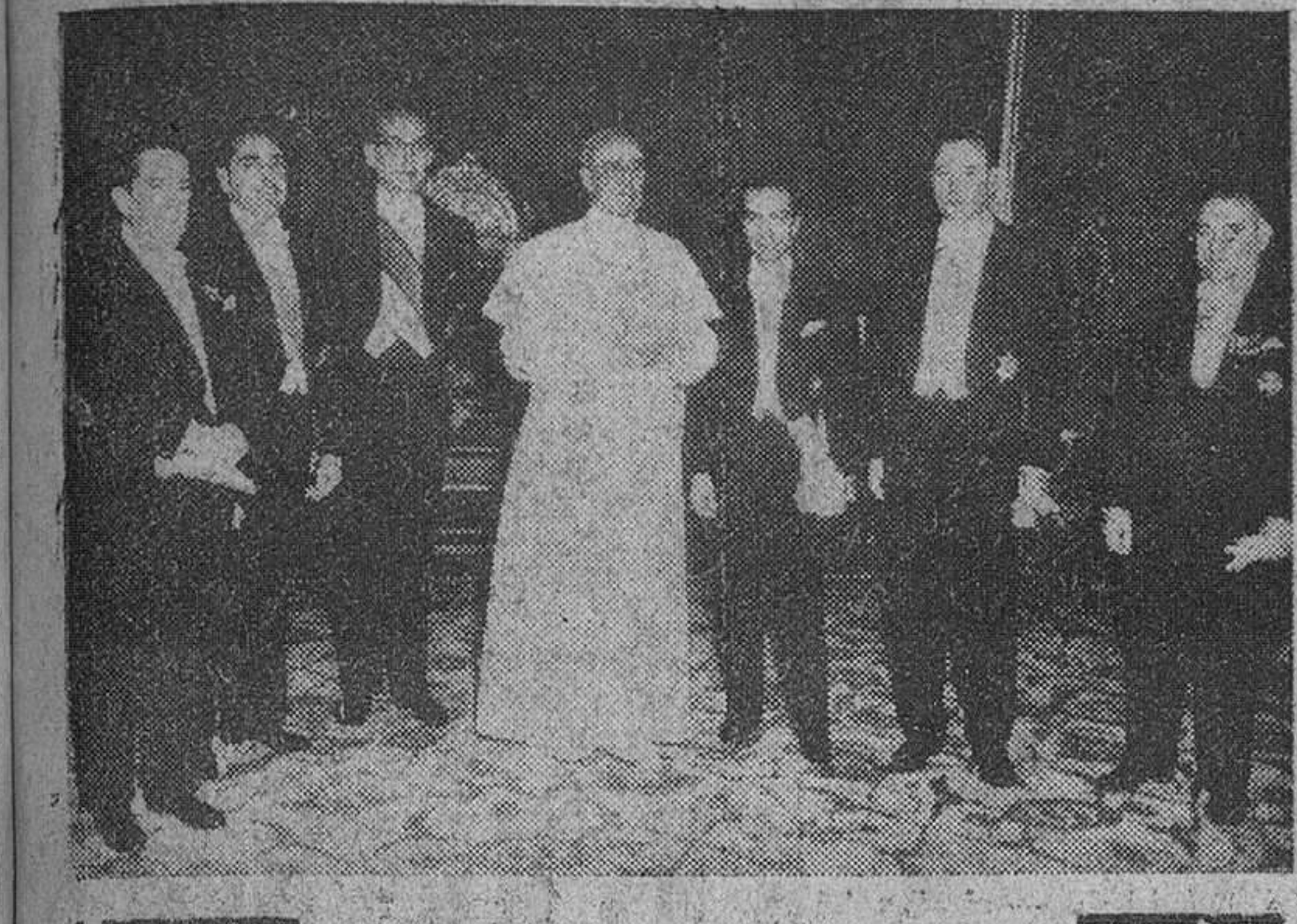
Ciudad del Vaticano. — S. S. el Papa durante la audiencia concedida al ministro de Comercio, D. Alberto Ullastres, y las personalidades que lo acompañaron, en su reciente viaje a Roma.