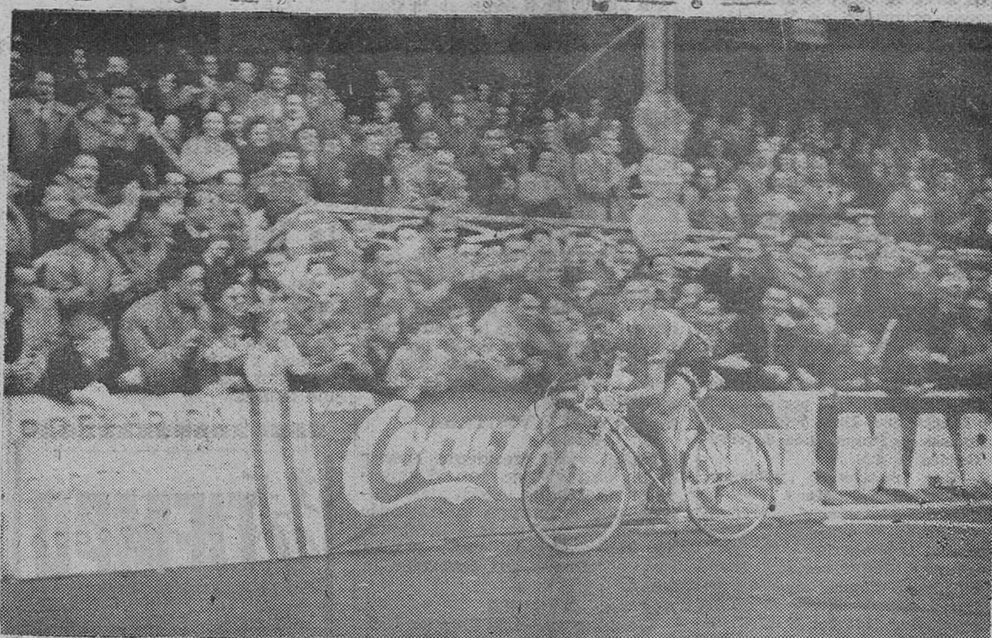
MIERES. — ENTRADA EN LA META DEL CORREDOR FEDERICO BAHAMONTES, GANADOR DE LA ETAPA Y DEL JERSEY AMARILLO. — (Foto Cifra)

Hassenforder resultó vencedor en Valladolid, batiendo al sprint a Walkowiak y al belga Van Cauten Luego llegaron Crespo (compañero de escapada de los anteriores) y el grueso del pelotón Etapa incolora, aunque se rodó fuerte Bahamontes sigue primero en la general