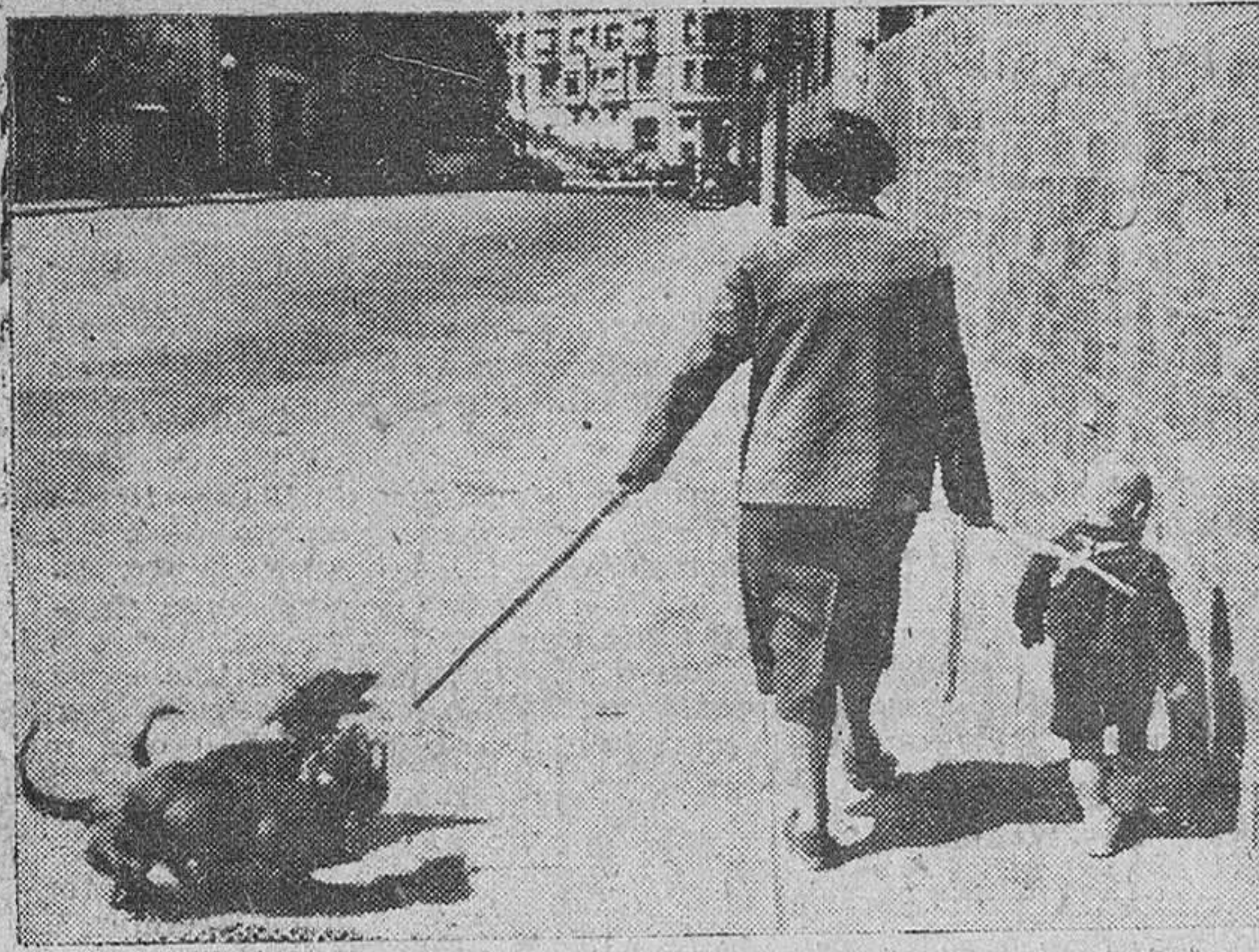
Barcelona. — Esta curiosa fotografía, captada en una calle barcelonesa, plantea el dilema de dilucidar si los sentimientos maternales son tan débiles que permiten conferir al hijo un tratamiento canino o si por el contrario, el amor a los perros es tan grande que induce a esta dama a colocarlos al mismo nivel que el niño... Elijan ustedes. Lo que está claro es la buena organización de esta esta señora, para evitar que nadie se le desmande.