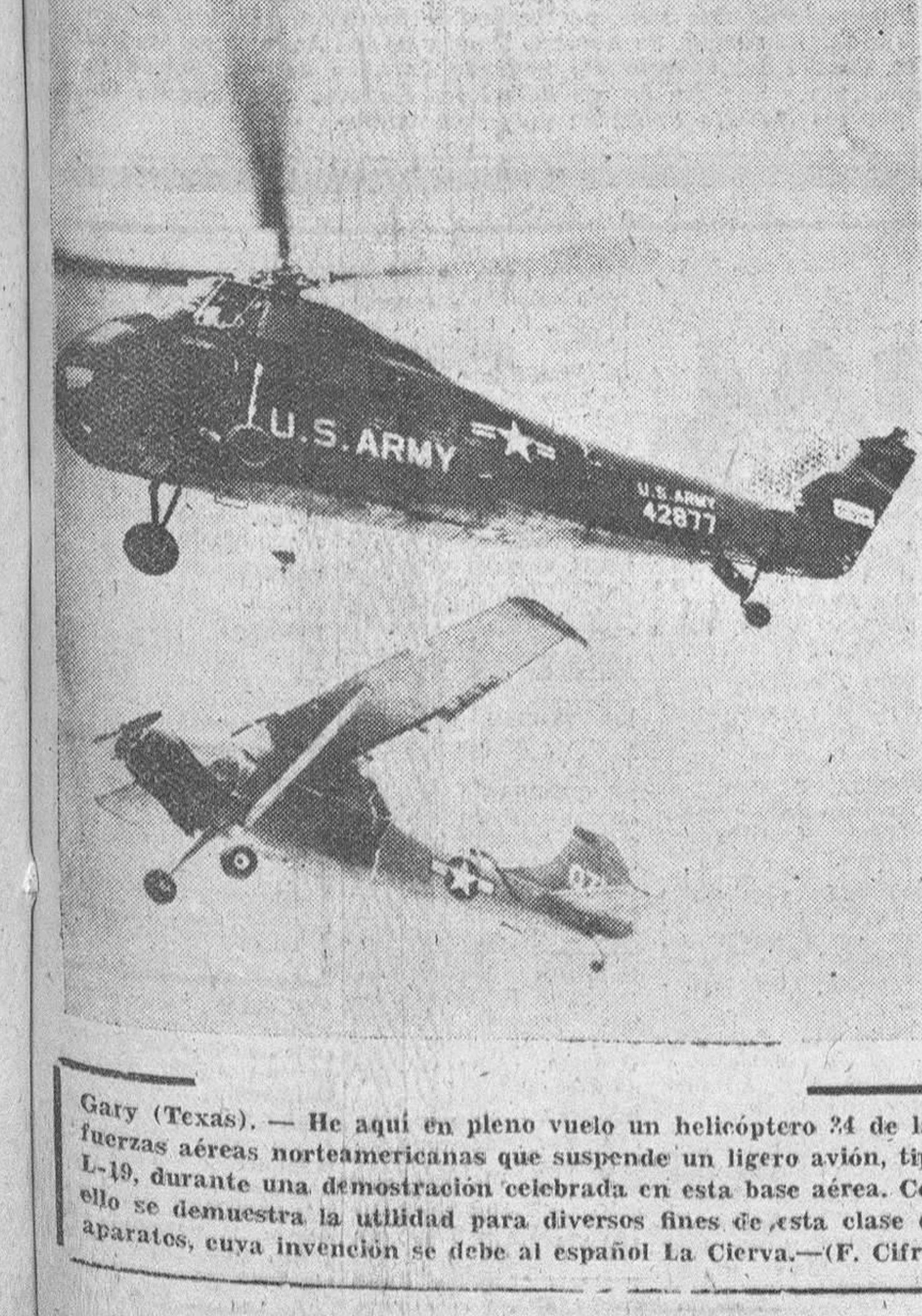
Gary (Texas). — He aquí en pleno vuelo un helicóptero 34 de las fuerzas aéreas norteamericanas que suspende un ligero avión, tipo L-19, durante una demostración celebrada en esta base aérea. Con ello se demuestra la utilidad para diversos fines de esta clase de aparatos, cuya invención se debe al español La Cierva.